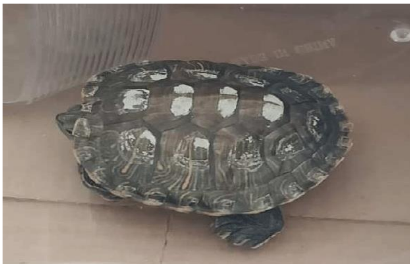
Slika 7. Ulcerativna bolest oklopa u vidu bijelih mrlja po sredini karapaksa crvenouhe kornjače prije liječenja