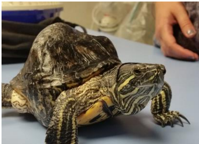
Slika 9. Deformitet oklopa crvenouhe kornjače nastao zbog metaboličke bolesti kostiju.

Poluvodene vrste mogu razviti sekundarne erozivne infekcije na plastronu i karapaksu koje nastaju zbog loše kvalitete vode i lošeg stanja oklopa (MCARTHUR, 2004.).