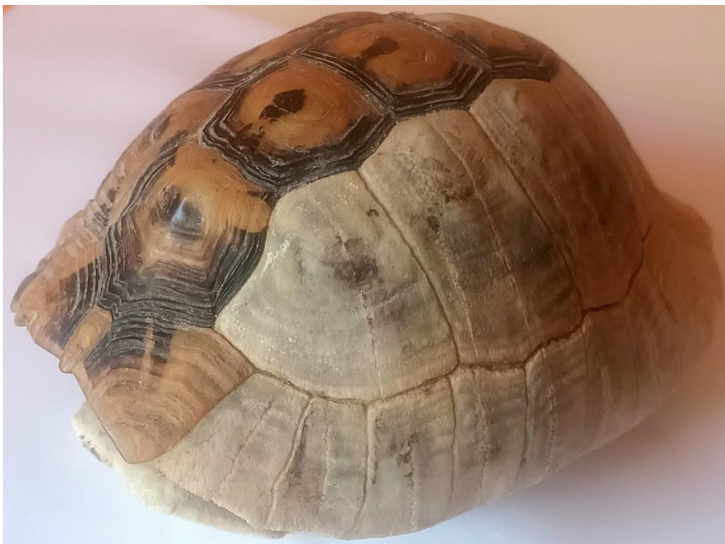
Slika 5. Prikaz rožnatih ljuski i kostiju na oklopu čančare pronađenom u prirodi