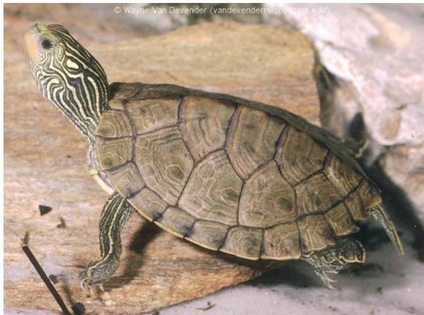
Slika 4. Kornjača vrste G. geographica

Ova je kornjača dobila ime po obilježjima na karapaksu a koja slične oznakama vodenih puteva koje se koriste na kartama i putokazima (CONANT i COLLINS, 1998.) (Slika 4.).