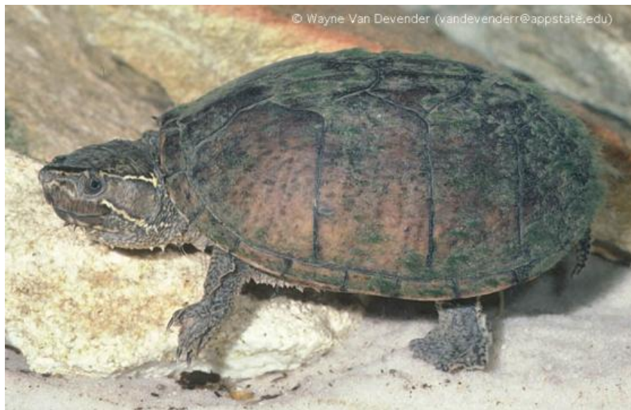
Slika 3. Mošusna kornjača ( S. odoratus )

Spolnu zrelost mužjaci dosežu sa 2-7 godina i 50-65 mm dužine karapaksa, te ženke sa 3-11 godina i 62-65 mm dužine (VAN DIJK, 2015.). Ženke polažu od jednog do šest legla sa 2-4 (1-9) jaja, a inkubacija obično traje 60-107 dana (56-132), ovisno o lokaciji (ERNST i LOVICH, 2009.).