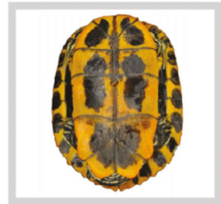
Slika 2. Usporedba boja i uzoraka u tri podvrste Trachemys scripta i zapadne crvenouhe kornjače