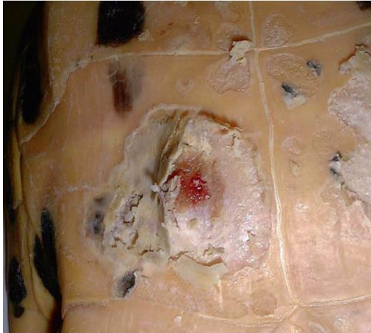
Slika 8. Duboka ulcerativna lezija na plastronu Trachemys scripta . Nakon debridmana lezija iz svježeg tkiva je izdvojena bakterija Aeromonas hydrophila

(FRYE, 1991.). Rožnate ljuske su mekane na dodir i odvajaju se od oklopa, uz ponekad prisutnu crvenkastu tekućinu ispod ljuski te neugodan miris (Slika 7.). Napredovanjem bolesti stvaraju se depresije ili rupice ispod površine oklopa koje daljnjim razvojem bolesti dovode do nepravilnog izgleda oklopa (BRIGGS, 2020.). Iz ovog stadija, infekcija može prijeći u septikemiju, uzrokujući multifokalnu nekrozu jetara i drugih visceralnih organa, hemolizu, paralizu udova i krvarenja (RIDGLEY, 2000.).