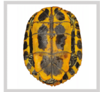
Slika 2. Usporedba boja i uzoraka u tri podvrste Trachemys scripta i zapadne crvenouhe kornjače