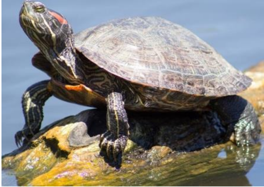
Slika 1. Crvenouha kornjača ( T. scripta elegans )