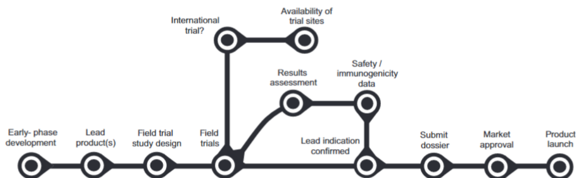
Slika 2. Hodogram razvoja cjepiva od rane faze razvoja do plasmana na tržište