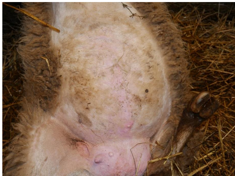
Slika 14. Fotografije ovce markice 655 s kontrole 8. prosinca 2022. od gore prema dolje: profil glave, dorzum nosa, trbuh/vime.