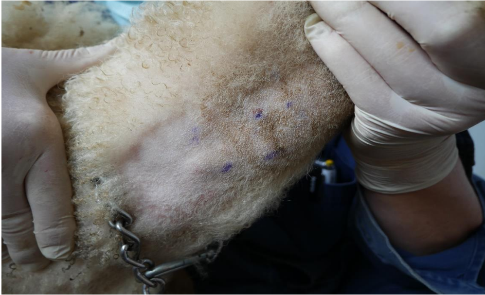
Slika 2. Rezultati intradermalnog alergološkog testa s uzorkovanja provedenog 21. svibnja 2021.