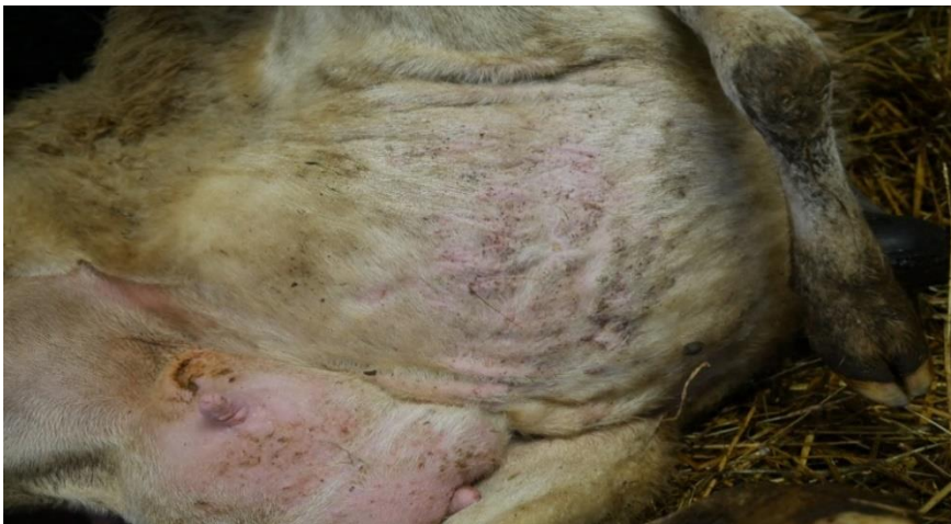
Slika 12. Fotografije ovce markice 651 s kontrole 8. prosinca 2022. od gore prema dolje: profil glave, dorzum nosa, trbuh/vime.