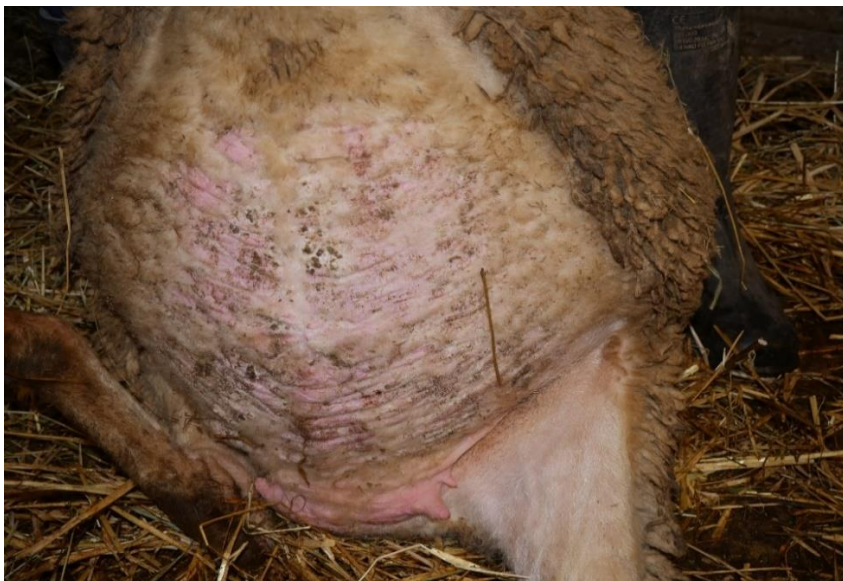
Slika 9. Fotografije ovce markice 518 s kontrole 8. prosinca 2022. od gore prema dolje: dorzum nosa, profil glave, trbuh/vime.