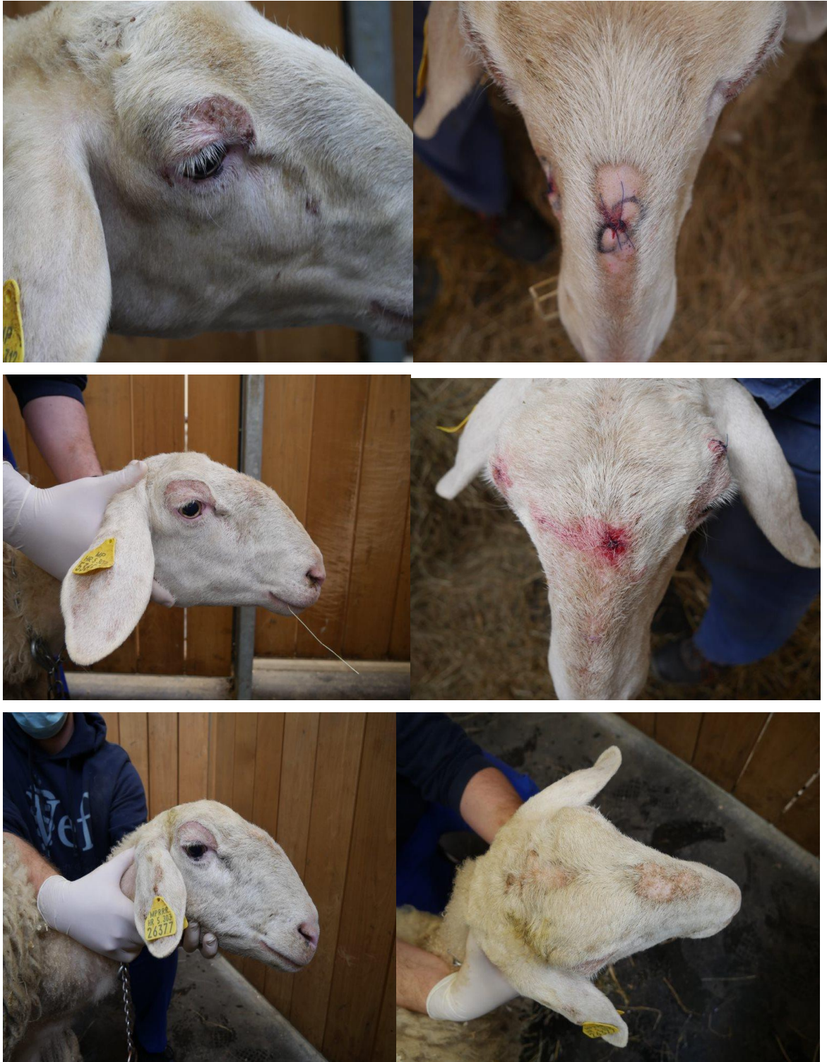
Slika 1. Fotografije simptoma na tri dovedene ovce 21. svibnja 2021. Na fotografijama su vidljive periorbitalne alopecije s pojedinim erodiranim područjima i krastama. Isti nalaz prisutan je kod sve tri ovce periorbitalno, na dorzumu nosa i temporalnom području.