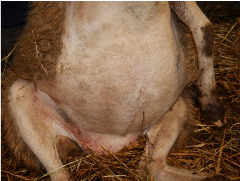
Slika 13. Fotografije ovce markice 654 s kontrole 8. prosinca 2022. od gore prema dolje: dorzum nosa, profil glave, trbuh/vime.