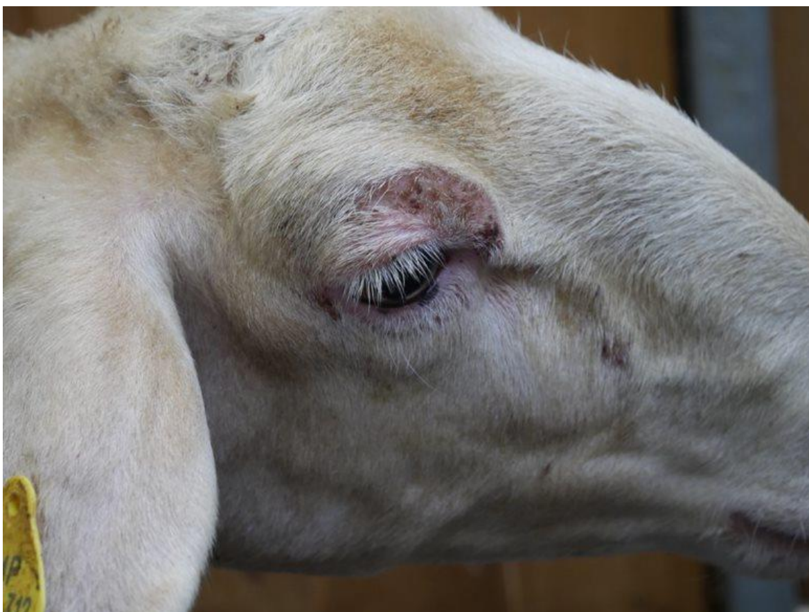
Slika 5. Ovca markice 518 prikazana na fotografiji (gore) bez kliničkih simptoma tijekom zimskih mjeseci i fotografija iste ovce (dolje) koja ima kliničke simptome tijekom ljeta.