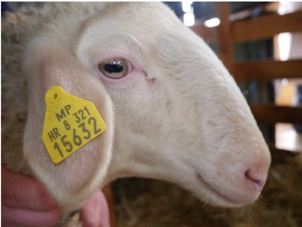
Slika 6. Ovca markice 632 fotografirana zimi bez kliničkih simptoma s kontrole 4. veljače 2022.

Iduće uzorkovanje krvi provedeno je 4. veljače 2022. ovce u ovom stadiju ne pokazuju kliničke simptome, borave u staji i hranjene su kukuruzom, ječmom i sijenom. Nalaz nam ide u prilog fotosenzibilizaciji zbog prestanka pojave kliničkih simptoma kad ovce ne borave na suncu. Zbog sumnje na trovanje toksinom gljivice Pithomyces chartarum , propisana je suplementacija cinkom u vidu premiksa Kuškovit i Vitared. U svrhu pronalaska spora, uzet je uzorak pašnjaka. Metodom standardne sedimentacije i „wash“ metodom nije uočena ni jedna spora gljivice Pithomyces chartarum .