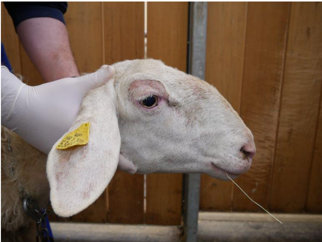
Slika 4. Ovca markice 653 prikazana na fotografiji (gore) bez kliničkih simptoma tijekom zimskih mjeseci i fotografija iste ovce (dolje) koja ima kliničke simptome tijekom ljeta.