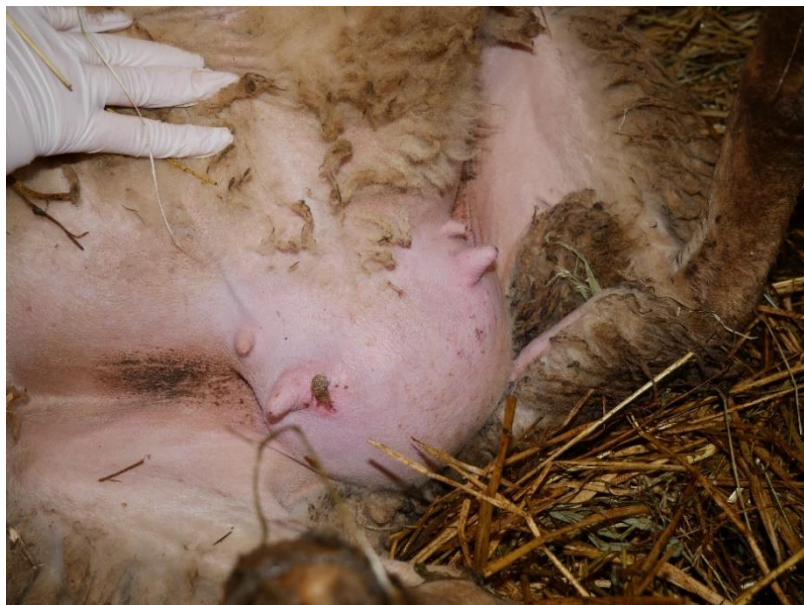
Slika 7. Fotografije ovce markice 347 (s) s kontrole 8. prosinca 2022. od gore prema dolje: dorzum nosa, profil glave, trbuh/vime