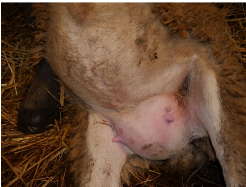
Slika 8. Fotografije ovce markice 348 (s) s kontrole 8. prosinca 2022. od gore prema dolje: dorzum nosa, profil glave, trbuh/vime.