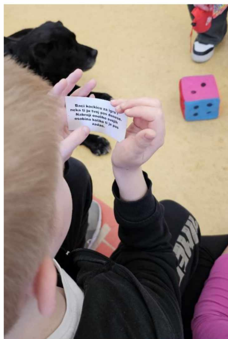
Slika 11. Primjer izvođenj programa čitanja uz pomoć pasa

Programi čitanja uz pomoć pasa obećavaju kao inovativna metoda za uključivanje nevoljkih čitatelja i njihovo motiviranje. U takvim programima posebno dresirani psi posjećuju učionice i knjižnice, a djeca im čitaju (Slika 11). Djeca koja se muče s čitanjem mogu biti motivirana da više čitaju, jer smatraju da su psi smirujući i neosuđujući (LANE i ZAVADA, 2013.). Kako navode KIRNAN i sur. (2016.), terapijski pas utječe na povećanje motivacije djeteta za čitanjem, pozitivno utječe na razvoj samopouzdanja tijekom te radnje i time dovodi do postupnog znatnog poboljšanja čitalačkih vještina djeteta.