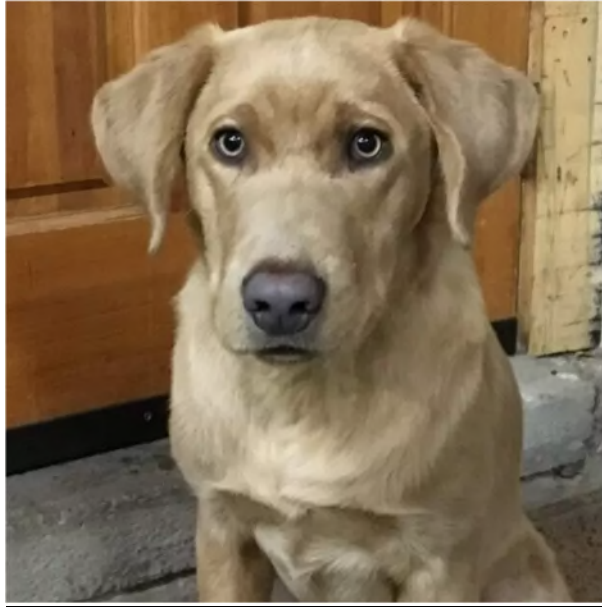
Slika 5. Champagne labrador.