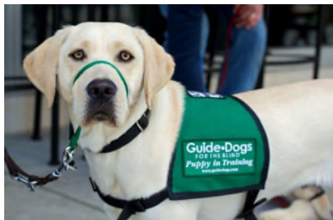
Slika 9. Pas pomagač.

zrelog psa s izgrađenom osobnošću i prilagođenog na sve životne sredine i okolnosti u kojima se budući korisnik psa može naći. Nakon završetka socijalizacije, provodi se ocjenjivanje psa nakon čega, ukoliko je ocjena zadovoljavajuća, pas započinje program školovanja koji traje osam mjeseci. Terapijski psi se dodjeljuju korisnicima kako bi smanjili negativne učinke raznih bolesti i stanja na svakodnevni život. Psi pomagači (Slika 9) se dodjeljuju obiteljima s djecom koja pate od raznih poteškoća u razvoju (poremećaji iz autističnog spektra, Downov sindrom, motoričke i govorno-komunikacijske poteškoće) kako bi poboljšali razvojni proces djeteta i kako bi dodatno motivirali dijete tijekom terapijskih vježbi (SACHS-ERICSSON i sur., 2002.).