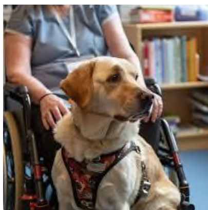
Slika 10. Pas pomagač osobama u invalidskim kolicima.

Psi pomagači također imaju ključnu ulogu kod pomoći osobama u invalidskim kolicima (Slika 10), poboljšavajući njihovu dobrobit. Pomažu u nošenju i podizanju stvari, prilikom otvaranja vrata, pale i gase svjetla te obavljaju mnoge druge slične zadatke, čineći tako osobe s invaliditetom neovisnijima od drugih što im daje osjećaj samostalnosti