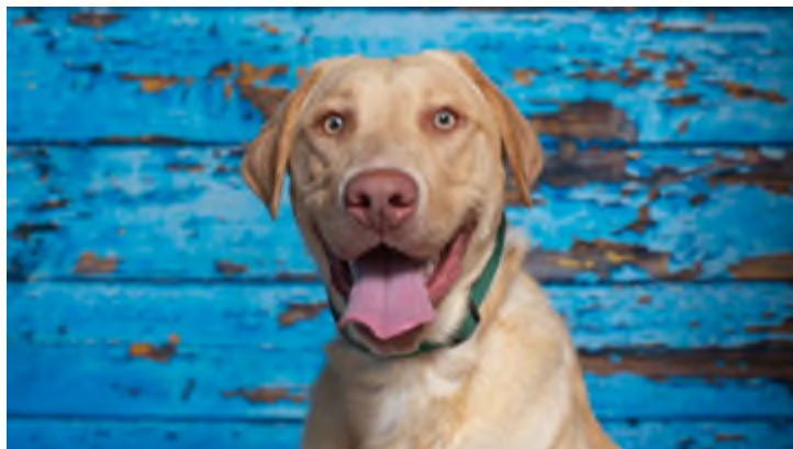
Slika 2. Dudley labrador.