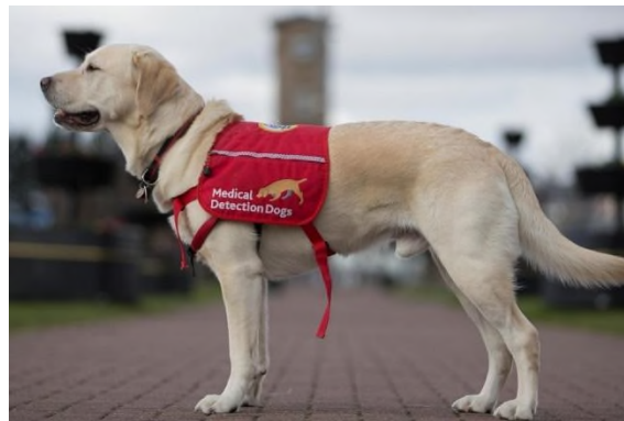
Slika 12. Pas za detekciju zdravstvenih stanja.

50%. Ove varijacije u „performansama“ mogu biti posljedica dodatnih zdravstvenih problema vlasnika ili problema s upravljanjem dijabetesom, ili znakovi problema u obuci pasa. Osim toga, psi koji su bili osposobljeni duže vrijeme pokazivali su veću osjetljivost na visoke razine glukoze, ali manju osjetljivost na niske razine. Ova pojava sugerira da odnos između psa i vlasnika utječe na sposobnost pasa da otkriju hiperglikemiju, dok niske razine detektiraju uglavnom koristeći mirisne signale. Psi koji su radili s djecom pokazali su općenito nižu osjetljivost, što može biti rezultat toga što psi nisu prisutni sa svojom djecom u školi. Analiza pozitivnih prediktivnih vrijednosti pokazuje da je medijan od 81% nastao tijekom OOR epizoda, što je znatno više od 12% koje su izvještavali drugi znanstvenici. Unatoč različitim faktorima koje su instruktori naveli kao doprinos varijacijama u rezultatima, evidentno je da osobine psa i ljudskog partnera igraju ključnu ulogu u učinkovitosti partnerstva.