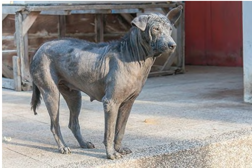
Slika 6. Color dilution alopecia .