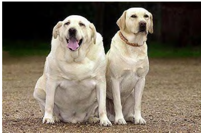
Slika 8. Pretili pas i pas normalne tjelesne mase.

Mutacija u POMC genu kod pasa sprječava proizvodnju dva kemijska posrednika u mozgu, beta-melanocit-stimulirajućeg hormona ( \beta -MSH) i beta-endorfina, ali ne utječe na proizvodnju trećeg, alfa-melanocit-stimulirajućeg hormona ( \alpha -MSH). Daljnje laboratorijske analize pokazale su da su \beta -MSH i beta-endorfini važni u određivanju gladi i regulaciji potrošnje energije, a njihova uloga neovisna je o prisutnosti \alpha -MSH.