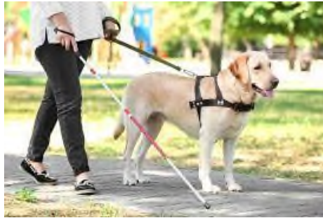
Slika 11. Pas vodič slijepih.

U skupini pasa pomagača nalaze se i psi vodiči slijepih (Slika 11), koji pomažu osobama s oštećenjem vida (SACHS-ERICSSON i sur., 2002.). Posebno školovanog psa vodiča slijepih ima pravo dobiti svaka slijepa osoba koja je prethodno savladala osnove prostorne orijentacije. Takva osoba mora biti spremna na život sa psom u svom domu, mora proći obuku za korištenje psa vodiča te slijediti upute instruktora.