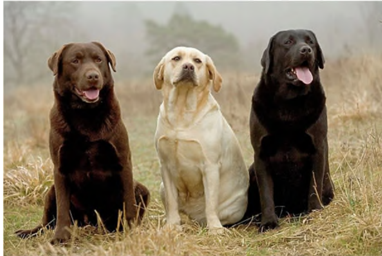
Slika 1. Tri osnovne boje labradora.

Psi koji nose dvije kopije recesivnog alela (dd) pokazuju ovu specifičnu boju, dok psi s barem jednom kopijom dominantnog alela (D) zadržavaju standardnu pigmentaciju. Kada se pare psi s genotipom Dd, postoji mogućnost da neki potomci naslijede ovu varijantu boje. Istraživanje PHILIPP i sur. (2005.) ukazuje na to da su mutacije u genu melanofilin (MLPH), koji igra ključnu ulogu u distribuciji pigmenta u dlaci, povezane s ovom pojavom.