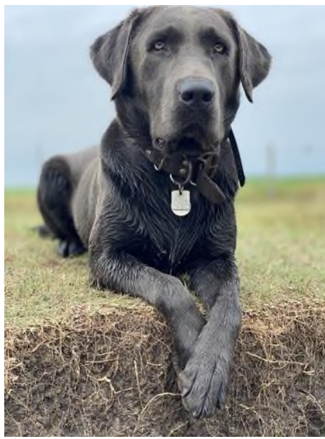
Slika 4. Charcoal labrador.