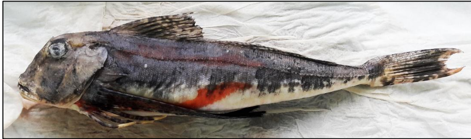
Slika 3. Lastavica glavulja

Uobičajeno naraste od 20 cm, iznimno do 40 cm, a dostiže tjelesnu masu od 1 kg (JARDAS, 1996.).