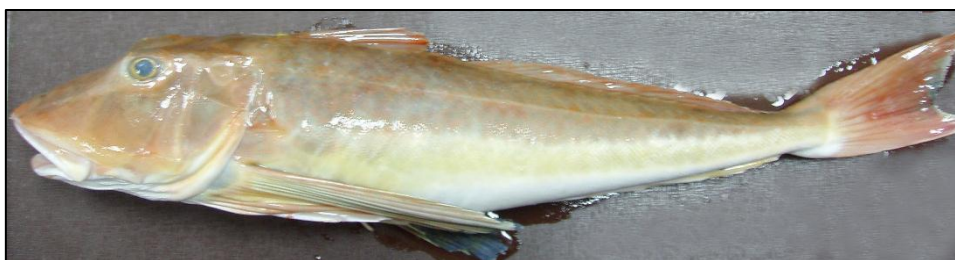
Slika 2. Lastavica balavica

Uobičajeno naraste od 20 do 40 cm, iznimno do 75 cm, a dostiže tjelesnu masu od 6 kg (JARDAS, 1996.).