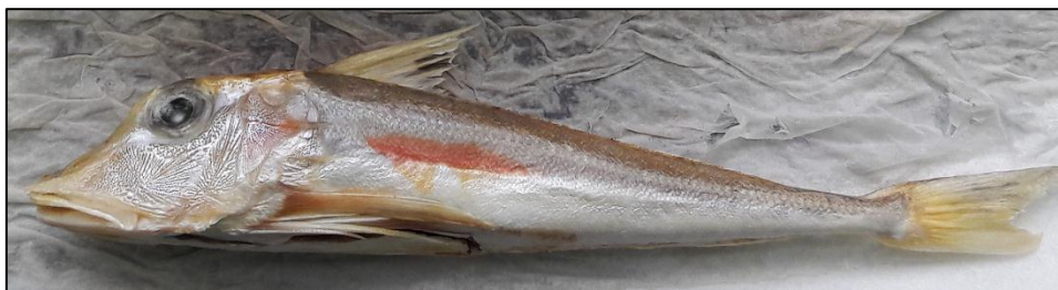
Slika 1. Lastavica prasica