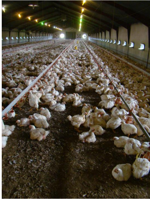
Slika 2. Objekt za tov pilića (Matković, 2013.)