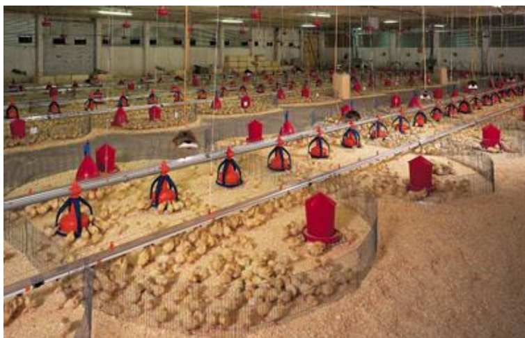
Slika 1. Jednodnevni pilići u krugovima

Zbog nerazvijene termoregulacije u prvim danima života pilići se stavljaju ispod „umjetne kvočke“ koja im osigurava potrebnu toplinu. Mora ih se stalno nadzirati i kontrolirati te po ponašanju zaključiti dali im je pretoplo ili prehladno.