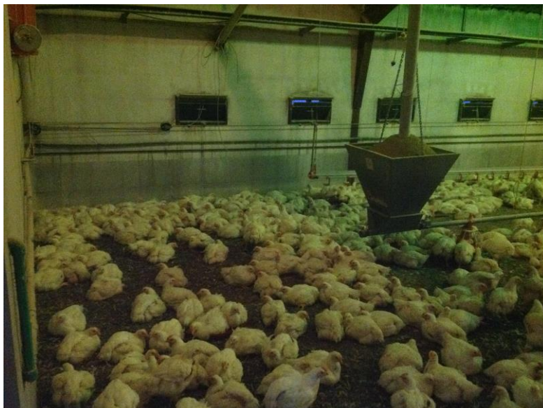
Slika 3. Oprema za hranjenje pilića (Matković, 2013.)

održavanje opće higijene. No, ako je viša temperatura ambijenta, tada pilići piju znatno veće količine vode. Zbog isparavanja i prolijevanja vode iz pojilica potrebno je osigurati 300 do 400 ml vode na dan po piletu (Vučemilo, 2008.).