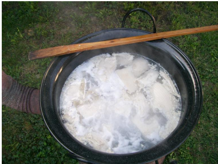
Slika 4: Kuhanje komada leđne slanine u vodi na temperaturi vrenja