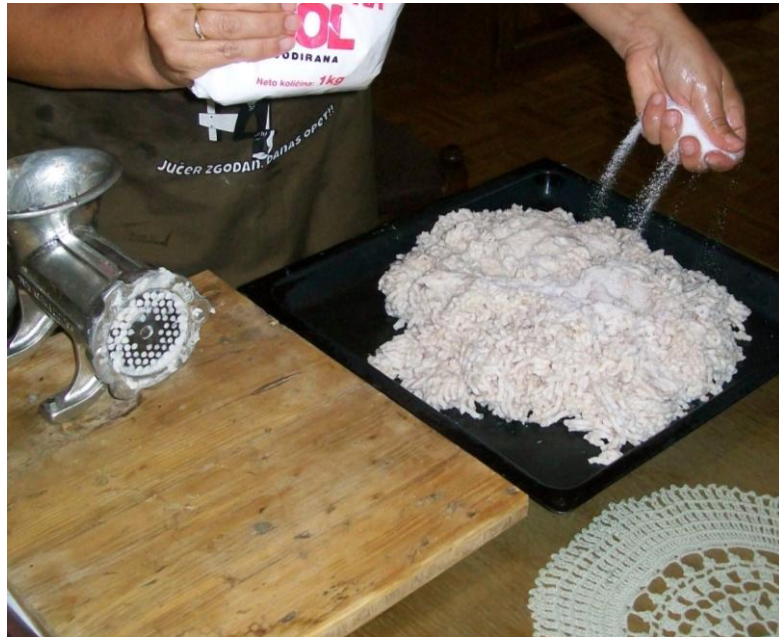
Slika 7: Soljenje usitnjene masti