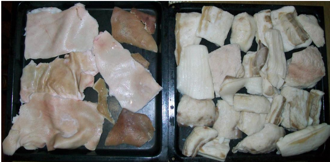
Slika 5: Odvajanje kože od masti