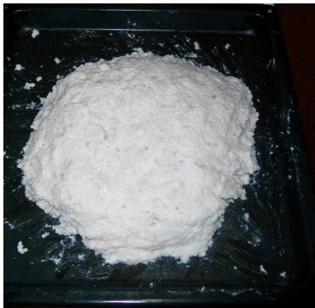
Slika 2: Kosana mast

Kvarenje masti može se pouzdano ocijeniti pomoću senzorne pretrage koju je potrebno nadopuniti probom pečenja, a po potrebi i dodatnim fizikalno-kemijskim pretragama (ŽIVKOVIĆ, 1986.). Ranketljiva aroma se detektira u drugoj fazi senzorne analize, u ustima. Usitnjen proizvod, pomiješan sa slinom, izložen povišenoj temperaturi, postepeno otpušta hlapljive tvari osobito polarne, koje ulaze u nos i stimuliraju stanice olfaktornih receptora. Neugodna aroma uzrokovana je kompleksnom smjesom hlapljivih i nehlapljivih tvari. Pridjevi povezani uz aromu oksidiranih lipida su: užegao, metaličan, sapunast, lojast, uljnat, jedak, riblji, travnat, po krastavcu, i sl. Osim detekcijom neugodnog mirisa ranketljivost se može utvrditi i promjenom boje. Određivanje peroksidne vrijednosti je uz senzornu analizu, najstarija metoda procjene oksidacije masti (LOVAAS, 1992.; OISHI i sur., 1992.; GRAU i sur., 2000.).