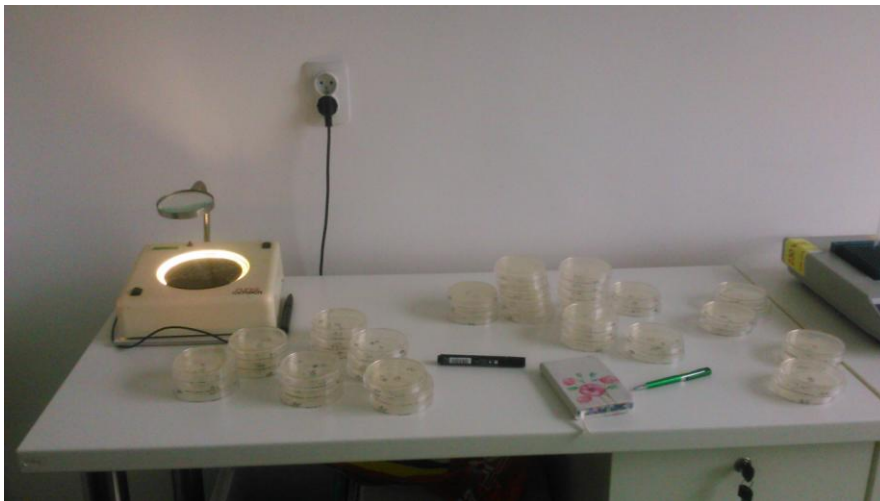
Slika 11 : Brojenje kolonija

Inokulirane ploče se okreću (poklopac prema dolje) i termostatiraju na odgovarajućoj temperaturi. Nakon inkubacije čije je trajanje kao i temperatura uvjetovana vrstom mikroorganizama koje pretražujemo, broje se kolonije u svakoj petrijevoj zdjelici koja sadrži manje od 300 kolonija (osim ako je drukčije propisano u specifičnoj formi). Neophodno je da broj kolonija na najmanje jednoj petrijevoj zdjelici bude veći od 10. Nakon inkubacije ploče treba odmah pregledati. Ako nije moguće odmah, mogu se držati u hladnjaku najviše 24 sata.