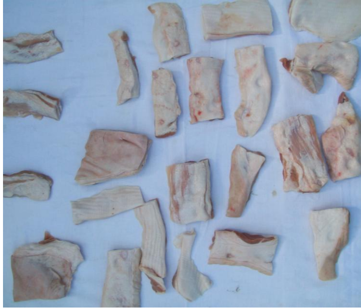
Slika 3: Komadi leđne slanine veličine 10x20cm