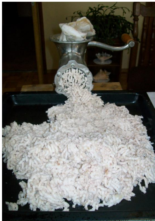
Slika 6: Usitnjavanje masti u stroju za mljevenje