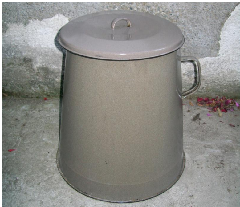
Slika 9: „tiblica“ („lodrica“) u koju se slaže mast