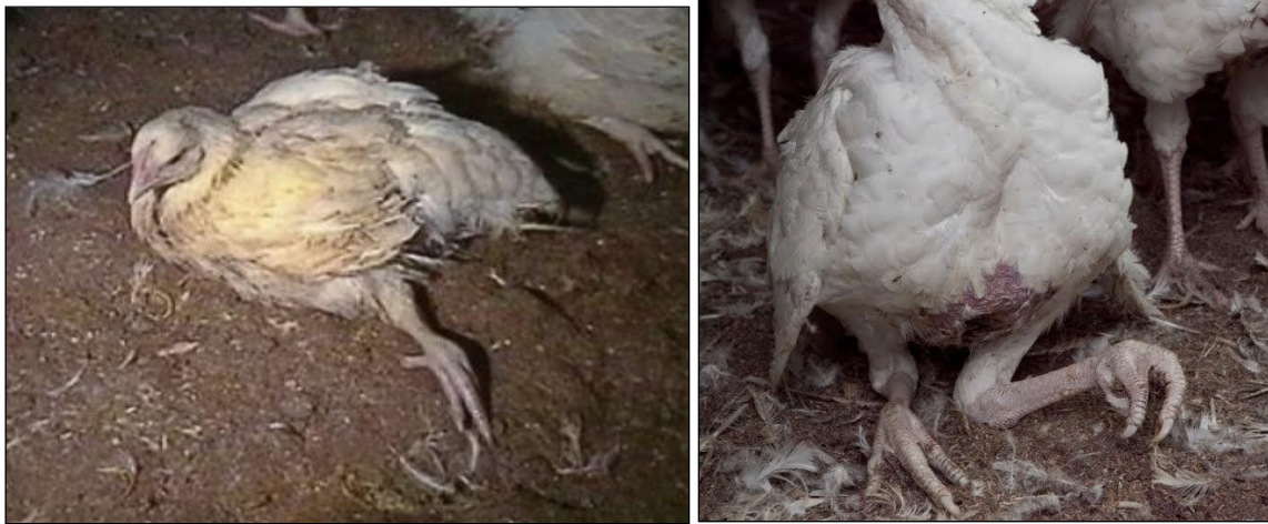
Slika 16. Deformacije nogu kod pilića u tovu

uginuća iznosi tek 37 do 69 sekundi. Ascites se razvija postupno te je karakteriziran hipertrofijom i dilatacijom srca, promjenama u funkciji jetara, insuficijencijom pluća, hipoksemijom i zadržavanjem veće količine tekućine u trbušnoj šupljini (Vučemilo, 2008.).