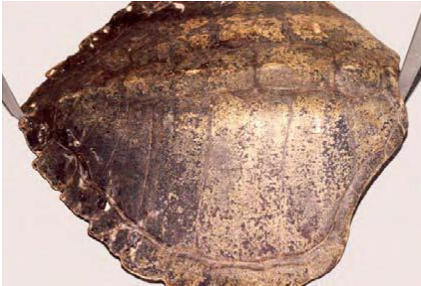
Slika 5. Mjerenje najmanje ravne duljine karapaksa (WYNEKEN, 2001.)

Mjerimo najmanju ravnu duljinu karapaksa (SCL-min) (Slika 5.) i najmanju zakrivljenu duljinu karapaksa (CCL-min) od sredine vratne ploče do usjeka nadrepne ploče.