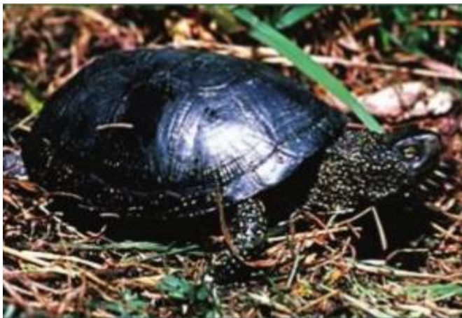
Slika 2. Barska kornjača (MATAŠIN i sur., 2007.)

najčešće tek idućeg proljeća. Mesojed je i hrani se manjim ribama, žabama, punoglavcima, crvima i kukcima. Veći plijen koji ne može progutati odjednom pridržava prednjim udovima i oštrim bezubim čeljustima otkida komadiće mesa (MATAŠIN i sur., 2007.). Barske kornjače ugrožene su iz više razloga kao što su gubitak i zagađenje staništa toksičnim tvarima (herbicidi, pesticidi, insekticidi, teški metali i slično), naftom i njenim derivatima, melioracijom tla, kanaliziranjem tokova rijeka i ostalim načinima promjene prirodnih staništa. Mjere kojima se mogu zaštititi su: nadziranje primjene umjetnih gnojiva, pesticida, herbicida i insekticida na poljoprivrednim površinama na područjima gdje vrsta obitava, provođenje aktivnih mjera zaštite voda te ugradnja pročišćivača na industrijske uređaje koji bi mogli otpuštati toksične i opasne tvari u vodotoke. Nužno je zabraniti lov i postrožiti carinski pregled pri izvozu za prodaju kućnih ljubimaca. Posebno treba nadzirati uvoz egzotičnih vrsta barskih kornjača ( Trachemys sp. ) zbog mogućeg prijenosa zoonoza i zabraniti njihovo ispuštanje u slobodnu prirodu jer se time narušava prirodni ekosustav i mogu postati invazivna vrsta opasna po opstanak autohtone vrste (KLETEČKI, 2006.).