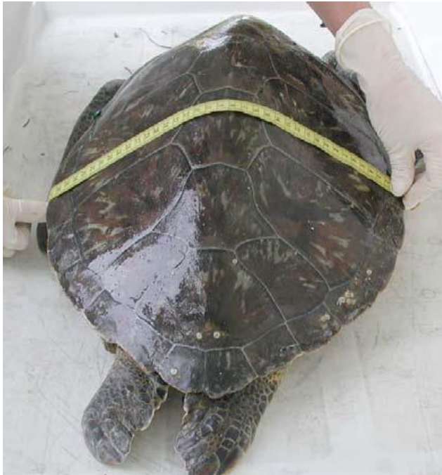
Slika 7. Mjerenje zakrivljene širine karapaksa (WYNEKEN, 2001.)

Širina karapaksa uzima se na dva načina: pomičnim mjerilom mjerimo ravnu širinu karapaksa (SCW) i savitljivom trakom mjerimo zakrivljenu širinu karapaksa (CCW) (Slika 7.) na najširim dijelovima oklopa te moramo paziti da mjerimo okomito.