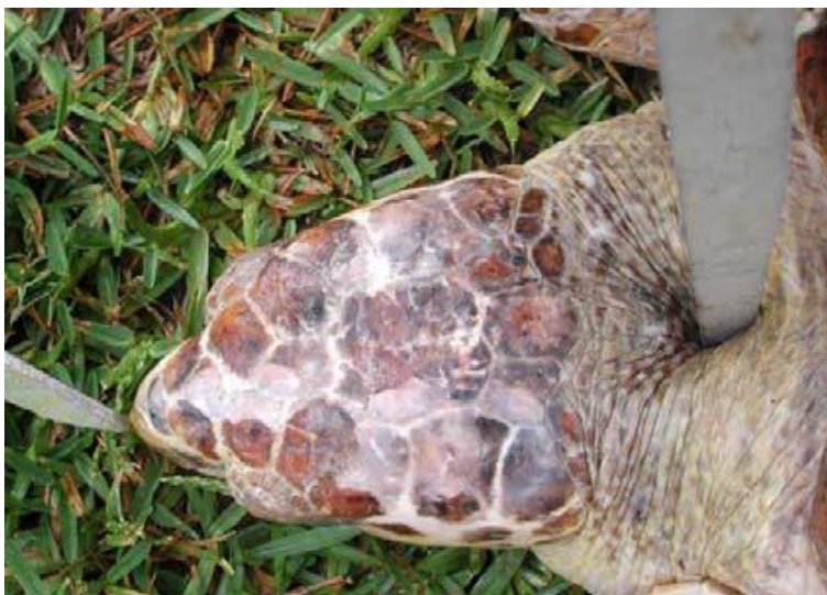
Slika 8. Mjerenje duljine glave (WYNEKEN, 2001.)

Širinu glave (HW) mjerimo pomičnim mjerilom na najširem dijelu glave, odnosno ovisno o vrsti na kranijalnom dijelu čeljusti ili na kaudalnom dijelu glave.