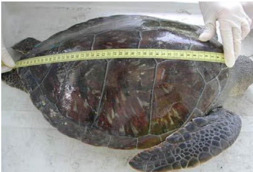
Slika 6. Mjerenje maksimalne zakrivljene duljine karapaksa (WYNEKEN, 2001.)

Potom mjerimo maksimalnu ravnu duljinu karapaksa (SCL-max) i maksimalnu zakrivljenu duljinu karapaksa (CCL-max) (Slika 6.) od najkranijalnog rubnog dijela oklopa do najkaudalnijeg dijela repne ploče.