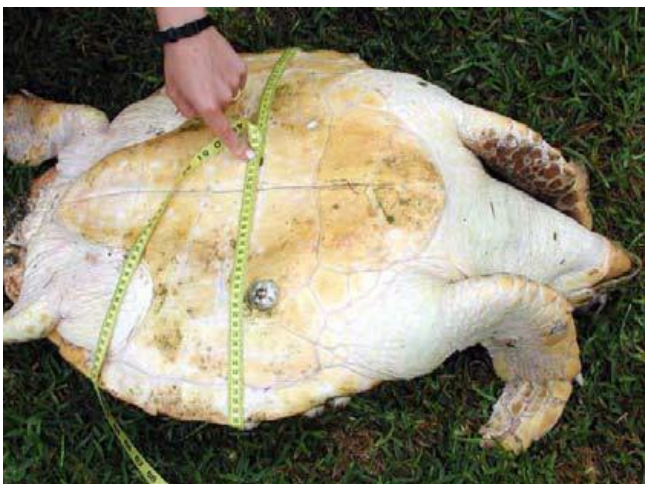
Slika 10. Mjerenje opsega kornjače savitljivom trakom (WYNEKEN, 2001.)

Duljinu plastrona (SPL i CPL) mjerimo od najkranijalnije do najkaudalnije točke, odnosno rožnate ploče (Slika 9.), a pri okretanju životinje moramo paziti da to ne činimo prebrzo. Ukupna duljina repa (TTL) mjeri se od završnog dijela plastrona do kraja repa. Duljina od plastrona do kloake (PVTTL) mjeri se od završetka plastrona do sredine kloake, a završna je duljina od sredine kloake do vrha repa (VTTL). Opseg kornjače (Slika 10.) mjeri se isključivo savitljivom trakom, može se mjeriti dok je životinja na leđima ili na trbuhu, a mjeri se uvijek na mjestu okomitom na dužinsku os oklopa (WYNEKEN, 2001.).