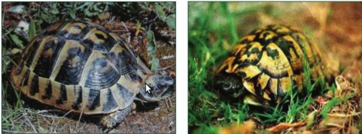
Slika 1. Obična čančara (MATAŠIN i sur., 2007.)

Prema zakonu o zaštiti životinja i pravilniku o zaštiti divljih svojti zabranjeno je uznemiravanje, uzimanje iz prirode kornjača ili njenih jaja i prodaja istih, kao i uništavanje staništa, obitavališta i gnijezda ili legla, te prodaja, kupnja ili pribavljanje na bilo koji drugi način, kao i prepariranje ovih životinja (ANON, 2006).