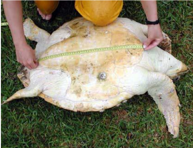
Slika 9. Mjerenje duljine plastrona kornjače (WYNEKEN, 2001.)

Duljinu glave (HL) (Slika 8.) mjerimo po središnjoj liniji i to od vrha gornje čeljusti do kraja lubanje koju palpiramo pri mjerenju. Visinu oklopa (BD) mjerimo od sredine karapaksa do sredine plastrona, a ukoliko je kornjača prevelika i teška okrenemo je na bok vrlo pažljivo i mjerimo pomičnim mjerilom.