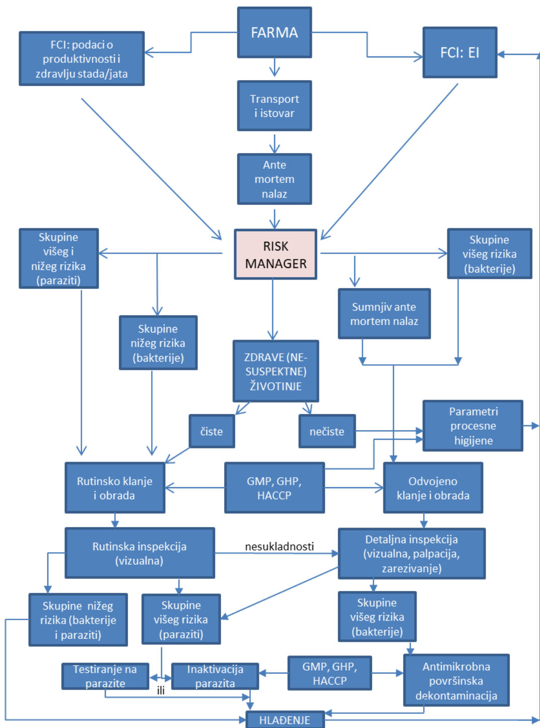
Slika 8. Model sustava sigurnosti trupova u klaonici temeljen na riziku (prilagođeno prema BUNCIC, 2014.)