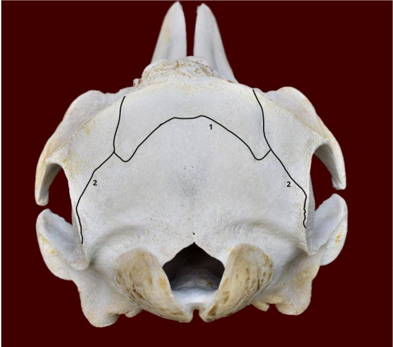
Slika 1. Lubanja dobrog dupina iz Jadranskog mora - norma caudalis. Označeni su sljedeći šavovi: sutura occipitointerparietalis (1) i sutura lambdoidea (2).

Usljed odstupanja od položaja kostiju glave, koji je uobičajen za većinu domaćih i ostalih kopnenih sisavaca, u dobrog dupina uočene su znatne razlike u položaju šavova lubanje. Položaj šavova na lubanji dobrog dupina nije dosada opisan te su u okviru ovog istraživanja izrađene fotografije lubanja i ucrtani determinirani šavovi (slika 1, 2, 3 i 4)