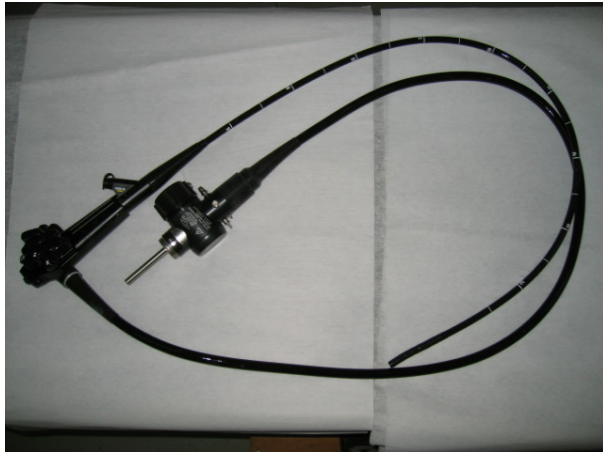
Slika 3.: Fleksibilni endoskop

Svaki fleksibilni videoendoskop sastoji se od nekoliko dijelova: