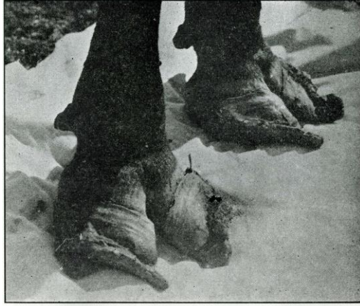
Slika 5. Deformacije papaka u goveda uzrokovana otrovanjem selenom