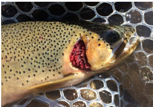
Slika 7. Deformirani leš pastrve s nedostatkom škržnog poklopca iz rijeke Elk (Paul Samyca, Yale Environment 360, 2019.)

Nadalje, u jezeru Belews u Sjevernoj Karolini, posljedično dugotrajnim izljevima (1974- 1986. god.) velikih količina otpadnih voda iz termoelektrane koje su sadržavale enormne količine selena ( 150\text{-}200\mu\text{ Se/L} ), došlo je do ugibanja mnogih životinjskih vrsta te je pri tome eliminirano 19 vrsti riba.