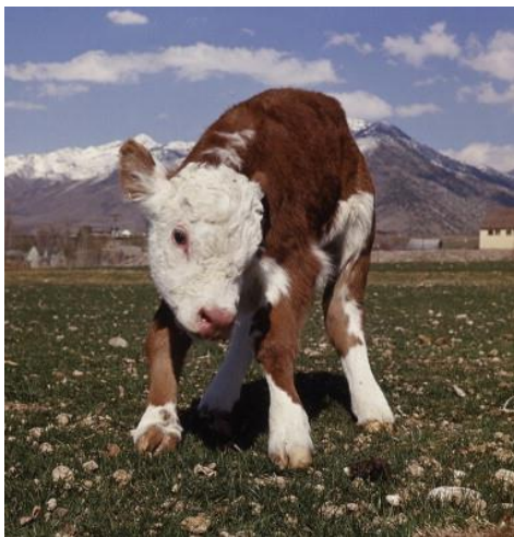
Slika 4. Tele sa simptomima alkali disease bolesti

Životinje koje su u jednom istraživanju konzumirale hranu koja sadrži 5 do 40 mg/kg selena kroz više od nekoliko tjedana ili mjeseci razvile su kroničnu selenozu, alkali disease (MAAG I GLENN, 1967, OLSON, 1978.).