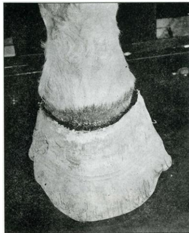
Slika 6. Deformacija kopita u konja uzrokovana otrovanjem selenom

Poznato je kako ingestija prekomjerne količine selena kroz duži period značajno utječu na reproduktivni sustav domaćih životinja te se poremećaji javljaju i bez vidljivih tipičnih znakova alkali disease bolesti (OLSON i sur., 1970.). Zabilježene su i smetnje u koncepciji te bolesti plodova u goveda, konja i ovaca za vrijeme hranjenja mješavinom hrane koja je sadržavala 20- 50 mg selena /kg hrane (HARR i MUTH, 1972.).