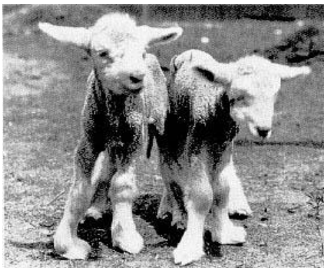
Slika 3. Janjad sa simptomima alkali disease bolesti

Klinički znakovi koji obilježavaju ovaj oblik otrovanja su oštećenje vida, izgubljenost, nestabilnost te respiratorna oštećenja (MAGG i GLENN, 1967., VAN KAMPEN i JAMES, 1978.).