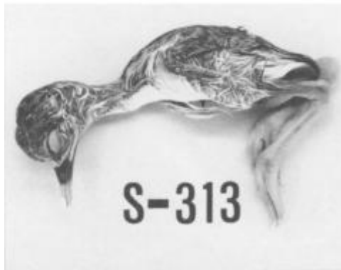
Slika 8. Deformirani pilići izleženi u Kesterson rezervoaru

Prema navedenim primjerima daje se zaključiti kako materijali nastali kao produkti rudarstva, agrikulture te petrokemijske industrija su značajan faktor u zagađenju i kontaminaciji okoliša selenom. Njegova cirkulacija prirodom u stanju je uvelike poremetiti njenu ravnotežu te imati kobne posljedice za zdravlje životinja, ali i ljudi.