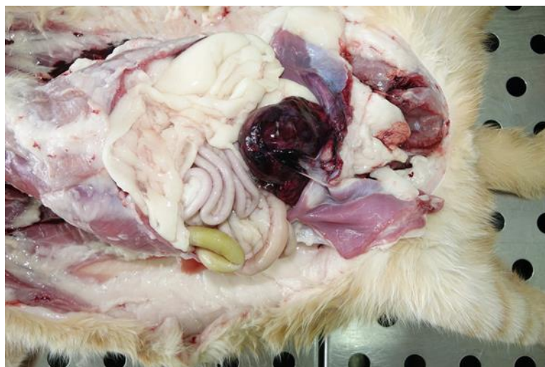
Slika 1. Mačka, hemoragični cistitis. Stjenka mokraćnog mjehura prožeta krvarenjem.

Najznačajniji nalaz koji možemo pronaći na razudbi kod životinja upravo je onaj od urinarne opstrukcije. Takve mačke imaju proširen, napet ili rupturiran mokraćni mjehur. Ureteri su najčešće bilateralno prošireni kao i zdjelica bubrega. Sama stjenka mokraćnog mjehura je stanjena i često ima točkasta krvarenja po sluznici ili difuzna krvarenja (slike 1. i 2.). Kada se urin ispusti iz mokraćnog mjehura bilo rupturom, incizijom tijekom operacije ili razudbom, tada je stjenka mjehura flacidna, a sluznica je često tamno crvena i ulcerirana. Urin sadrži obilje eritrocita i krvne ugruške. Uretralni čep ili uroliti koji uzrokuju opstrukciju dovode do ulceracije sluznice, lokaliziranih hemoragija lamine proprije i nekroze sluznice u ureterima, mjehuru ili uretri. Ako dođe do zaživotne rupture mjehura, na mjestu rupture će biti prisutan krvni ugrušak i fibrin, a ponekad može doći do akutnog, lokaliziranog sterilnog peritonitisa (BRESHEARS i CONFER, 2017.). Uretralni čepovi kao i uroliti mogu dovest do azotemije i smrti (CIANCIOLO i MOHR, 2016.). Kod kristalurije koja je inducirana određenim kemikalijama poput salicilata može doći do erozije i hiperplazije mokraćne stjenke, a predstavlja i rizik za nastanak neoplazme mokraćnog mjehura (BELL i LULICH, 2015.).