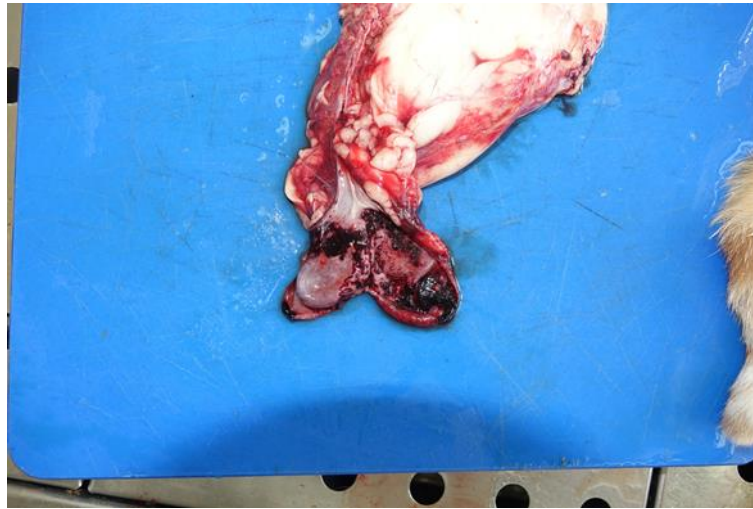
Slika 2. Mačka, hemoragični cistitis. Otvoren mokraćni mjehur, multifokalna krvarenja po sluznici.

Mikroskopska slika očituje se nalazom upale stjenke i krvarenja u donjem dijelu mokraćnog trakta. Lezije su značajnije ako je trakt u potpunosti opstruiran. Sluznica je obično ulcerirana, a područja hiperplastičnog prijelaznog epitela su prožeta vrčastim stanicama. Lamina proprija je infiltrirana upalnim stanicama, neutrofilima su prisutni u središtu ulceracija, a limfociti i plazma stanice se nalaze perivaskularno ili difuzno u lamini propriji. Krvarenja su često transmuralna, a najizraženija su u sluznici gdje mogu dovesti do odvajanja snopova glatkih mišićnih vlakana do njihove nekroze i degeneracije u težim oblicima (BRESHEARS i CONFER, 2017.).