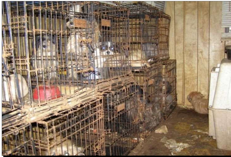
Slika 7. Nehumani uzgoj pasa, eng. „ puppy mills “

Eng. „ puppy mills “ su komercijalni uzgajivački objekti u kojima se u nehumanim uvjetima uzgaja pse isključivo radi zarade, a u kojima nisu zadovoljene fiziološke i etološke potrebe pasa (McMillan, 2012.). Zbog mnoštva životinja, psi se drže u lošim, pretrpanim kavezima, 24 sata dnevno, sedam dana u tjednu, često s malo ili nimalo kontakta s ljudima ili vanjskim svijetom ((Katz, 2009.; Bloch, 2020.). U objektima nazvanima „ puppy mills “ pse su smješteni u nehigijenskim uvjetima, bez odgovarajuće veterinarske skrbi, ali u mnogim državama uzgajivači i dalje imaju licence koje im omogućavaju rad (Katz, 2009.). Zbog smještaja u takvim uvjetima tijekom cijelog reproduktivnog života i neodgovarajuće socijalizacije, odrasli psi (udomljeni) i štenci iz takvih uzgoja (kupljeni) često očituju probleme u ponašanju kada jednom, kao kućni ljubimci, dođu u kućanstvo. Potkrijepljeno istraživanjem, psi iz takvih objekata u usporedbi s psima iz normalnih uzgoja, imaju veće stope zdravstvenih problema, straha, a znatno niže stope održivosti i energije. Također pokazuju manju stopu agresivnosti prema drugim psima, nepoznatim ljudima i vlasniku. Iako na prvu djeluje pozitivno, proizlazi iz straha koji suzbija normalno agresivno ponašanje (McMillan, 2012.). Uz sve navedeno, takvi psi često pate i od posljedica određenih genetskih poremećaja (Bloch, 2020.).