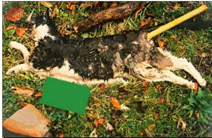
Slika 2. Seksualno zlostavljanje životinje

Vrste ozljeda zadobivene seksualnim zlostavljanjem su povrede rodnice i rektuma uzrokovane penetracijom penisa ili umetanjem različitih predmeta, prodorne rane oko rodnice i anusa, trauma ženskih genitalija (vulve, rodnice, maternice), te trauma muških genitalija (Munro, 2008.). Ovisno o veličini životinje i vrsti spolnog kontakta, ozljede nanese seksualnim zlostavljanjem mogu uzrokovati i smrt životinje (Merck, 2013.).