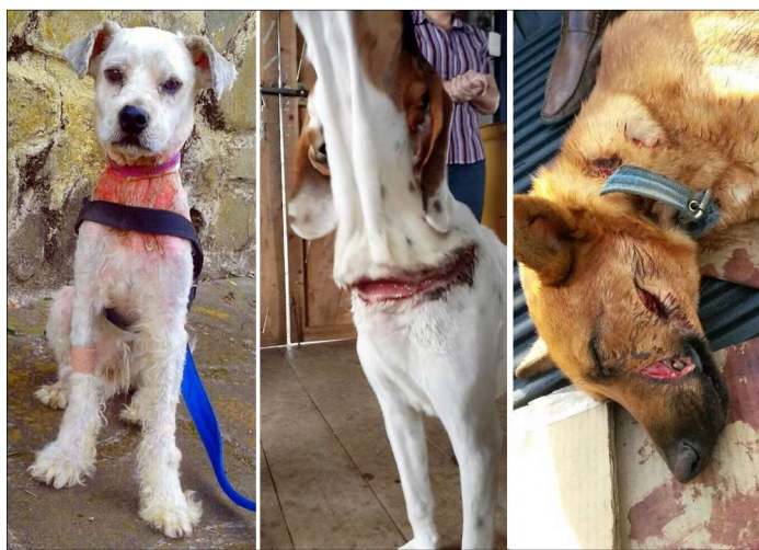
Slika 1. Ozljede prilikom fizičkog zlostavljanja pasa

Počinitelj fizičkog zlostavljanja podvrgava životinju raznim radnjama koje uzrokuju tjelesne ozljede. To uključuje udaranje nogama, udaranje rukama, bacanje životinje (uz zid, niz stepenice, kroz prozore), udaranje raznim predmetima, spaljivanje, utapanje i gušenje. Kao načini zlostavljanja ponekad se koriste kućanski aparati kao što su mikrovalna pećnica, perilica i sušilica rublja u koje mučitelji stave životinju. Primjena lijekova (npr. opojnih droga) i otrova (npr. mamac za puževe, metaldehid) također spadaju u vrstu fizičkog zlostavljanja. Ozljede se očituju uglavnom kao višestruki prijelomi kostiju u različitim fazama zacjeljivanja, dok neke ozljede bude sumnju jer su neuobičajene i 'ne uklapaju' se u priču vlasnika (Munro, 2008.).