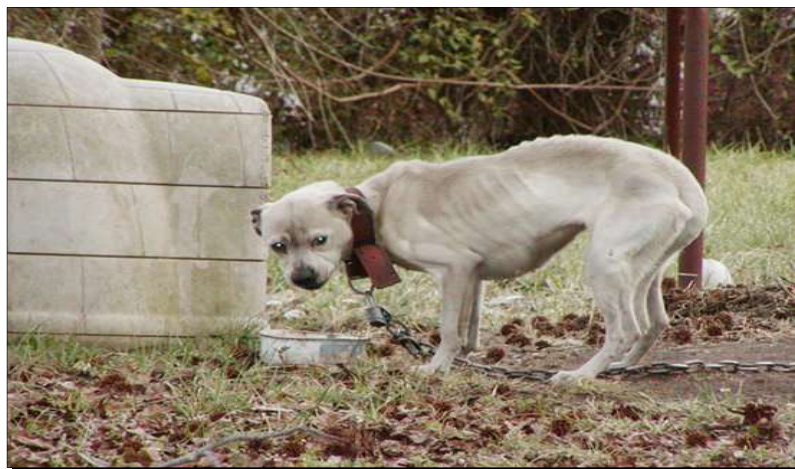
Slika 6. psa na

https://www.peta.org/issues/animal-companion-issues/cruel-practices/chaining-dogs/neglected-chained-dogs/ )