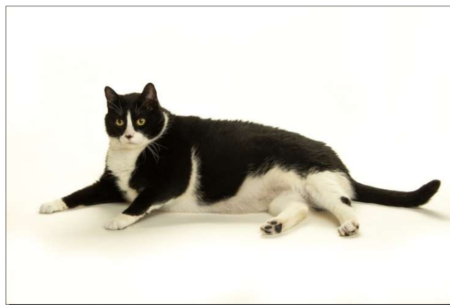
Slika 4. Pretila mačka

Zdravlje i dug život kućnih ljubimaca ugroženi su pretilošću. Životinje koje pate od pretilosti predisponirane su na inzulinsku rezistenciju, šećernu bolest, bolesti srca, visoki krvni tlak, kongestivno zatajenje srce, degenerativne promjene na lokomotornom sustavu, pojačanje simptoma osteoartritisa, bolesti usne šupljine, dermatološke probleme, respiratorni distress, distociju te smanjenu imunost (Toll i sur., 2010.).