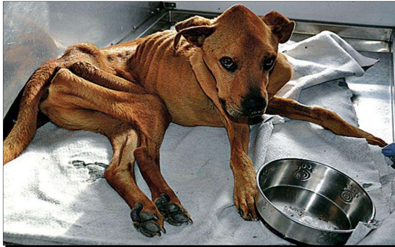
Slika 3. Izgladnjeli pas