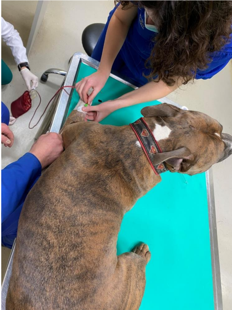
Slika 12 Vađenje krvi iz cefalične vene psu za transfuziju, IZVOR: vlastita slika