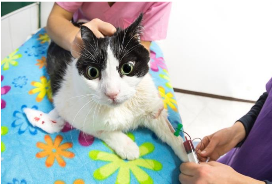
Slika 13 Vađenje krvi iz cefalične vene mački za transfuziju