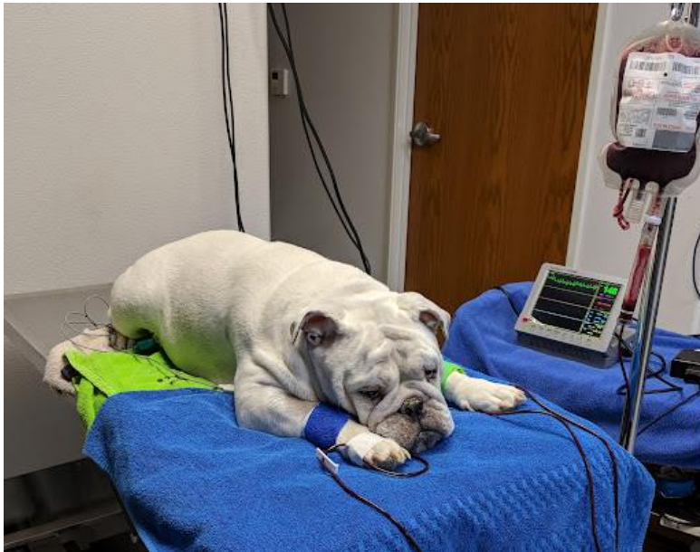
Slika 15 Provođenje transfuzije kod psa