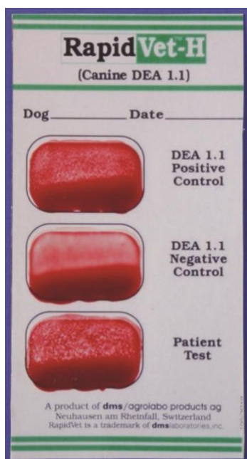
Slika 9 Brzi test za tipiziranje DEA 1.1 krvne grupe pasa

Ovaj oblik testa još nije zaživio u praksi, ali jednako kao i gel aglutinacijski test, jednostavan je, brz i lako ga je standardizirati. Test sadrži specifični pseći antiglobulinski reagens. Također se temelji na migraciji eritrocita. (KENICHIRO YAGI, MARIE HOLOWAYVHUK, 2016.)