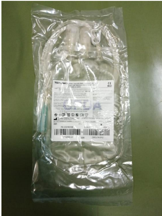
Slika 11 Vrećica zatvorenog sustava za prikupljanje krvi

Prilikom doniranja krvi bitno je donora staviti u što udobniji položaj. To uključuje poziciju na prsnom košu ili bočnu poziciju (bočna pozicija je udobnija). Sam postupak prikupljanja krvi putem venepunkcije jugularne vene traje 5 do 10 minuta. Nužno je da donor bude na višoj površini od transfuzijske vrećice ukoliko se služi djelovanjem sile teže, a ako se koristi vakuumska pumpa donor može ležati na podu. (KENICHIRO YAGI, MARIE HOLOWAYVHUK, 2016.)