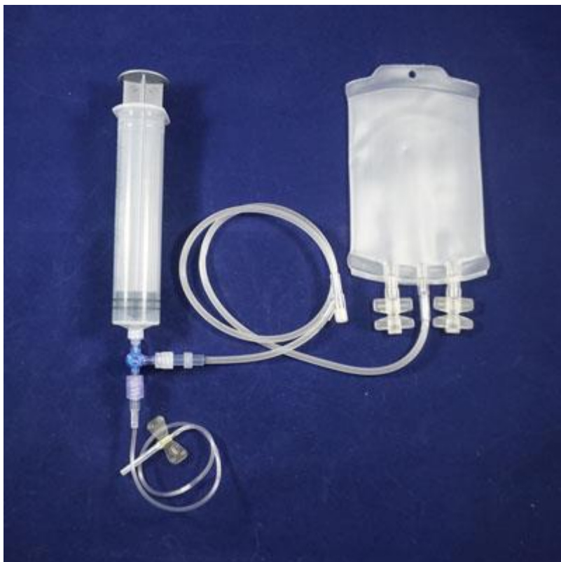
Slika 14 Vrećica za prikupljanje krvi kod mačaka IZVOR: https://jorvet.com/product/small-blood-bag-collection-set-w-syringe-and-stopcock/