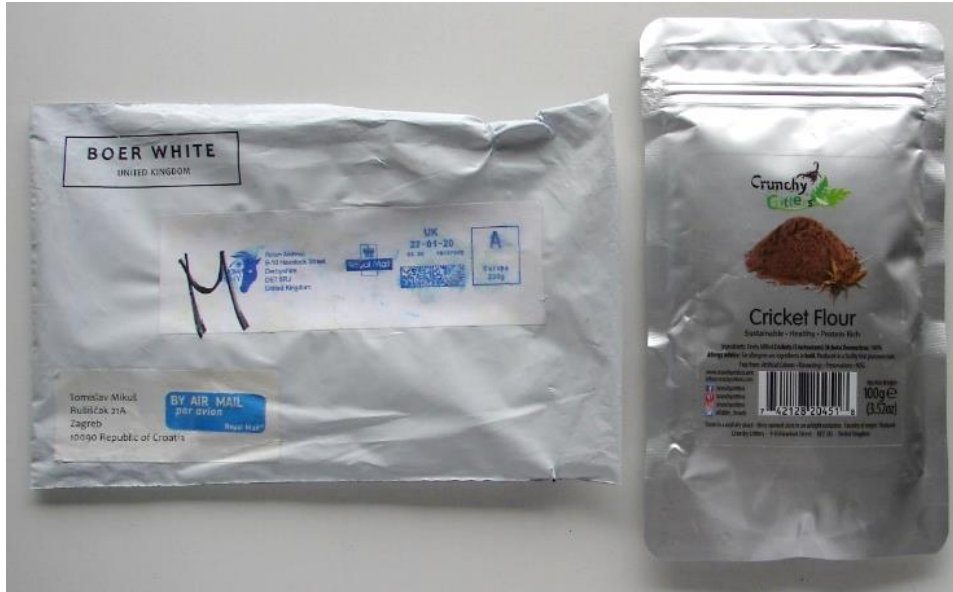
Slika 2. Uzorak 1. - zemlja podrijetla Velika Britanija

Uzorci brašna cvrčaka nabavljeni su s tri kontinenta (Sjeverna Amerika, Azija i Europa) putem e-trgovine (eBay).