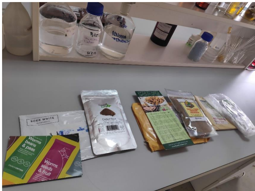
Slika 6. Otvaranje pakovina uzoraka u laboratoriju