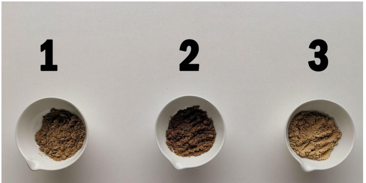
Slika 5. Uzorci brašna pripremljeni za analize

Senzoričkom pretragom obuhvaćeni su miris, boja i konzistencija proizvoda.