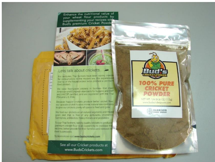
Slika 4. Uzorak 3. - zemlja podrijetla Sjedinjene Američke Države

Prema deklaraciji proizvođača, proizvod u 100 g sadržava: