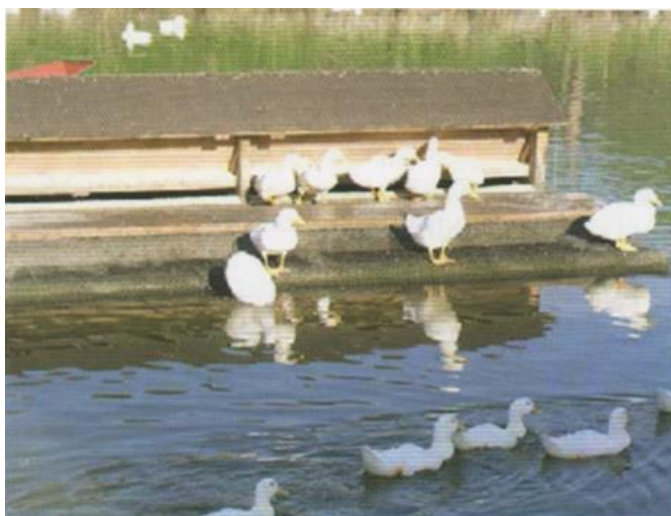
Slika 11. Hranilica za patke na ribnjaku.

sprječavanja gubitka energije peradi, a ograde su smještene dovoljno duboko da perad ne može proći ispod njih i da ribe mogu nesmetano plivati. Zbog mogućnosti erodiranja obale (perad ruje zemlju u potrazi za crvima) najbolje je imati rampu za ulazak u vodu, a ostatak obale zaštititi mrežom koju također treba postaviti i iznad ribnjaka da spriječi ostale ptice u konzumiraju hrane iz hranilica (slika 13) (SENČIĆ i ANTUNOVIĆ, 2003.).