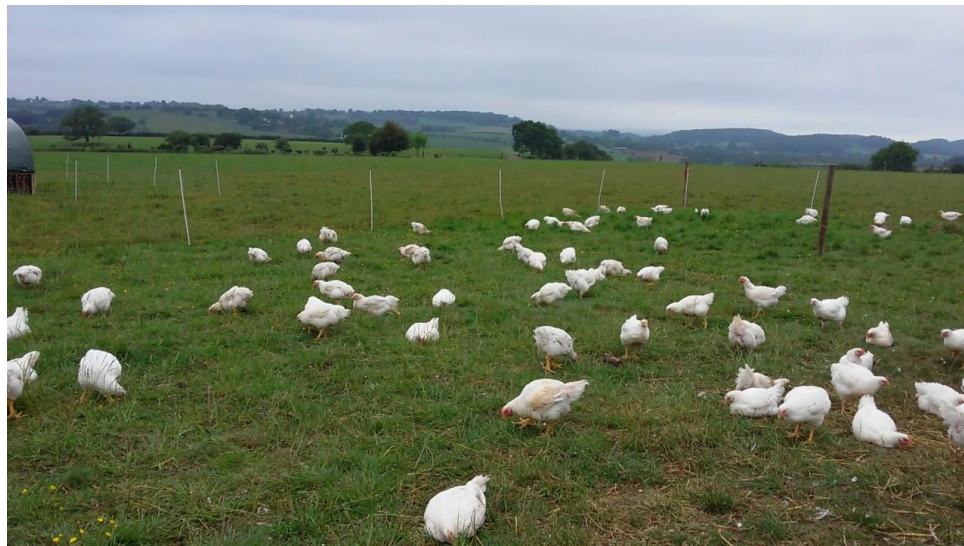
Slika 6. Pilići u tovu u ispustu.

trava i leguminoza (trećina lucerna, trećina crvena djetelina te ostatak mješavina bijele djeteline, klupčaste oštrice, talijanskog ljulja i mačjeg repka) (SENČIĆ i sur., 2011.).