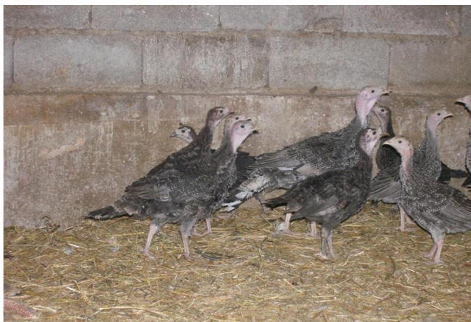
Slika 8. Purići na dubokoj stelji u kontroliranim uvjetima.

povoljnih vremenskih uvjeta, puštati u posebno pripremljene, izdignute ispuste, čime se sprječava doticaj s patogenima iz tla (OSTOVIĆ, 2020.).