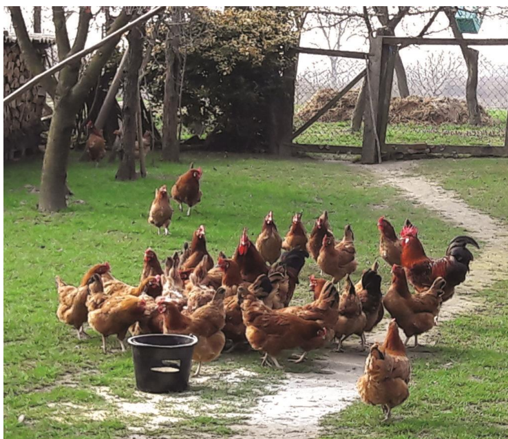
Slika 1. Kokoš hrvatica.

Za ekološku proizvodnju jaja koriste se komercijalni hibridi od kojih se ističu Hisex Ranger, Lohmann Tradition i Bovans Goldline, kao i nesilice lakih te kombiniranih pasmina kao što su New Hampshire, Plymouth Rock, Australorp, Rhode Island i naša kokoš hrvatica (slika 1). Njih karakterizira dobro iskorištavanje paše (zelena masa, kukci, gujavice i dr.), rado traže hranu u prirodi i otporne su (UREMOVIĆ i sur., 2008.; SENČIĆ i sur., 2011.). Jaja iz ekološke proizvodnje označavaju se oznakom 0 (Narodne novine 115/06, 69/07, 76/08).