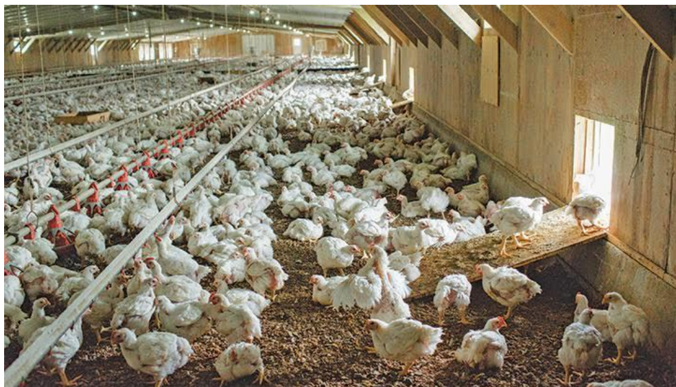
Slika 5. Nastamba za tov pilića u ekološkoj proizvodnji.

Za ekološku proizvodnju tovnih pilića odabiru se sporo rastući hibridi koji se više kreću, bolje iskorištavaju ispašu i otporniji su na vanjske uvjete držanja (OSTOVIĆ, 2020.). Među njih ubrajamo linijske hibride Sasso T88 (grahorasti) i T44 (crveni) (SENČIĆ i sur., 2011.). Peradnjak je ograničen na maksimalno 4.800 pilića. Po kvadratnom metru površine peradnjaka drži se 10 pilića, odnosno najviše 21 kg žive vage, dok se po piletu mora osigurati 4 m 2 vanjske površine. Ako se radi o mobilnim kokošinjcima, maksimalno je dozvoljeno 16 pilića/m 2 unutarne površine, odnosno 30 kg žive vage, s time da površina peradnjaka ne prelazi 150 m 2 , te 2,5 m 2 vanjske površine po piletu. Mora se paziti da se ne prijeđe ograničenje proizvodnje od 170 kg dušika po hektaru poljoprivredne površine godišnje, što je proporcionalno broju od 580 pilića u tovu po hektaru površine godišnje (Uredba Komisije (EZ) br. 889/2008).