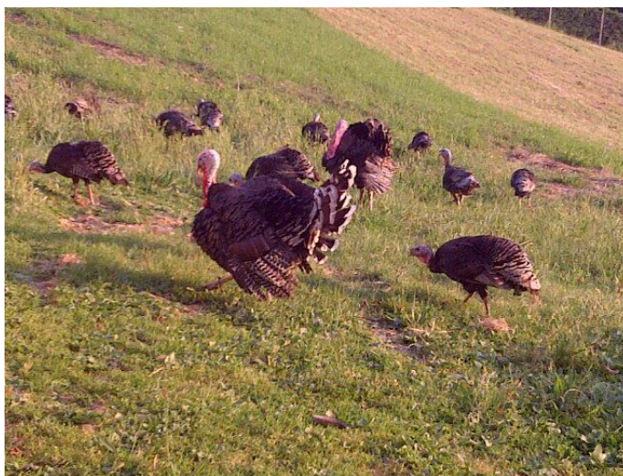
Slika 9. Zagorski purani na pašnjaku.