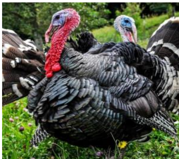
Slika 7. Zagorski puran.

Tov purana u ekološkoj proizvodnji iziskuje pravilan odabir pasmine jer su suvremeni hibridi koji se odlikuju intenzivnim rastom i naglašenom mesnatošću prezahtjevni u pogledu hranidbe i uvjeta držanja koji moraju biti kontrolirani tijekom cijelog trajanja tova. Za držanje na otvorenom pogodnije su manje proizvodne pasmine kao što je npr. naša autohtona pasmina zagorski puran (OSTOVIĆ, 2020.), slika 7. Nju odlikuje izražena otpornost, dobro iskorištavanje pašnjaka i drugih ispusta, relativno mala tjelesna masa (6 – 7 kg odrasli puran; 3 – 4 kg pura) i jako ukusno meso. U našoj zemlji uzgajaju se četiri soja zagorskog purana: sivi, crni, brončani i svijetli ( https://bag.mps.hr/hrvatske-izvorne-i-zasticene-pasmine/zagorski-puran/ ).