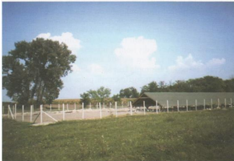
Slika 10. Nadstrešnice za guske na ispustu.

Obvezno je izgraditi nadstrešnice radi zaštite od nepovoljnih vremenskih uvjeta (jako sunce, vjetar, jake kiše) na ograđenim ispustima ili pašnjacima (slika 10) te na obali ribnjaka ili na splavu na vodenoj površini, gdje su tako zaštićene smještene i hranilice (slike 11 i 12).