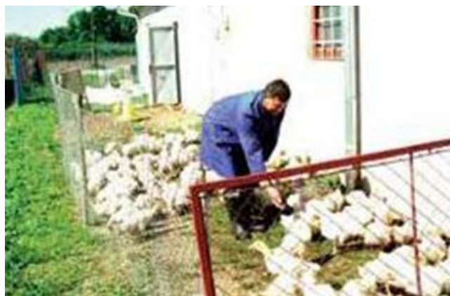
Slika 14. Držanje guščića u ispustu.

Prva tri tjedna uzgoja guščići i pačići drže se u kontroliranim uvjetima u peradnjacima gdje se pazi na optimalne uvjete držanja: odgovarajuću temperaturu (za guščiće 32 °C; za pačiće 35 °C u prvom tjednu tova, a zatim se svakog idućeg dana temperatura smanjuje dok se ne postigne temperatura od oko 20 °C), dobru osvjetljenost (za guščiće 3 W/m 2 ; za pačiće 5 W/m 2 24 sata dnevno) i dobru prozračnost (2,0 – 2,5 m 3 /h/kg tjelesne mase, bez propuha), uz primjeren prostor za hranjenje i napajanje. Drže se na dubokoj stelji od sitno sjeckane slame, drvenih strugotina i sl. Guščići se u četvrtom i petom tjednu mogu pustiti u ograđene ispuste (slika 14), a u šestom tjednu i nadalje na ribnjak, dok se pačići mogu pustiti na vodene površine već nakon tri tjedna uzgoja (SENČIĆ i sur., 2011.).