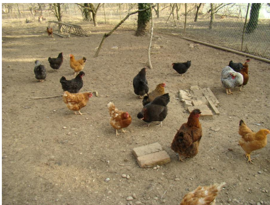
Slika 4. Kokoši nesilice u ekološkoj proizvodnji u voćnjaku.

Za pogodnog vremena kokoši nesilice borave u ispustima (na pašnjacima) gdje dobar dio hrane pronalaze same (zelena masa, kukci, gujavice i sl.), a ako ih se pušta planski u voćnjake (slika 4) te na druga zemljišta mogu ravnomjerno rasporediti gnoj po površinama te jesti jajašca, ličinke i odrasle muhe, parazite te druge kukce, smanjujući pri tom broj nametnika (OSTOVIĆ, 2020.). To snižava i troškove hranidbe jer im se samo nadopunjuje obrok koncentratnim krmivima. Uputno je ispuste i unutrašnjost kokošinjca podijeliti na nekoliko dijelova te kokoši premještati iz jednog u drugi dio, čime se omogućuje obnova vegetacije u ispustu u kojem su boravile (MIRECKI, 2014.).