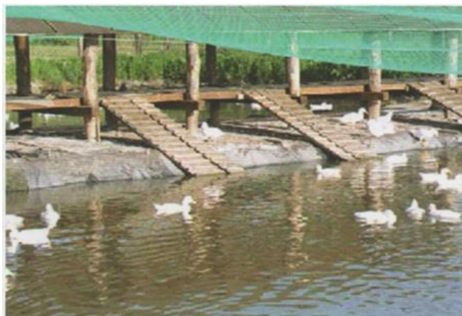
Slika 13. Mreža iznad ribnjaka u ekološkom tovu pataka.