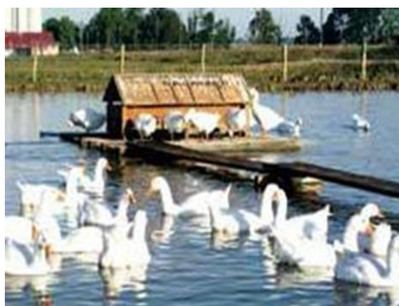
Slika 12. Hranilica za guske na ribnjaku.