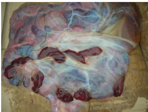
Slika 2. Posteljica koze

Puerperij je razdoblje od završetka porođaja (istiskivanja plodnih mjehura, ploda i posteljice) do kraja involucije maternice i uspostave ciklične aktivnosti jajnika. Promjene na spolnim organima za vrijeme puerperija sastoje se od involucije maternice i povratka cikličke aktivnosti jajnika (SAMARDŽIJA i sur., 2010.). Pod kontrolom hormona odvija se priprema za porođaj spolnih organa (prokvašenje, otvaranje i proširenje porođajnog kanala, početak kontrakcija miometrija), ali i priprema za sintezu i ekskreciju mlijeka, odnosno početak laktacije (SAMARDŽIJA i sur., 2010.). Porođaj je fiziološki završetak gravidnosti kada razvijeni, zreli plod kroz porođajni kanal napušta organizam majke kako bi u vanjskom svijetu nastavio ekstrauterini razvoj. Da bi se organizam majke pripremio za porođaj odigrava se cijeli niz promjena odnosa razina hormona. Nakon završetka drugog stadija i istiskivanja plod(ov)a, kontrakcije abdomena prestaju ili su vrlo slabe, a smanjuje se pravilnost i učestalost kontrakcija miometrija. Rodilje i dalje tiskaju samo ukoliko u porođajnom kanalu ima patoloških promjena (ozljede, upale, izvala maternice i dr.). Kontrakcije miometrija poslije samog porođaja ( dolores post partum ) su vrlo značajne za odvajanje posteljice (Slika 2.) i njezino istiskivanje.