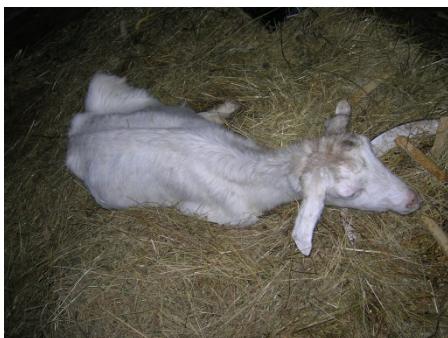
Slika 4. Puerperalna pareza u sanske koze