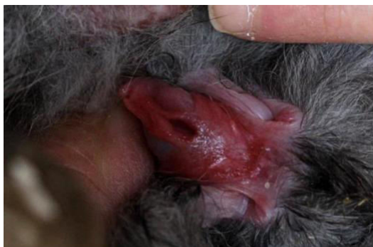
Slika 7. Split penis u mužjaka kunića

prilikom ejakulacije izgubi duž razdvojenog penisa te ne dospije sva u genitalije ženke prilikom koitusa. Što je anomalija udaljenija od vrha penisa, to je kunić manje plodan.