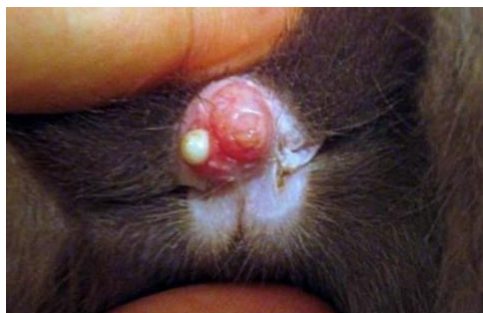
Slika 6. Bakterijska infekcija penisa u mužjaka kunića