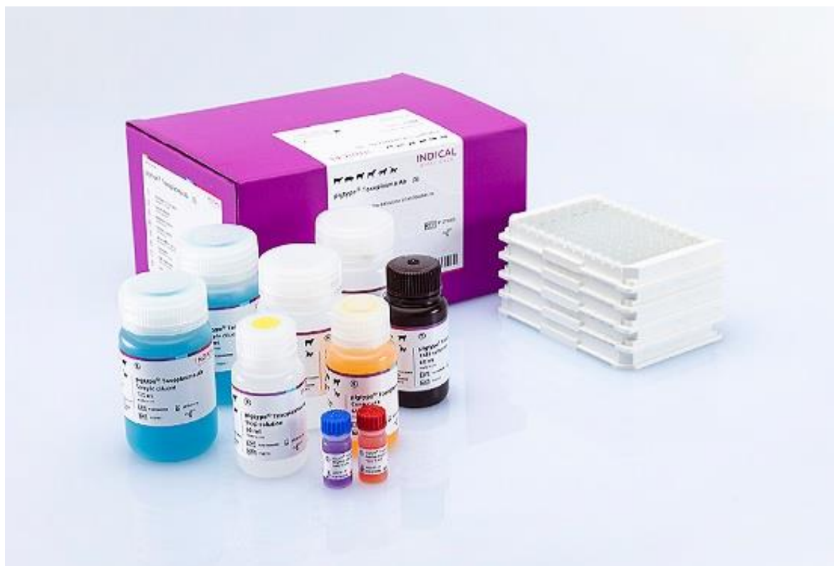
Slika 4. Komercijalni ELISA kit pigtype® Toxoplasma Ab ( https://shop.indical.com/en/assays-and-reagents/pigtype-toxoplasma-ab-5-elisa-plates.html )

Nakon inkubacije (30 minuta na sobnoj temperaturi) i drugog ispiranja, 100 µl TMB supstrata je dodano u svaku jažicu te je potom uslijedila inkubacija na sobnoj temperaturi bez izlaganja svjetlosti. Reakcija je zaustavljena nakon 10 minuta dodavanjem 100 µl STOP otopine. Nakon cjelokupne procedure, očitana je absorbancija pomoću čitača mikropločica (BioTek ELx800) i analizirana pomoću Gen5™ softvera (BioTek Instruments, Inc.). Izračunat je S/P omjer za svaki uzorak te su oni uzorci sa S/P omjerom \geq 0.3 smatrani pozitivnim.