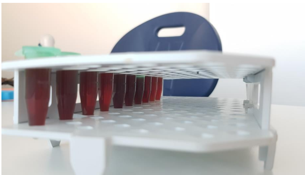
Slika 3. Priprema mesnog soka za analizu pomoću ELISA metode

Nakon primitka svježih uzoraka ošita s linije klanja, uzorci su se zamrzavali u Zavodu za higijenu, tehnologiju i sigurnost hrane. Potom su se prebacivali, sterilnim priborom, u vrećice za homogenizaciju i odmrzavali pri 4°C tijekom 24 h \pm 4 h. Nakon prikupljanja 1 ml mesnog soka iz svakog uzorka, mesni sok se prebacivao u plastične kivete od 1,5 ml te ponovno zamrzavao na -20 °C do početka analize.