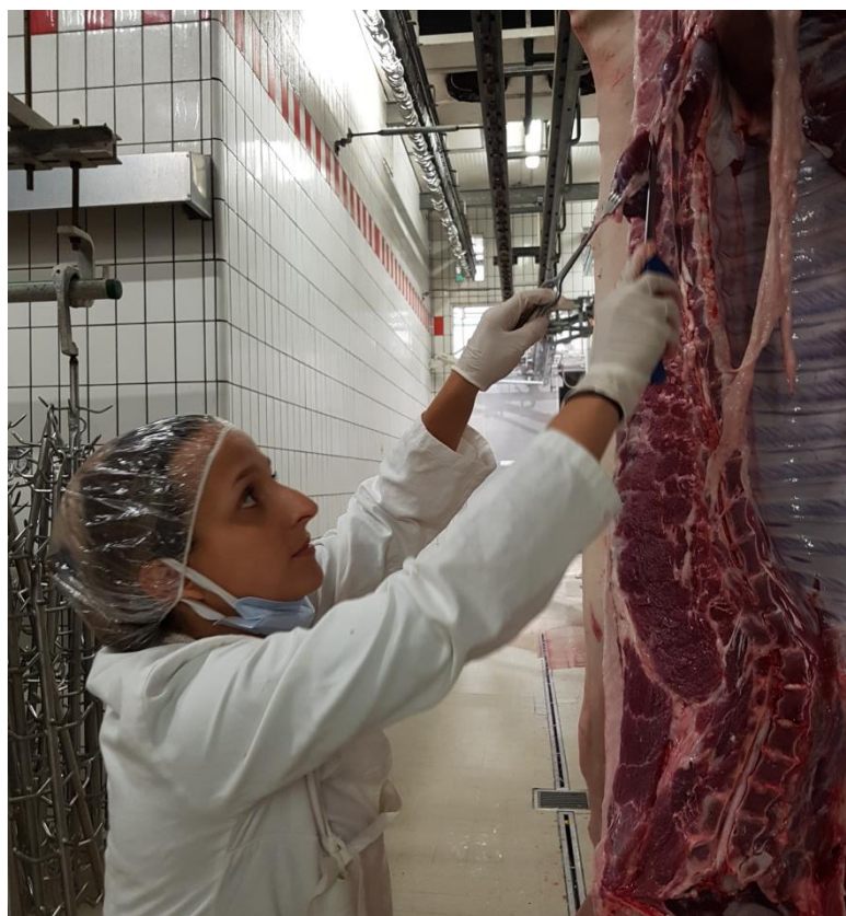
Slika 2. Uzorkovanje ošita u klaonici

Uzorkovanje ošita svinja obavljeno je probabilističkom metodom jednostavnog nasumičnog odabira u regionalnim klaonicama (klaonica I i II) i seoskim domaćinstvima u razdoblju od rujna 2021. do ožujka 2022. Ukupno je pretražen 91 uzorak mesnog soka domaćih svinja od kojih je 54 potjecalo s 18 velikih svinjogojskih farmi te 37 s 18 seoskih domaćinstava. Uzorci su pohranjivani u sterilne vrećice te transportirani u prijenosnom hladnjaku u Zavod za higijenu, tehnologiju i sigurnost hrane Veterinarskog fakulteta Sveučilišta u Zagrebu.