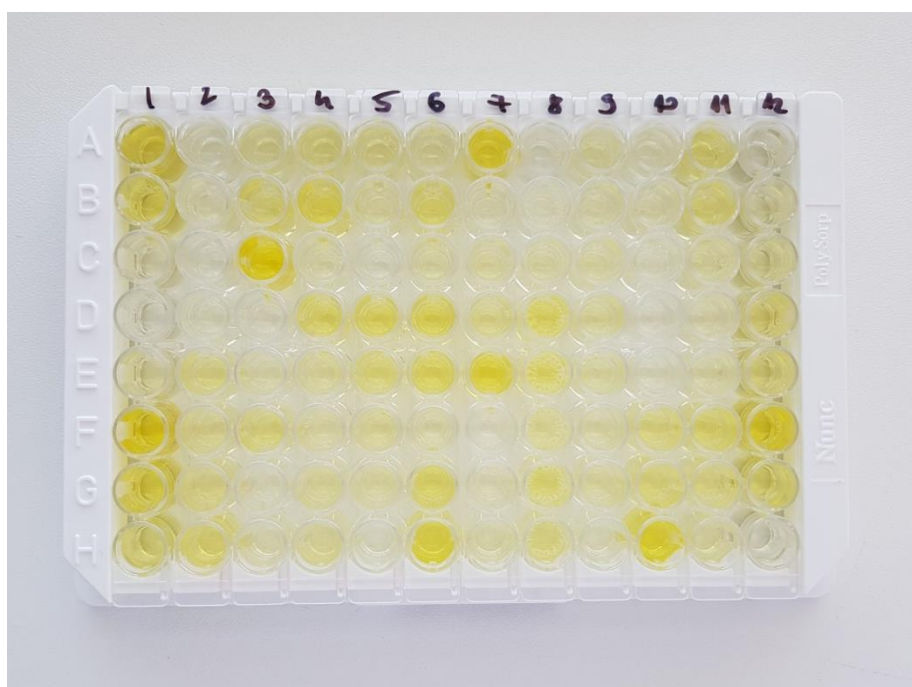
Slika 5. Mikrotitracijska pločica nakon očitavanja rezultata ELISA testiranja

Ukupno je pretražen 91 uzorak mesnog soka domaćih svinja od kojih 54 uzorka potječu s 18 velikih svinjogojskih farmi na kojima je prosječno tovljeno 3793 svinje godišnje, te 37 uzoraka koji potječu s 18 seoskih domaćinstava koja prosječno drže 8 svinja na gospodarstvu. Svinja se smatra seropozitivnom ukoliko je S/P omjer uzorka bio veći ili jednak 0.3, dok se farma smatra pozitivnom ukoliko je barem jedan uzorak na farmi bio seropozitivan. Rezultati serološke pretrage prikazani su u tablici 1 i tablici 2 sukladno tipu farme podrijetla i kategoriji biosigurnosti.