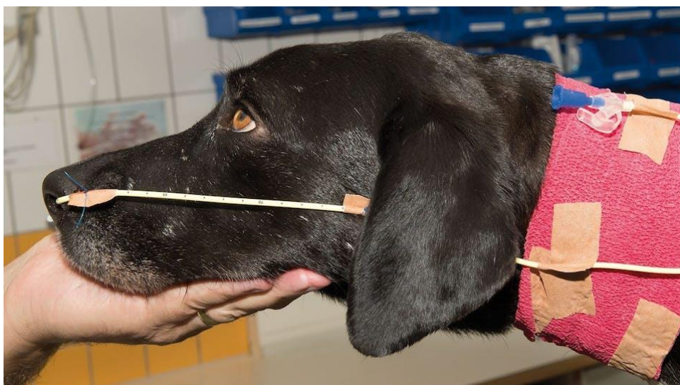
Slika 3. Fiksiranje nazoezofagealne sonde lateralno na području obraza kod psa.