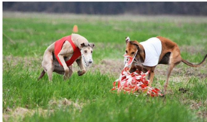
Slika 13 Lov hrtova na umjetni mamac

U ovoj disciplini nema žrtava ni lovine jer se lovi umjetni mamac (Slika 13) koji je građen od skupa plastičnih traka pričvršćenih za užu koje skreće preko kolotura postavljenih na travnatoj površini. Staza treba biti dinamično postavljena da kretnja mamca, koja simulira trk divljači, oponaša pravi lov. Duljina staze je 600 m. Psi na taj način zadovolje svoj lovni nagon, istrčavanjem se riješe velike količine energije, ali i jačaju agilnost, inteligenciju i snalažljivost. Na natjecanju psi trče dvije različite utrke (vožnje) u paru gdje uče međusobno surađivati. Svaka vožnja ima drugačiju putanju mamca što zahtijeva inteligenciju i timsku suradnju pasa. Sudac boduje svaku vožnju, te se na kraju određuje konačan poredak pasa. Ukoliko pas tijekom lova izgubi mamac iz vidnog polja, promatra se na koji način se ponovno vraća u lov te sudac boduje njegovu težnju za nastavkom utrke. Ujedno se tijekom utrke stavlja naglasak na međusobnu komunikaciju pasa. Psi ne smiju ometati jedan drugoga niti pokazivati agresivnost. Na natjecanju se ne mjeri vrijeme već se prate karakteristike poput agilnosti, izdržljivosti, praćenje mamca, želja za lovom i brzina jednog psa prema drugom (GREGL, 2018.).