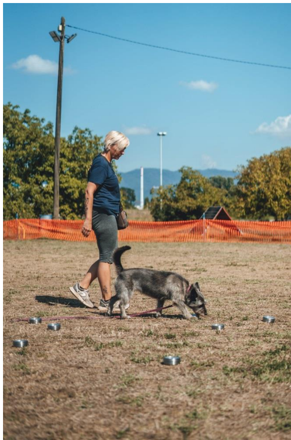
Slika 6 Pretraga posudica s mirisom

Na prvom stupnju radi se najčešće u zatvorenom prostoru, sa što manje ometanja. Na drugom stupnju psi izlaze van zatvorenog prostora, pretražuju razna spremišta i vozila, uz razna ometanja, najčešće hranu. Pas mora moći ući u veći te u manji i skućeniji prostor i pronaći miris te naravno prijaviti da ga je pronašao. U pretrazi prostora najčešće se očekuje slobodno traženje mirisa, dok se u pretrazi vozila očekuje sistematično traženje mirisa, što znači da pas zaista pretraži cijelo vozilo, da vlasnik bude siguran da na tom mjestu nema ili ima mirisa ako je pas prijavio. Mirisi se najčešće nalaze u nekim nosačima, kao što su epruvete, također mogu se stavljati na magnete, metalne površine, u zemlju ili grmlje.