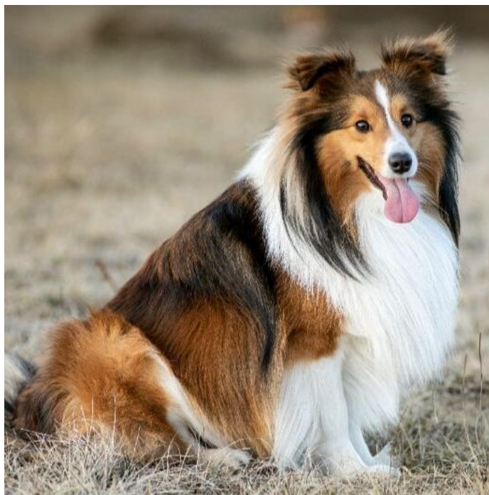
Slika 4 Šetlandski ovčar