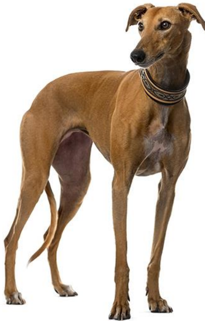
Slika 14 Veliki engleski hrt (eng. Greyhound )

Kretanje je niskog koraka. Veliku brzinu hrtu omogućava slobodan iskorak. Dlaka je polegnuta i tanka, a može biti raznih boja, od bijele, crvene, plave, crne, jelenje žute i tigraste. Svaka od boja može biti i prošarana s bijelim mrljama (HKS, 2022.d; FCI, 2011.).