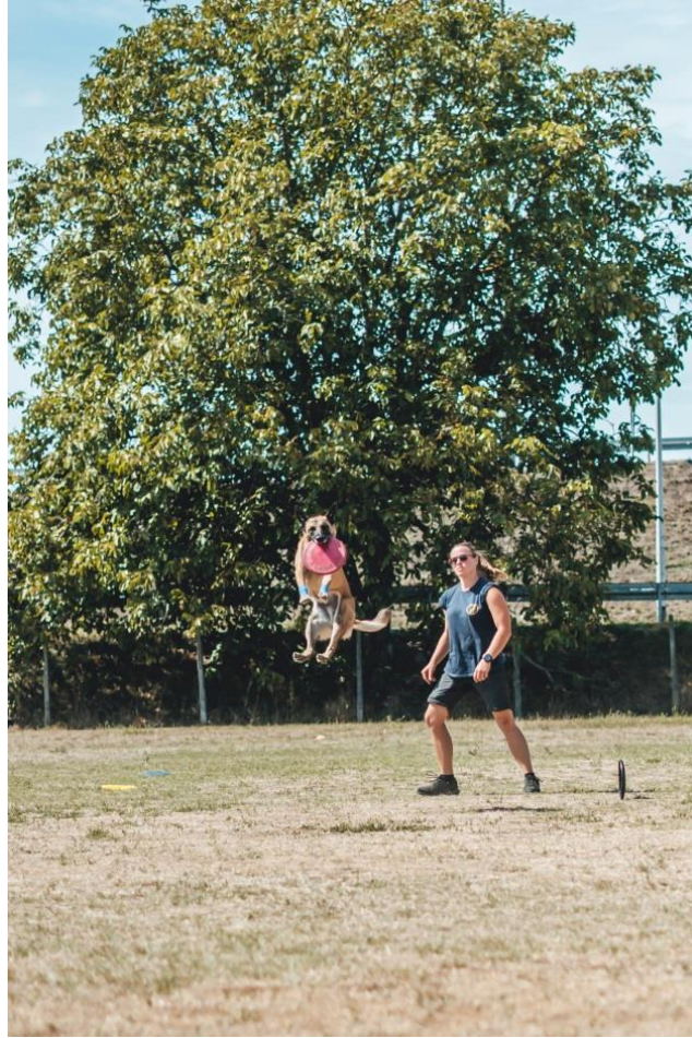
Slika 9 Trening discipline frizbi