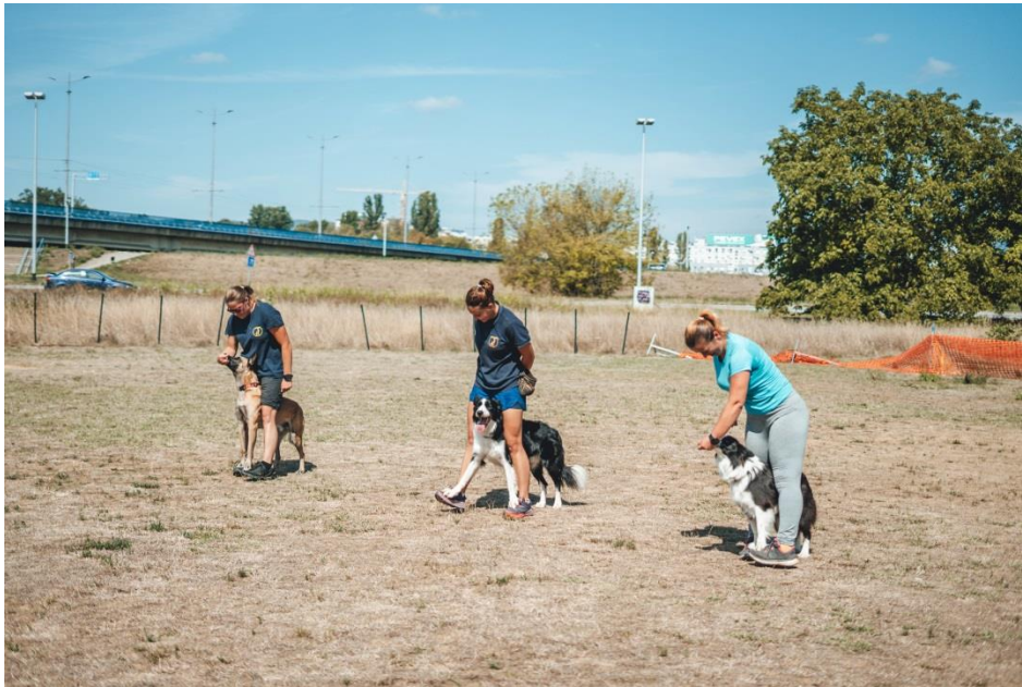
Slika 12 Vježba „hodanje na stopalima vodiča“

U ovoj disciplini, naglasak je na izgrađivanju boljeg odnosa sa psom, poboljšavanju fokusa psa na vodiča, razvitku međusobnog povjerenja te na mentalnoj stimulaciji psa. Trikovi služe kao dobra priprema psa za daljnje discipline kao što je rally obedience , dog dancing i freestyle frisbee što je kombinacija frizbija i trikova. Na početku, psi se upoznaju s osnovama rada s klikerom, a nakon toga se kreće u izradu baza za trikove. Kliker dresura potiče pozitivno ponašanje. Kliker je plastična kutija koja ima ugrađen komad metala, koji kada se pritisne proizvodi zvuk „klik“. Prvo treba pronaći motivaciju za psa, kao što je igračka ili hrana. Kada pas učini određenu radnju koju vlasnik traži, slijedi zvuk klikera. Nagrada uvijek mora slijediti zvuk klikera. Postepeno, pas će nastavljati raditi tu radnju te mu vlasnik više neće morati dati nagradu. Na tečaju trikova se uči 20 – ak trikova. Neki od trikova koji se uče u ovoj disciplini su „daj šapu“, „slalom kroz noge“, „puzi“, „hodanje na stopalima vodiča“ (Slika 12), „hodanje unatrag“, „okret“, „roll“ te „slalom kroz noge na mjestu“. Postoje dva stupnja trikova. Na prvom stupnju uče se osnovni trikovi, dok se na drugom stupnju radi nadogradnja sa težim i zahtjevnijim trikovima (KOSSP, 2022.).