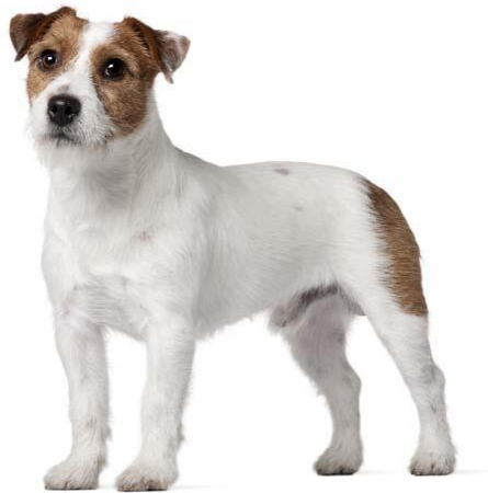
Slika 5 Jack Russellov terijer

Dlaka može biti u više varijanti, oštra, glatka ili glatka miješana s oštrom (Slika 5). Treba dominirati bijela boja dlake s oznakama crne boje i/ili boje paleža koja može varirati od sasvim svijetle do kestenjaste boje (HKS, 2022.c; FCI, 2012.a).