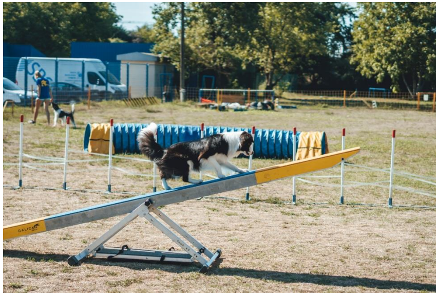
Slika 1 Prelazak psa preko zonske prepreke (klackalica)

Agility je timski sport psa i njegovog vlasnika u kojem pas savladava razne prepreke. Postoji nekoliko vrsta prepreka, a to su: prepreke koje se preskaču, gdje spadaju visinske prepreke (popularno zvane „hopovi“), zid, guma i dalj, zonske prepreke gdje se svrstavaju most, A prepreka i klackalica (Slika 1) te tunel i slalom. Zonske prepreke su često psima i najteže prepreke iz razloga jer pas mora barem jednom šapom ili njenim dijelom dotaknuti žuti dio koji se nalazi na prepri.