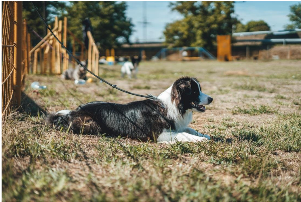
Slika 3 Graničarski koli

polegnuta i kratka na području ušiju i lica, stražnjim nogama od skočnog zgloba do tla i prednjim nogama (osim resa). Dopusnene su razne boje kao što su crno – bijela, blue merle , red merle , crni i crveni trobojni, jetreno smeđa s bijelim, ali bijela boja ne smije prevladavati (HKS, 2022.a; FCI, 2009.).