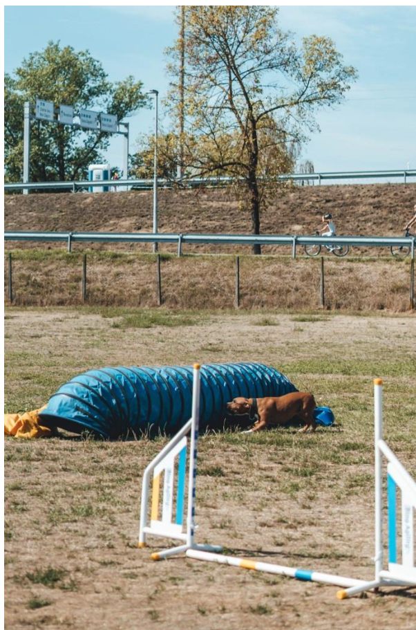
Slika 8 Pronalazak osobe pas označava lajanjem

Tečaj za spasilačke pse predstavlja samo početak školovanja pasa i nastavlja se na tečajeve poslušnosti i radni potencijal psa, koji obuhvaća kvalitetnu socijalizaciju, mirnoću psa, izuzetno dobar odnos s vodičem, određene fizičke karakteristike pasa te iznimna motiviranost za rad. Psi rade vježbe u prirodi, a svrha rada je licenciranje pasa. Kada pas krene u trening za spasilačkog psa, pristupanje licenci je obavezno u roku od dvije godine. Vodiči koji posjeduju licence, članovi su specijalnih jedinica civilne zaštite Ureda za upravljanje u hitnim situacijama i Državne uprave za zaštitu i spašavanje. Kako bi pas mogao pristupiti tečaju, treba položiti ispit odgoja i socijalizacije te proći testiranje koje provodi minimalno jedan licencirani voditelj spasilačkog tečaja. U testiranju se provjerava motivacija u radu uz pomoć igračke ili hrane, kontakt psa sa stranom osobom gdje se međuostalom provjerava da pas nije agresivan i plah, interakcija psa s drugim psima suprotnog i istog spola te vraćanje do vodiča na poziv. Pas koji ne