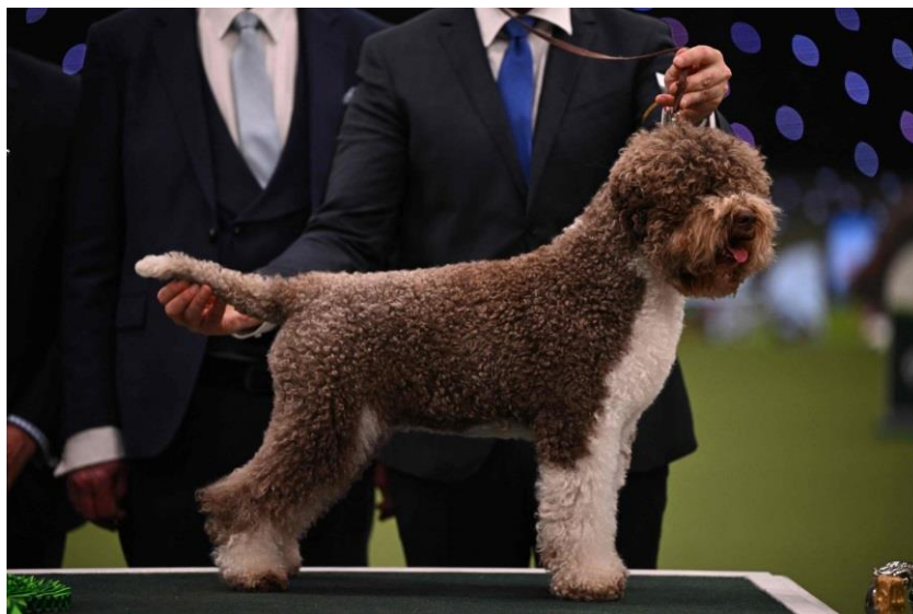
Slika 7 Lagotto romagnolo

Lagotto može biti raznih boja, jednobojan bijeli, zatim bijeli s oznakama narančaste ili smeđe boje, smeđe i narančasto mramorasti, jednobojni smeđi koji može biti svjetliji do tamni s ili bez bijelih mrlja te jednobojni narančasti s ili brz bijelih mrlja (HKS, 2020.; FCI, 2019.).