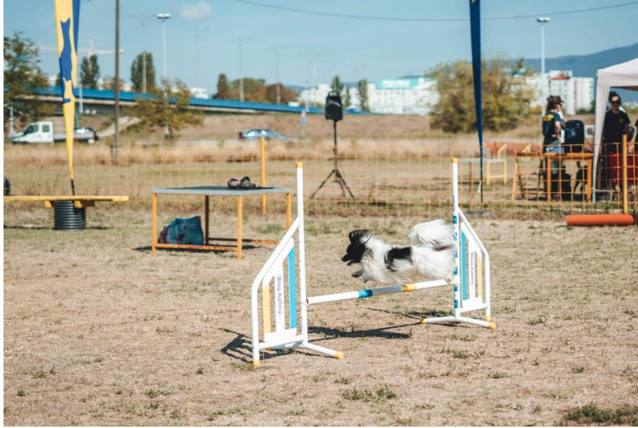
Slika 2 Prelazak papillona preko visinske prepreke (popularno zvana „hop“)

Agility natjecanja mogu biti organizirana na nacionalnoj razini odobrena od Hrvatskog kinološkog saveza ili međunarodnoj razini odobrena od Međunarodne kinološke federacije (fr. Fédération Cynologique Internationale ; FCI). Na nacionalnim natjecanjima mogu sudjelovati svi psi, stariji od 18 mjeseci neovisno o tome da li posjeduju rodovnicu. Na međunarodnim natjecanjima mogu sudjelovati psi svih pasmina, koji imaju rodovnicu priznatu od FCI-a te su stariji od 24 mjeseca. Na natjecanjima gdje su prisutne i neslužbene utrke (A0), mogu sudjelovati psi stariji od 16 mjeseci. Od natjecanja u agilitiju, postoje još i Prvenstvo Hrvatske, Europsko otvoreno prvenstvo, Juniorsko otvoreno svjetsko prvenstvo te Svjetsko prvenstvo. Svako natjecanje sadrži brojne kvalifikacije, kao što se primjerice Prvenstvo Hrvatske sastoji od najmanje 6 natjecanja (kola), koja su raspoređena tijekom godine te Finala, koje predstavlja zadnje natjecanje Prvenstva Hrvatske (HKS, 2023.a; HKS, 2023.b).