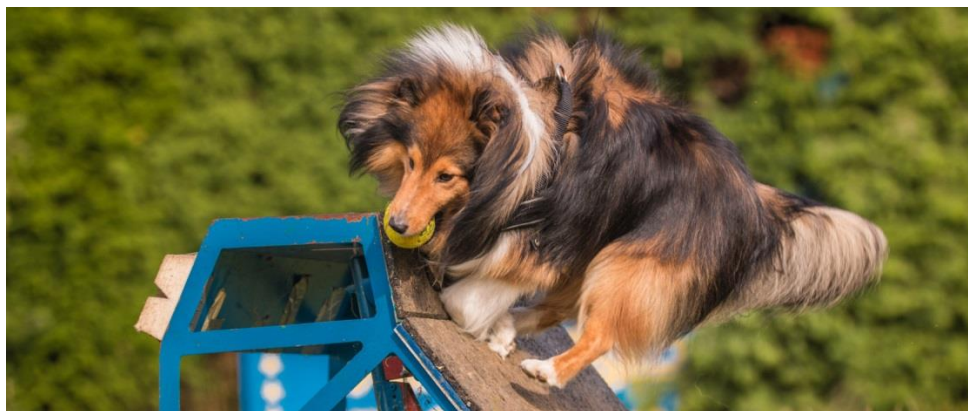
Slika 11 Hvatanje loptice u flyballu