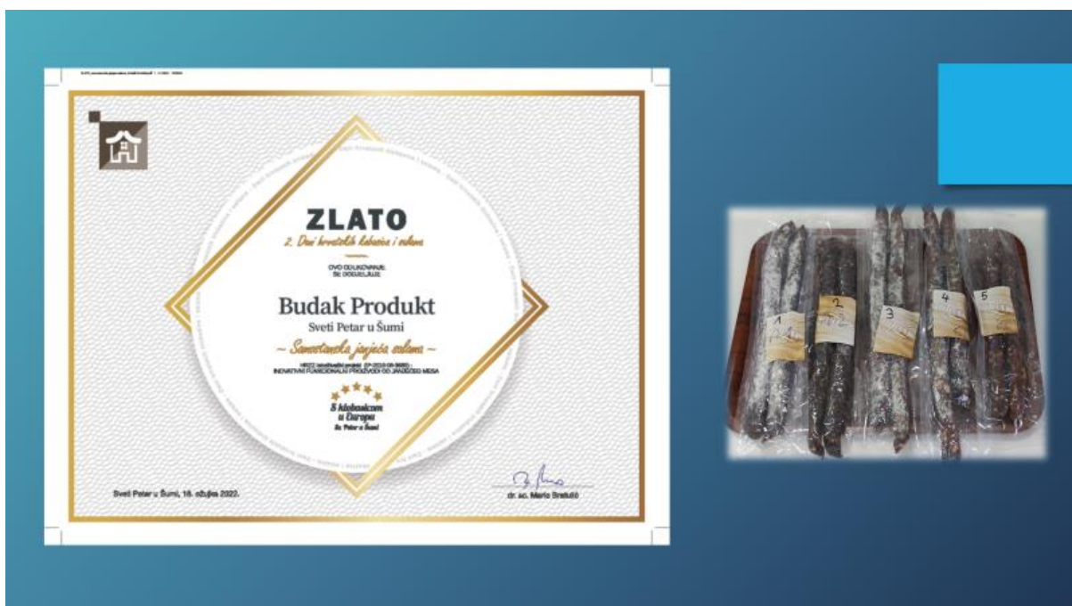
Slika 11. Zlatna medalja i plaketa za inovativnost HRZZ projekta 2022. za recepturu samostanske janjeće salame na 2. Danima hrvatskih kobasica i salama 2022..