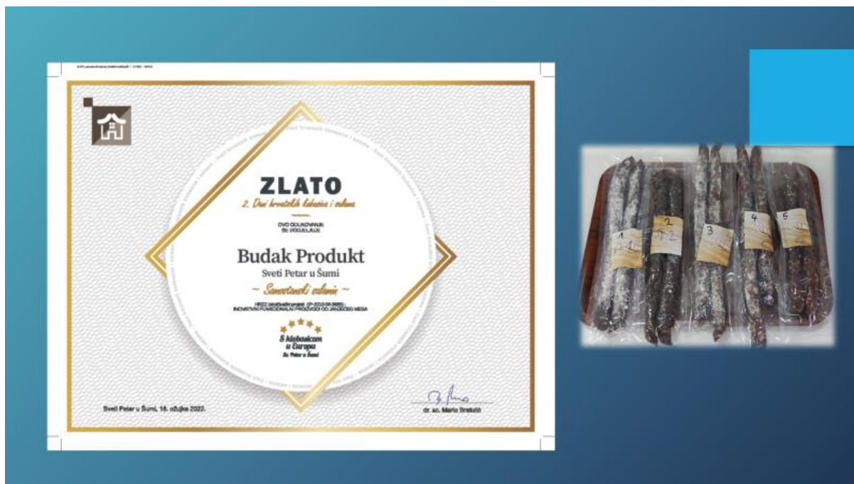
Slika 12. Zlatna medalja i plaketa za inovativnost HRZZ projekta 2022. za recepturu samostanski salamin na 2. Danima hrvatskih kobasica i salama 2022.(izvor: https://www.inoanjetina.net ).

Temeljem svega prethodno navedenog, jedinstvenost inovativnost HRZZ projekta „Inovativni funkcionalni proizvodi od janjećeg mesa” (IP-2016-06-3685) na Sveučilištu u Zagrebu tijekom 2022. godine priznata je kao inovativna jedina kreacija Veterinarskog fakulteta Sveučilišta u Zagrebu koja se temelji na inovativnim rješenjima u tehnološkim postupcima proizvodnje (BORAS, 2022.)