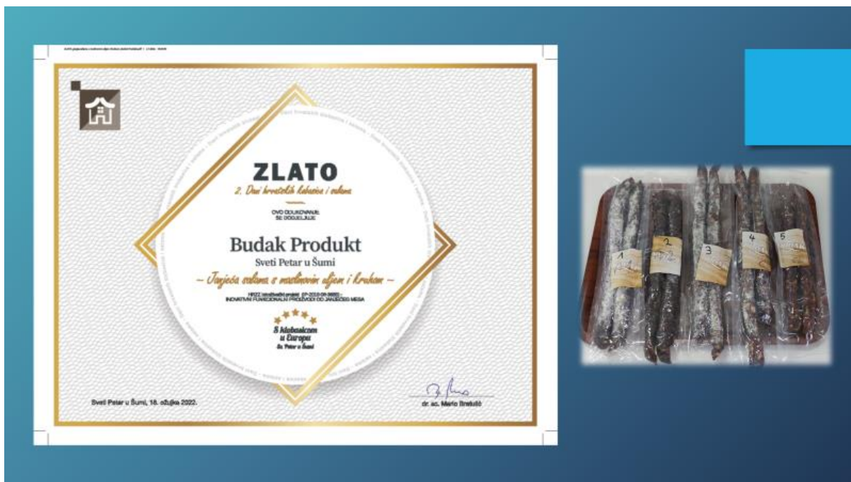
Slika 10. Zlatna medalja i plaketa za inovativnost HRZZ projekta 2022. za recepturu janjeće salame s maslinovim uljem i kruhom na 2. Danima hrvatskih kobasica i salama 2022. (izvor: https://www.inoanjetina.net ).