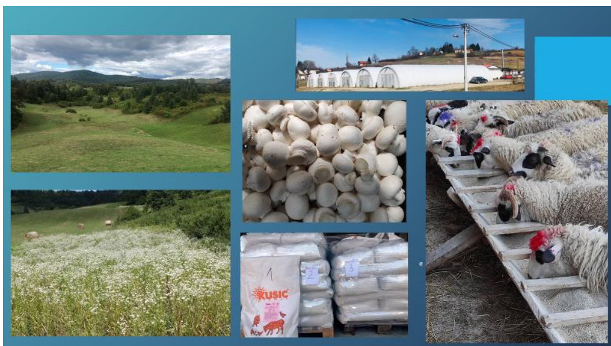
Slika 4. Inovativnost i kreativnost tehnologije uzgoja i hranidbe janjadi HRZZ projekta “Inovativni funkcionalni proizvodi od janječeg mesa“ (IP-2016-06-3685) u stupnju razvoja funkcionalnog laboratorijskog prototipa.