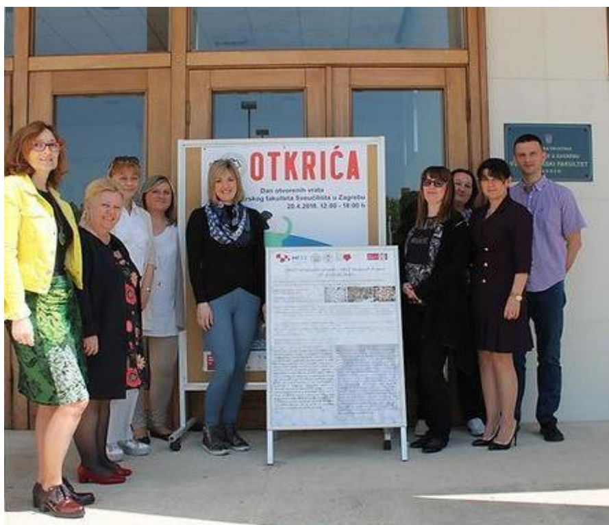
Slika 2. Projektni tim HRZZ projekta naziva “Inovativni funkcionalni proizvodi od janjećeg mesa“ (IP-2016-06-3685) s Veterinarskog fakulteta Sveučilišta u Zagrebu.