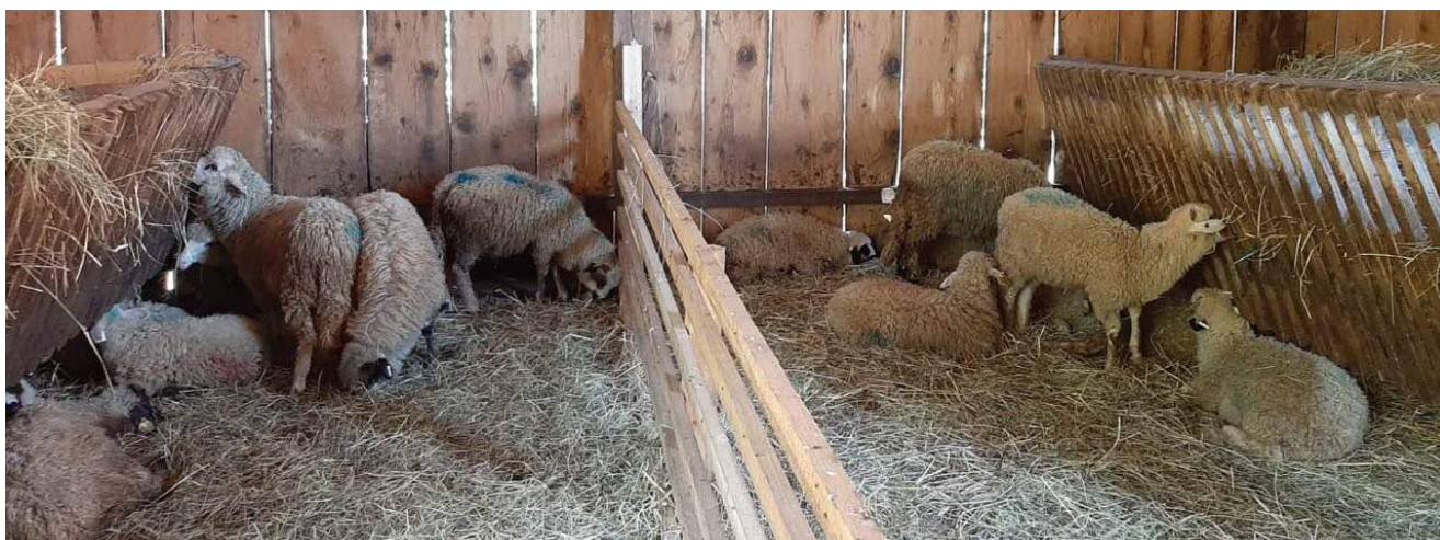
Slika 3. Janjad pasmine lička pramenka.

U dosadašnjim istraživanjima tijekom četiri godine, za plemenitu pečurku znanstveno je utvrđena provjerljiva vrijednost kao funkcionalnog prirodnog dodatka u hranu za janjad pasmine lička pramenka (POPOVIĆ i sur., 2022.) (Slika 3).