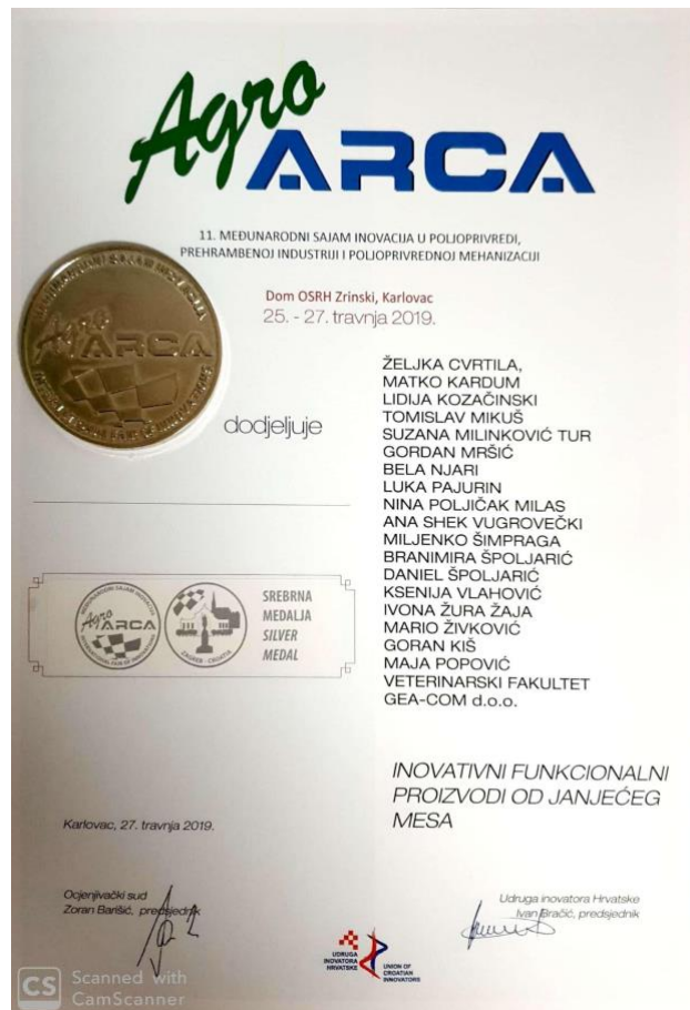
Slika 7. Srebrna medalja i plaketa Udruge inovatora Hrvatske za inovativnost HRZZ projekta 2019..

Udruga inovatora Hrvatske za jedinstvenost inovacije HRZZ projekta kao kreacije novih tehnologija uzgoja i hranjenja janjadi u dijelu koji se odnosi na simbiotsku aktivnost pripravka plemenite pečurke (izravni prebiotik i neizravni probiotik) dodijelila je srebrnu medalju i plaketu za inovacije u poljoprivredi, prehrambenoj industriji i poljoprivrednoj mehanizaciji na 12. Međunarodnom sajmu inovacija u poljoprivredi, prehrambenoj industriji i poljoprivrednoj mehanizaciji održanom od 2. do 4. srpnja 2021. u Prelogu ( https://www.inoanjetina.net/aktivnosti ) (Slika 8).