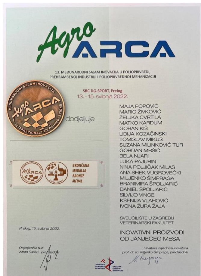
Slika 9. Brončana medalja i plaketa Udruge inovatora Hrvatske za inovativnost HRZZ projekta 2022. (izvor: https://www.inoanjetina.net ).

Od 5 receptura inovativnih funkcionalnih polutrajnih i trajnih proizvodi tri su recepture u sklopu EU projekta „S KLOBASICOM U EU” na međunarodnom sajmu 2. Dani hrvatskih kobasica i salama održanom u Sv. Petar u Šumi 2022. prepoznate kao kreacija inovativnih proizvoda od janjetine s nižim udjelom kolesterola, povoljnim masno kiselinskim i aroma profilom te su im dodijeljene zlatne medalje i plakete (POPOVIĆ i sur., 2022.) (Slika 10, 11, 12).