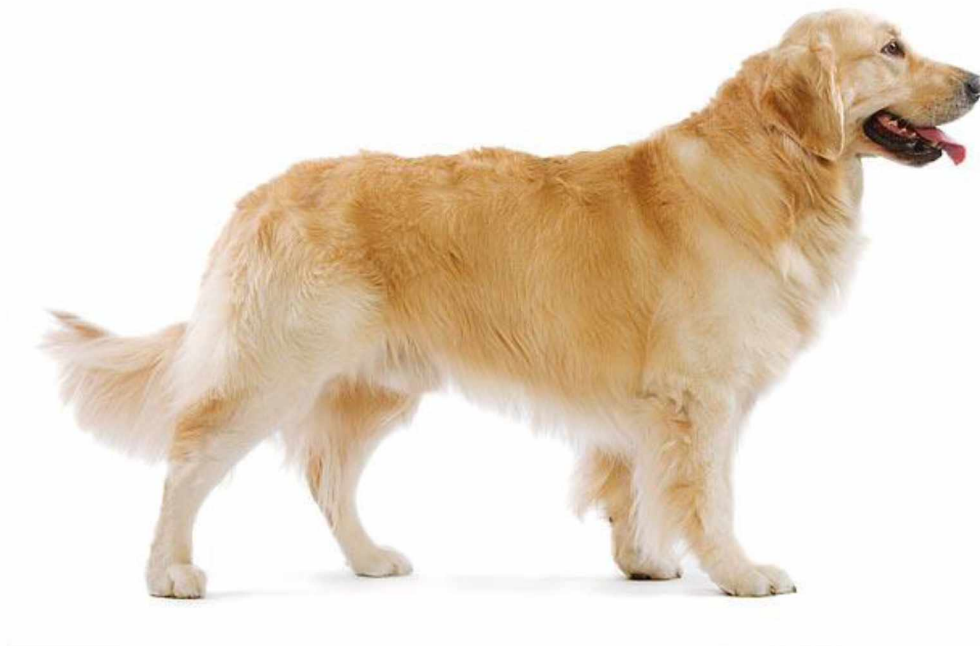
Slika 7. Zlatni retriver