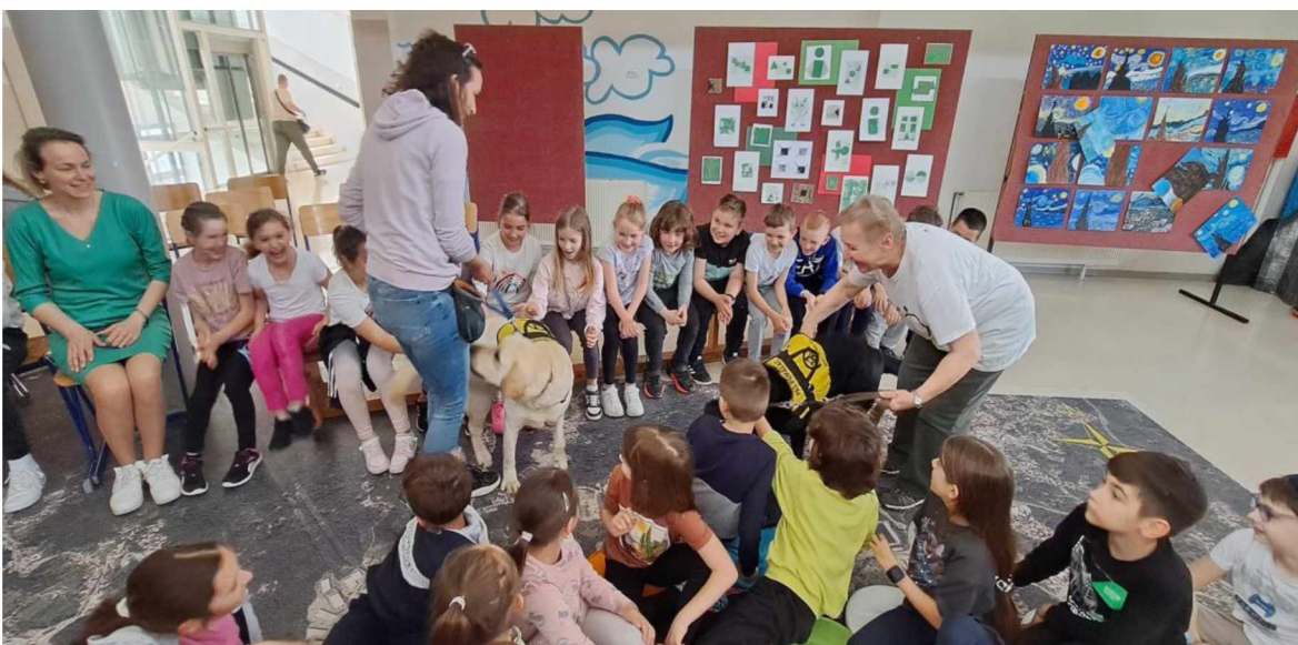
Slika 12. Program uvođenja psa u osnovnoškolsku nastavu