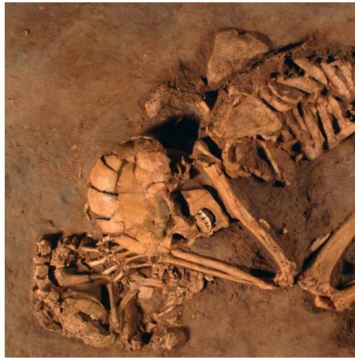
Slika 3. Fosilni ostaci žene i psa pronađeni u Izraelu (nalazište Ain Mallaha) stari oko 12 000 godina

Nije moguće sa sigurnošću tvrditi koja je bila primarna uloga psa u životu tadašnjeg čovjeka - pomoćnik/pratioc u lovu, „higijeničar nastambi“ ili čuvar, no zna se da je pas prva pripitomljena životinja, koja u odnosu na druge domaće životinje od početka ima poseban status. Kako navode TANCREDI i CARDINALI (2023.), pas je u prošlosti služio čovjeku kao živa