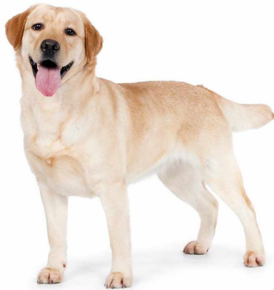
Slika 6. Labrador retriever

inteligenciju te se izvrsno slažu s drugim psima, ljudima i osobito djecom. Entuzijastični su, znatiželjni, razigrani, prijateljski nastrojeni i pouzdani i bez znakova agresivnosti. Zbog svoje izrazito blage naravi, smirenosti, poslušnosti i sjajnih radnih sposobnosti uzgoj labrador retrievera se proširio te je to danas najučestalije korištena pasmina terapijskih pasa i pasa vodiča slijepih, pasa u službi spašavanja ljudi, kao i pasa za otkrivanje droge i eksploziva, a još uvijek služe i kao donosači divljači za lovce. (COILE 2024.; HKS, 2022.a).