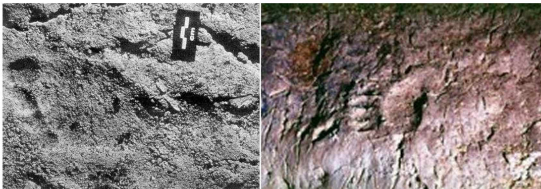
Slika 1. Fosilni otisci stopala djeteta i šapa Canida pronađeni u špilji Chauvet u Francuskoj stari oko 26 000 godina

Najraniji zajednički nalazi čovjeka i pasa otkriveni su na područjima Francuske - fosilni otisci stopala djeteta i šapa Canida , stari oko 26 000 godina u špilji Chauvet (Slika 1), dok su u Oberkasselu u Njemačkoj pronađeni ostaci stari 15 000 god. (Slika 2), a u Izraelu (nalazište Ain Mallaha) stari 12 000 godina (Slika 3) Ostaci pasa pronađeni uz ostatke ljudi ukazuju na činjenicu da su već tada razvijeni bliski odnosi između ove dvije vrste (BAUER, 1989.; ANCIENT PAGES, 2016.; BATES, 2018.; SMITH i VAN VALKENBURGH, 2021.; ). WANG i sur. (2014.) te FREEDMAN i WAYNE (2017.) navode da su počeci domestikacije pasa započeli prije 30 000 do 15 000 godina.