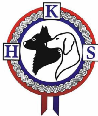
Slika 5. Logo HKS-a

Danas HKS objedinjuje 135 kinoloških udruga i pasminskih klubova iz svih krajeva Hrvatske, pri čemu je glavni cilj njegova rada promocija kinologije kroz uzgoj čistokrvnih pasa, očuvanje zdravlja pasa i briga za poboljšanje odnosa ljudi i pasa, priprema i organizacija međunarodnih aktivnosti sa ostalim kinološkim savezima u svijetu, te zaštita prava članova saveza. Organizacija izdaje međunarodno priznate rodovnice i brine se o izobrazbi kinoloških sudaca u skladu s pravilima FCI-a, kao krovne organizacije (HKS, 2024.).