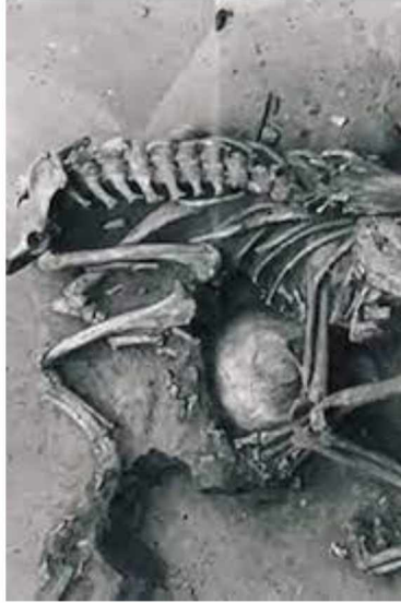
Slika 2. Fosilni ostaci psa i djeteta pronađeni u Oberkasselu u Njemačkoj stari oko 15 000 godina (izvor: BATES, 2018.)