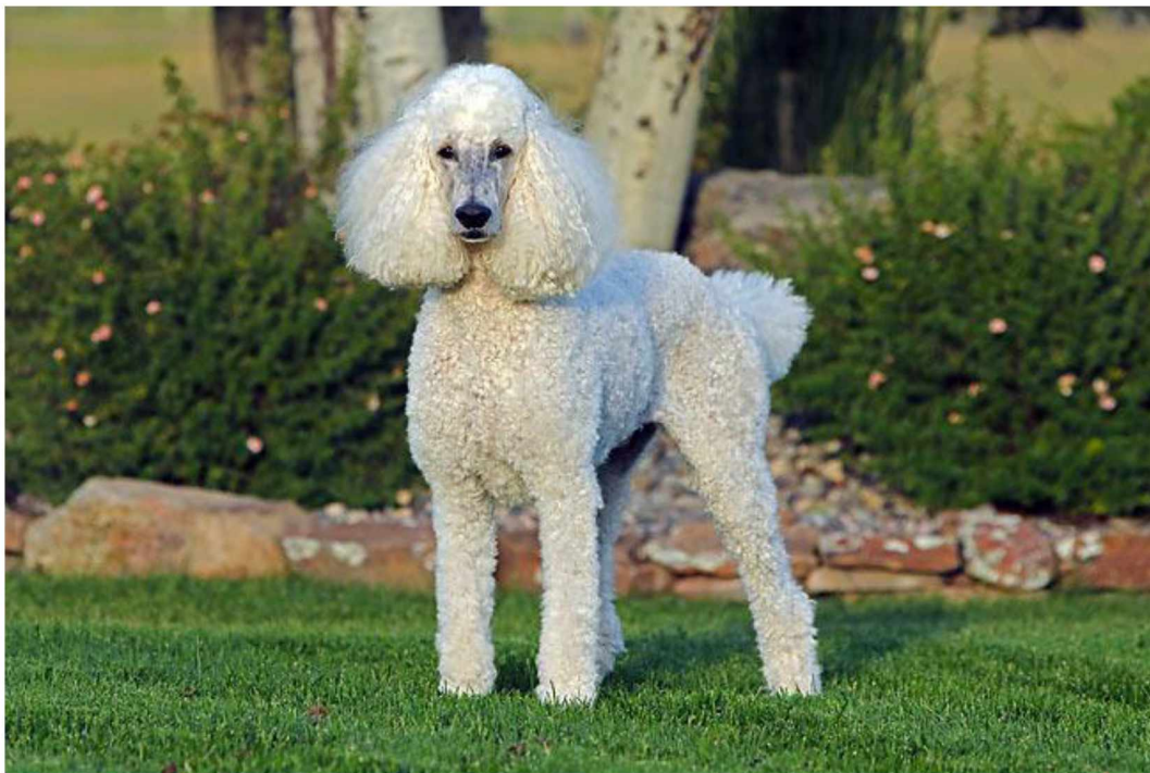
Slika 8. Pudl

Ova je pasmina poznata po svojoj vjernosti, želji za učenjem i sposobnosti da bude obučavana. Izuzetno su inteligentni psi, lako ih je dresirati i potrebna im je konstantna mentalna stimulacija. Također uživaju i ističu se u raznim psećim sportovima, uključujući agility , poslušnost i praćenje. Iznimno vole društvo ljudi i odlično se slažu s djecom (AKC, 2024.c; HKS, 2022.b).