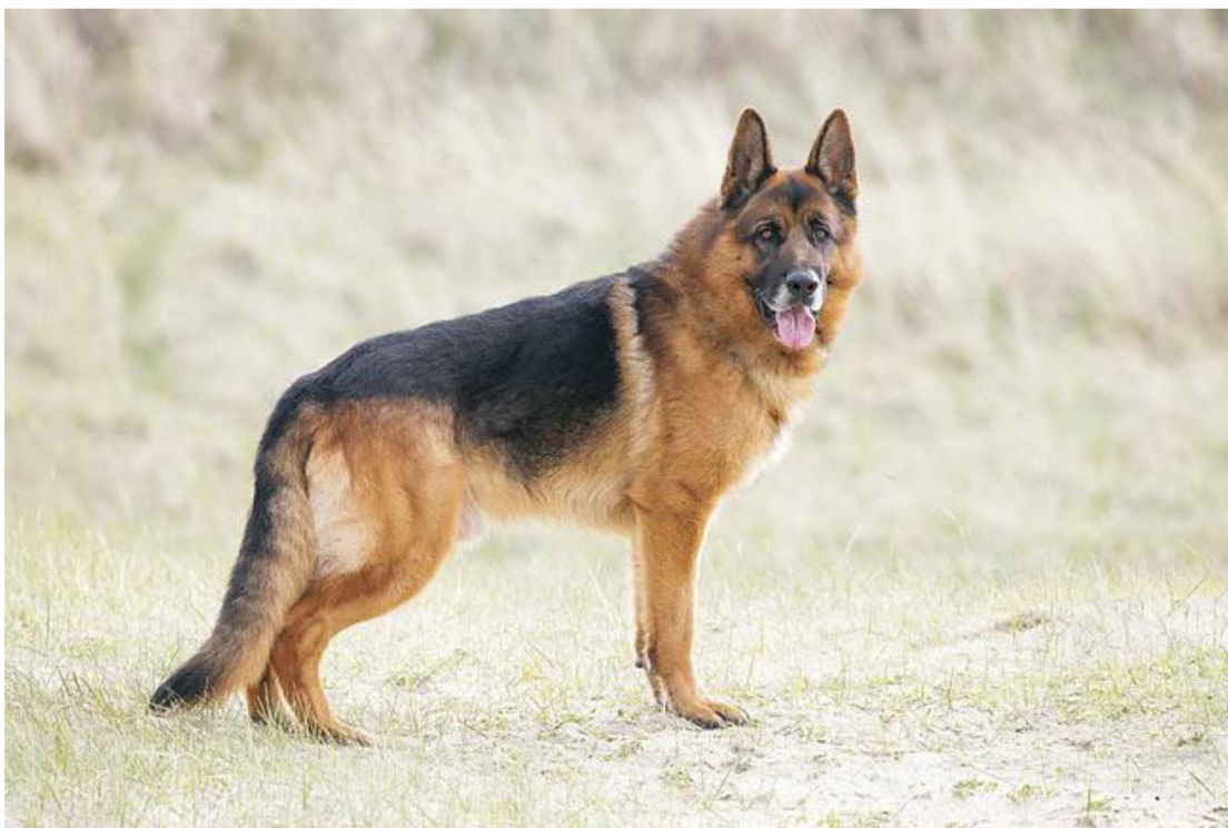
Slika 9. Njemački ovčar

U kontekstu dlačnog pokrova njemačkog ovčara, u hrvatskom jeziku su uvriježeni nazivi kratkodlaki i dugodlaki njemački ovčar. Kod kratkodlakog njemačkog ovčara dlaka mora biti čim gušća, izrazito oštra te mora prilijegati uz tijelo, dok je kod dugodlakog ona dugačka, meka te nije polegnuta uz tijelo. Na stražnjim stranama nogu duga dlaka doseže skočni zglob tvoreći izražene „gaće“ sa stražnje strane bedara (HKS, 2022.c).