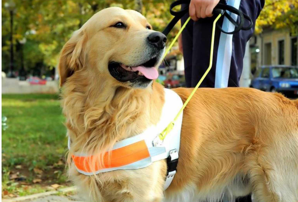
Slika 10. Pas pomagač u svom radnom prsluku

Na trajnu razdoblja treninga očekuje se od psa pomagača da uspješno izvrši 90% zadataka na prvu naredbu (WORLD DOG FINDER, 2024.)