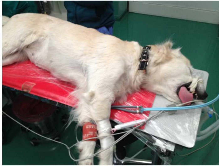
Slika 3. Lateralni položaj (bočni ležeći položaj)

Manje je vjerojatno da će lateralni položaj (Slika 3) uzrokovati gastroezofagealni refluks u usporedbi s dorzalnim ležećim položajem. Međutim, potrebno je paziti da ne dođe do kompresije strane trbuha na kojoj pas leži te posljedičnog utjecaja na protok krvi u trbušne organe na toj strani (FOSSUM i sur., 2013.).