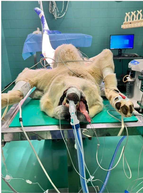
Slika 1. Dorzalni položaj (leđni položaj)

U dorzalnom položaju (Slika 1) može doći do povećanog pritiska na dijafragmu, potencijalno smanjujući plućni volumen i oštećujući respiratornu funkciju. Položaj također može uzrokovati gastroezofagealni refluks ako se refluksirani sadržaj udahne u pluća, što može dovesti do ezofagitisa ili aspiracijske pneumonije (GALATOS i RAPTOPOULOS, 1995.; GARTNER i sur., 1996.).