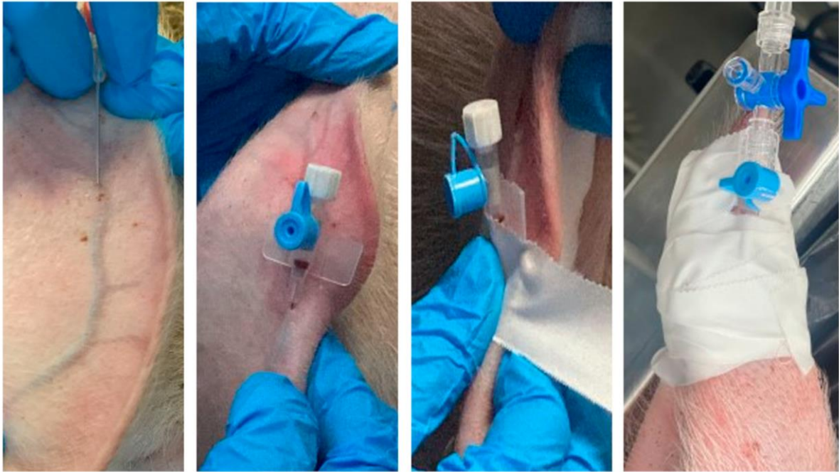
Slika 1. Montaža i fiksacija perifernog katetera u aurikularnu venu