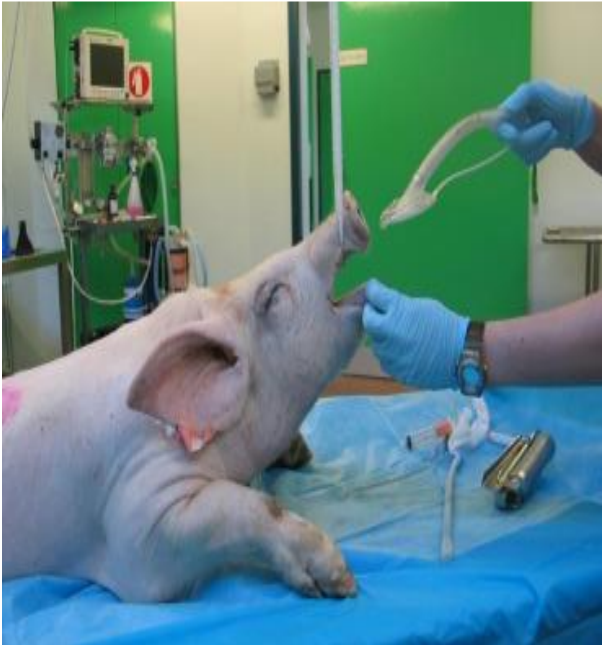
SLIKA 2. Endotrahealna intubacija (sternalni položaj), izvor: Fleischmann i sur. (2023.): Anesthesia and analgesia in laboratory pigs

https://www.sciencedirect.com/science/article/abs/pii/B9780128222157000317