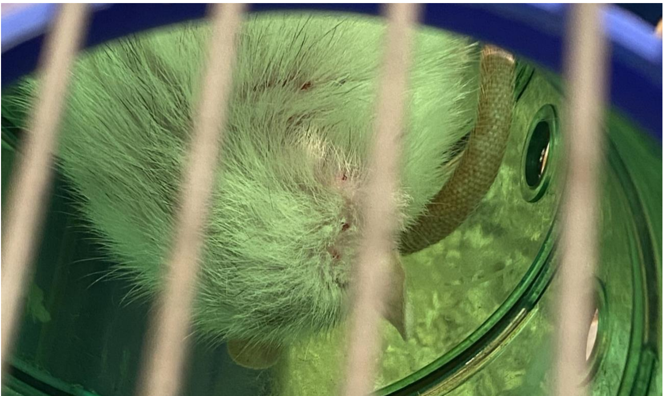
Slika 9. Dermatitis uzrokovan infestacijom grinjama.

Dermatitisi u štakora većinom su sekundarne bakterijske etiologije zbog primarnih ozljeda kože (RICH i sur., 2023.). Primarni uzroci infestacija su grinjama (Slika 9.) i trauma kože (ugrizi, ozljede od oštrog ruba kaveza). Sekundarno dolazi do infekcije kože najčešće bakterijama iz roda Staphylococcus . Prisutna su bezdlačna područja s vlažnom okolnom dlakom. Liječenje ne uključuje samo antibiotsku terapiju već i uklanjanje primarnih uzroka. Infestacija grinjama povezana je s neadekvatnim uvjetima držanja i česta je kod štakora koji su držani u loše održanim kavezima (HORN i sur., 2012.).