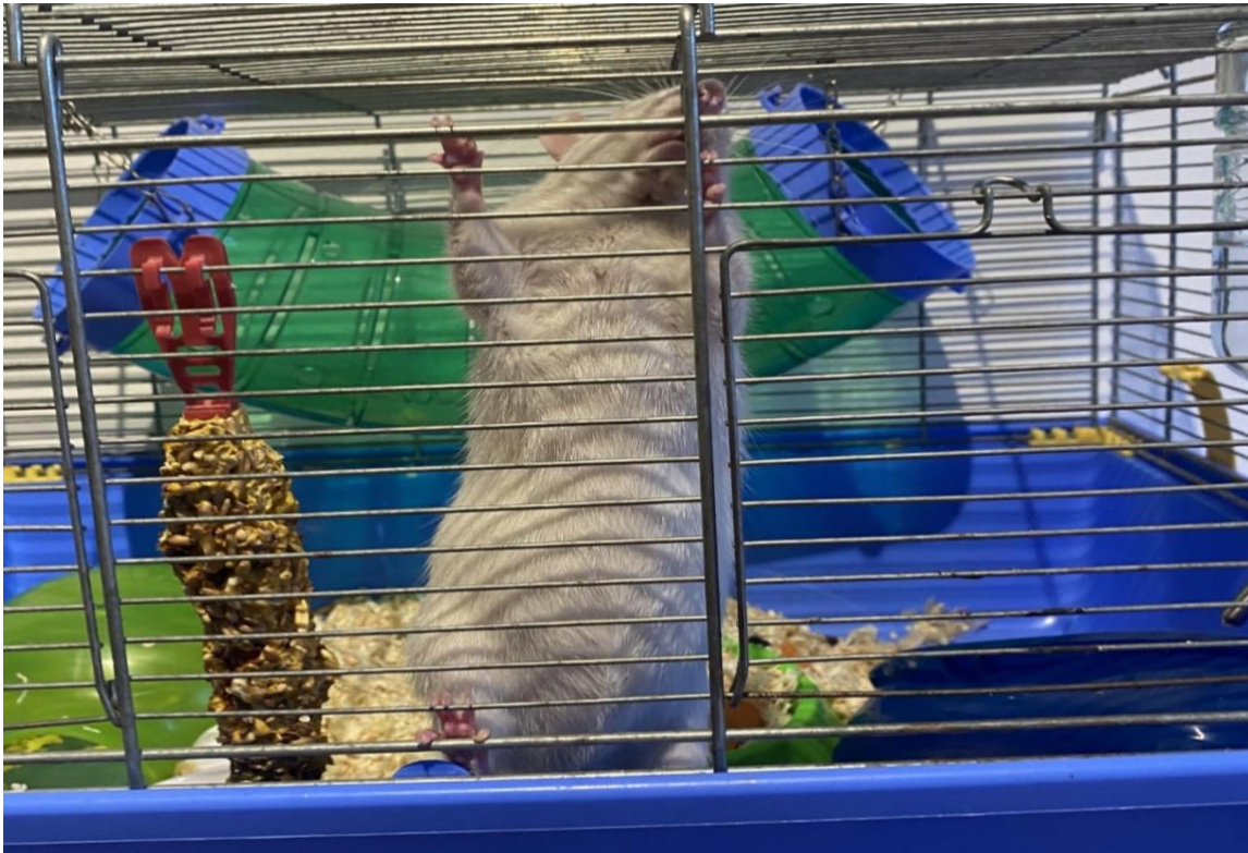
Slika 3. Zdrav i pokretan štakor.