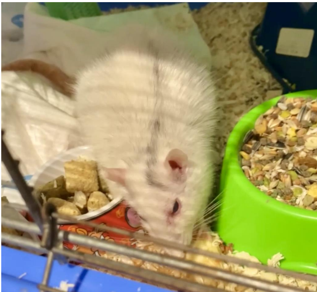
Slika 8. Crvene suze u medijalnom očnom kutu.