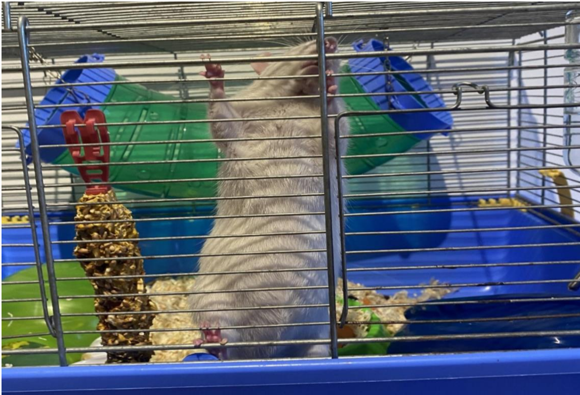
Slika 3. Zdrav i pokretan štakor.