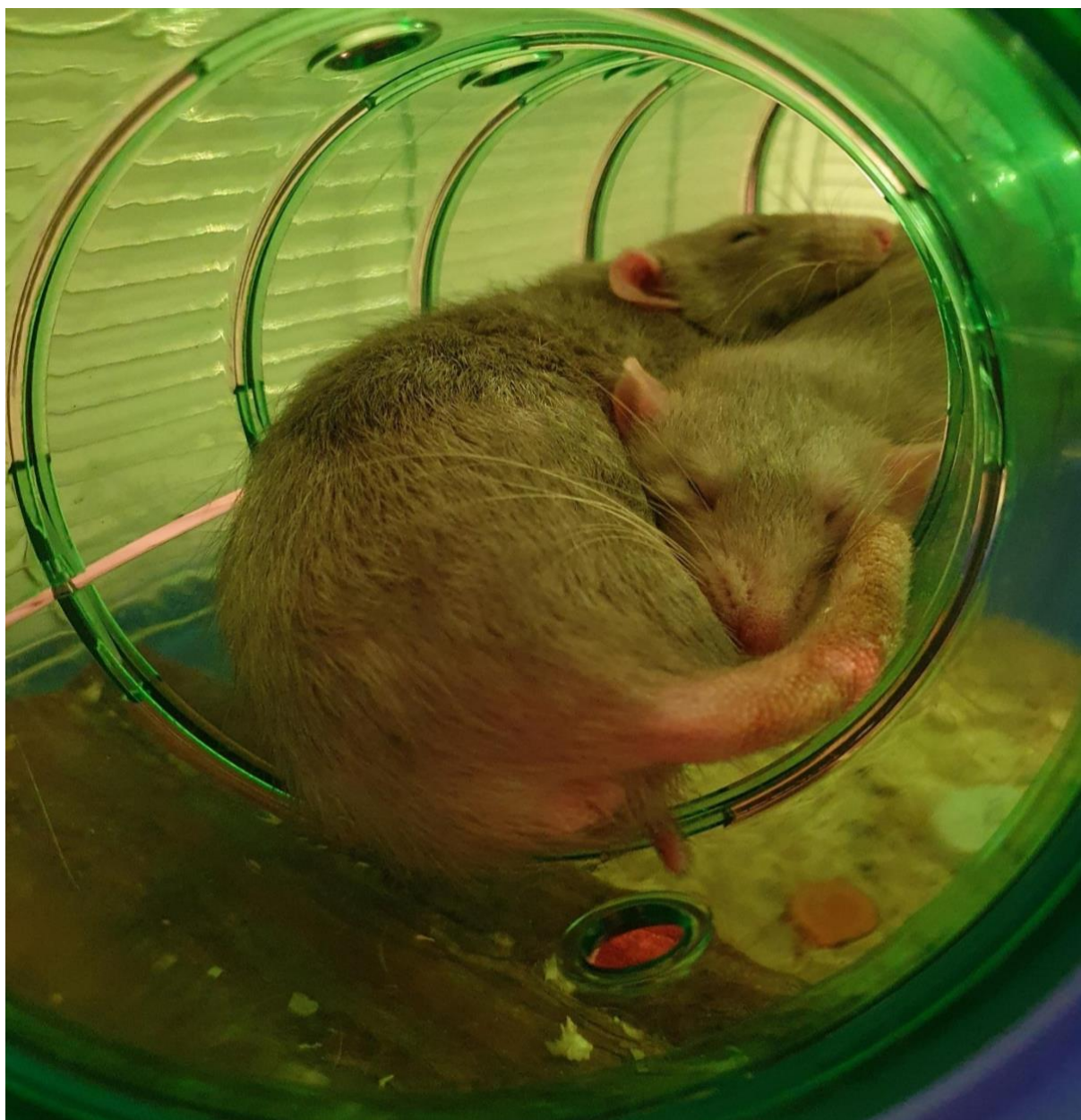
Slika 4. Tunel za štakore.