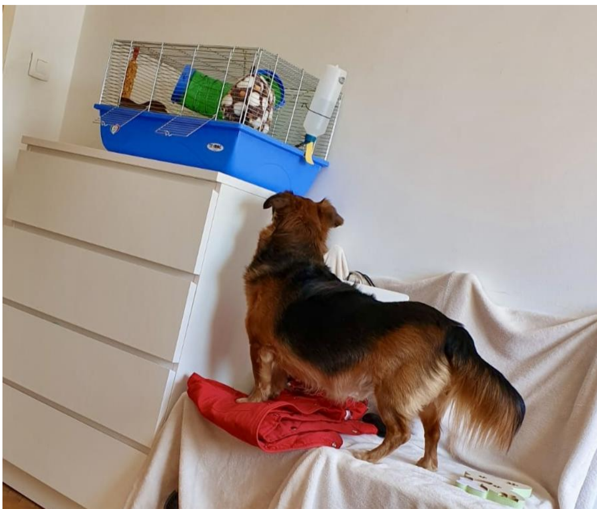
Slika 7. Kavez na povišenom i izvan dohvata psa.