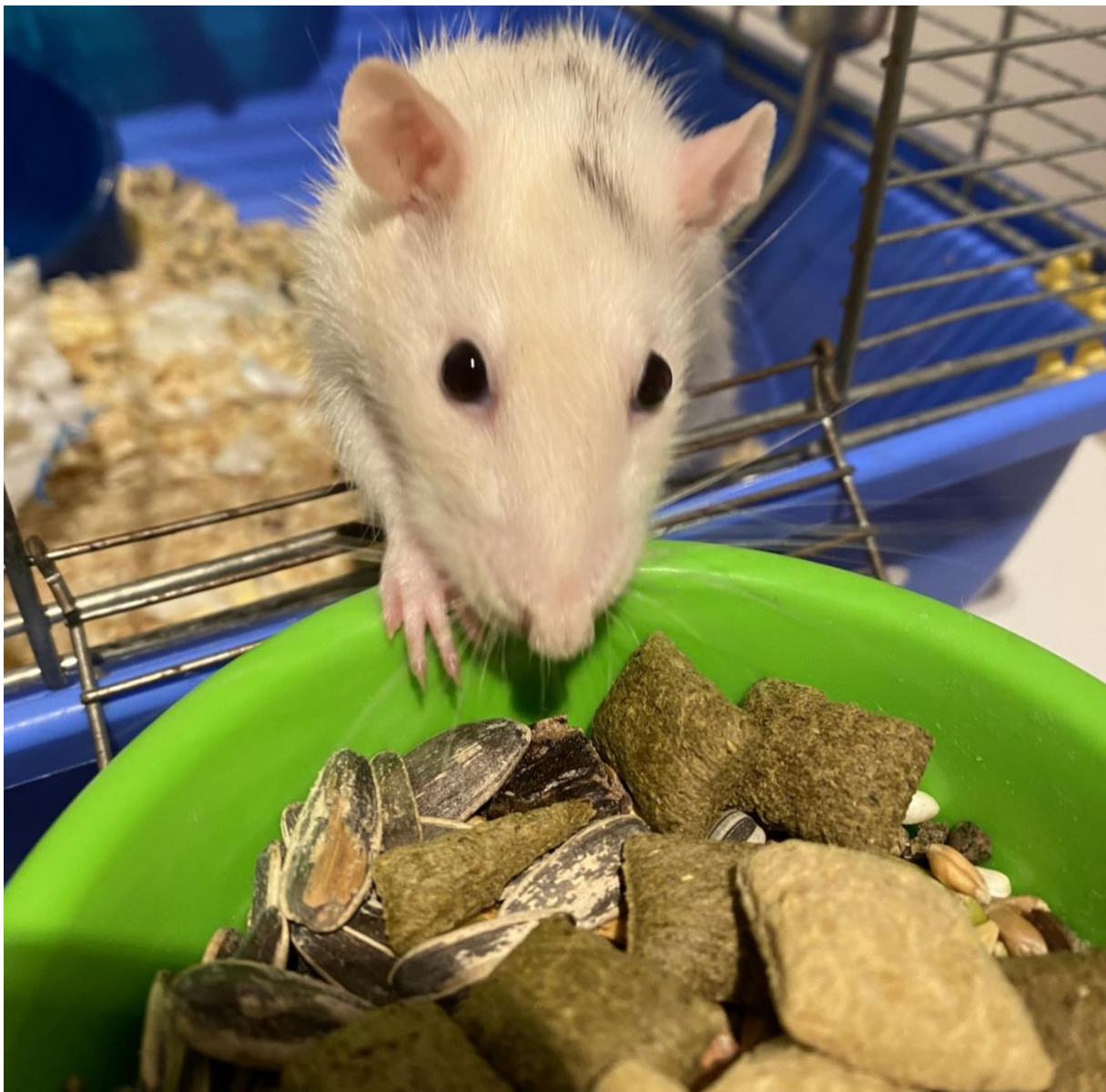
Slika 6. Žitarice kao hrana za štakore i izvor esencijalnih masnih kiselina i proteina.

Optimalna prehrana treba sadržavati hranu biljnog i životinjskog podrijetla u umjerenim količinama kako bismo izbjegli pretilost i druge zdravstvene probleme povezane s prehranom u štakora (BASTIAS-PEREZ, 2020.).