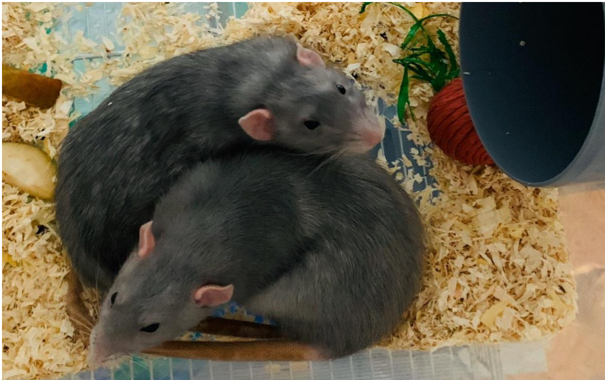
Slika 5. Par muških štakora držan u kavezu s piljevinom.

Uz stelju potrebno je štakorima pružiti i materijal za izradu gnijezda. Na taj način obogaćujemo okolinu i omogućujemo im bolje uvjete života. Materijali koje štakori mogu koristiti za izradu gnijezda narezani su komadići papira i papirnati kuhinjski ručnici, ali isto tako mogu graditi gnijezdo steljom. Preporuča se papirnate kuhinjske ručnike položiti cijele komade u kavez jer im se na taj način omogućava da sami usitnjavaju komade papira i grade gnijezdo kroz igru (KHOO i sur., 2020.).