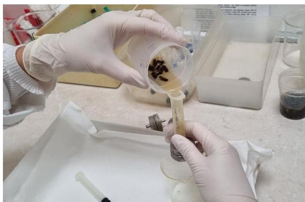
Slika 2. Priprema mikroskopskog preparata.

Nakon prikupljana uzoraka odraslih pčela na terenu, uzorci su spremljeni u plastične vrećice te pohranjeni u zamrzivaču na -20\text{ }^{\circ}\text{C} do pretraživanja. Tijekom pripreme za laboratorijsko pretraživanje, iz svake je vrećice nasumično izvučeno 10 pčela te stavljeno u plastičnu čašu. U čašu je dodano 10 mL destilirane vode, a uzorak pčela dobro je zgnječen plastičnim štapićem kako bi se oslobodio sadržaj crijeva te promiješan kako bi se dobio što homogeniji uzorak za pretraživanje pod svjetlosnim mikroskopom (Slika 2. i 3.). Dobivenu suspenziju crijevnog sadržaja pretraživanih pčela uziman je jednokratnom pipetom te stavljen po dvije kapi na Malassezijev hemocitometar te prekriven pokrovnim stakalcem za mikroskopiranje.