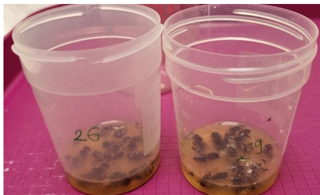
Slika 3. Pripremljeni uzorak za pretraživanje pod svjetlosnim mikroskopom.