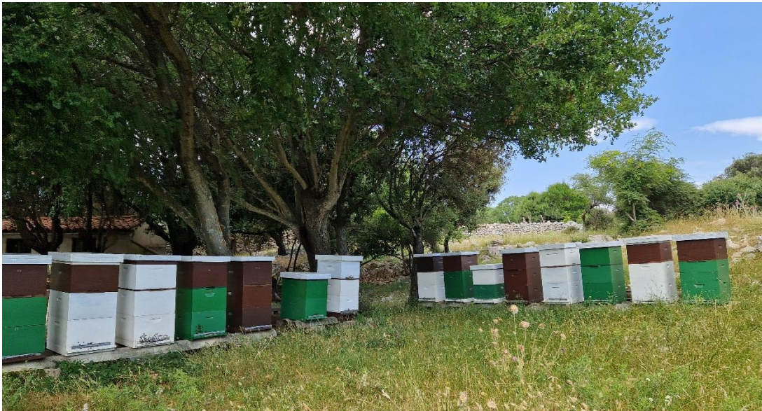
Slika 1. Izgled proizvodnog pčelinjaka na kojem je obavljen terenski dio istraživanja.

Pčelinjak na kojemu je provedeno istraživanje nalazi se na otoku Cresu, na istočnoj strani otoka. Smješten je oko dva kilometra od sela Hrasta, te predstavlja stacionarni tip pčelinjaka. Na pčelinjaku nalazi se 40 pčelinjih zajednica koje su smještene u Langstroth-Root tipu košnica (Slika 1.), koje su vertikalni tip košnice i kojih su svi dijelovi standardizirane izrade te jednakih dimenzija. Istraživanje je provedeno na 24 pčelinje zajednice od kojih je 12 predstavljalo kontrolnu skupinu (ŠP-K) prihranjivanu komercijalnim šećernim pogačama. Zajednice u pokusnoj skupini (PrP-P) prihranjivane su komercijalnom proteinskom pogačom (12) koja sadrži proteinske zamjenice (bez pčelinjeg peluda).