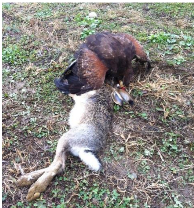
Slika 11. Ženka harisovog jastreba nakon uspješnog lova na zeca, vlasništvo sokolara Harija Heraka.

Najčešći i najbolji način lova harisovim jastrebom je slijeđenjem s drveta na drvo dok teren ispod pretražuje pas koji pronalazi i podiže divljač.