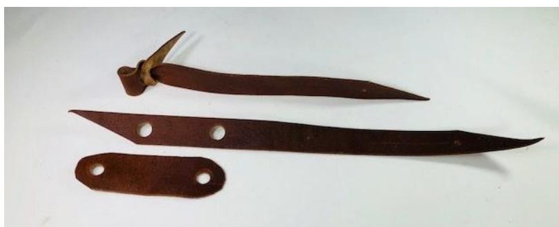
Slika 16. Tradicionalne vezice.

Kožne vezice stavljaju se ptici oko noge, a služe za kontroliranje ptice koja je na rukavici, na stalku ili dok se pušta da poleti za lovinom. Dijelimo ih na tradicionalne vezice te prave i lažne Aylmere. Tradicionalne vezice (Slika 16) koriste se za bolesne i ranjene ptice grabljivice koje su u procesu rehabilitacije ili za ptice koje ne love. Naime, one su trajno pričvršćene ptici oko noge zbog čega se lako mogu zapetljati u gustom raslinju. Po završetku rehabilitacije, tradicionalne vezice se skidaju.