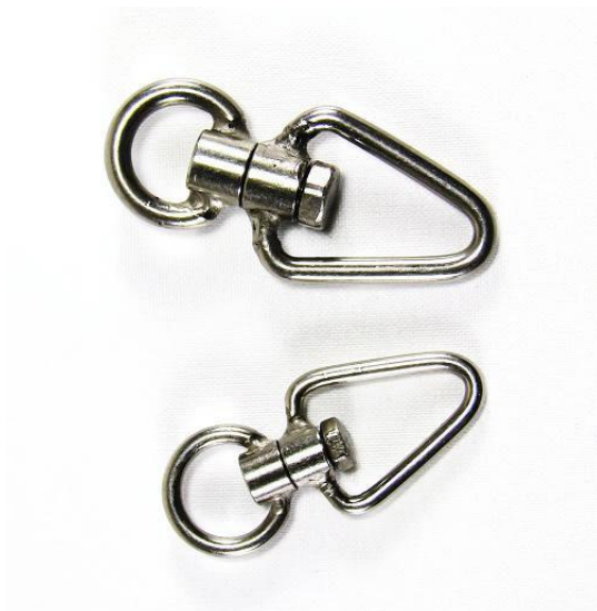
Slika 19. Vrtilice.

Vrtilica je metalni dio kroz koji se provlače uzica i vezice dok je ptica na rukavici ili stalku (Slika 19). Vrtilice sprječavaju ispreplitanje vezica dok ptica silazi i vraća se na stalak.