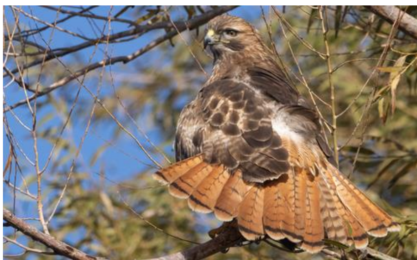
Slika 4. Crvenorepi škanjac (lat. Buteo jamaicensis) iz skupine širokokrilnih ptica koje odlikuju duga, zaobljena i široka krila te kratak rep.