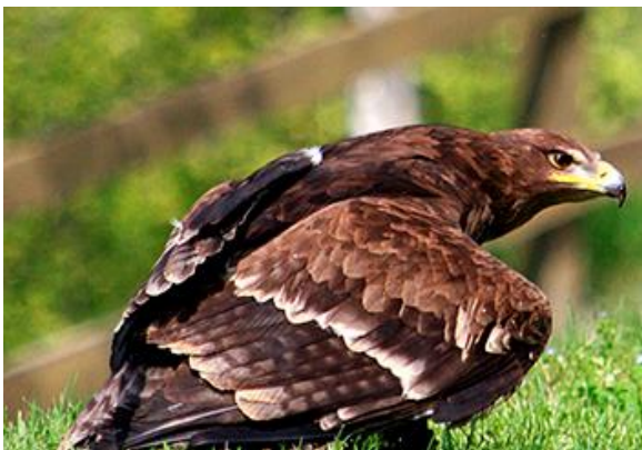
Slika 7. Suri orao (lat. Aquila chrysaetos ).