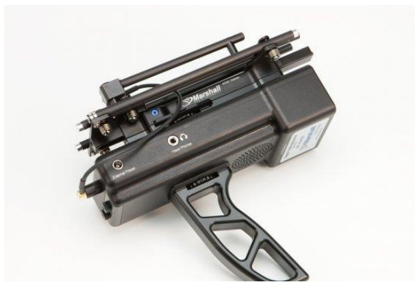
Slika 22. Prijamnik.

Telemetrijski uređaj služi za lakši pronalazak izgubljenih ptica. Naime, ptice ponekad kilometrima progone svoju lovinu i tako se izgube iz vida pa ih sokolar ne može pronaći. Ovaj uređaj se posebno preporučuje za sokolove i jastrebove koji su izrazito lovne ptice. Prijamnik (Slika 22) i antena nalaze se kod sokolara dok je odašiljač (Slika 23) pričvršćen za rep ili nogu ptice.