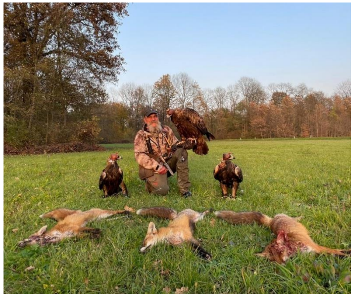
Slika 13. Sokolar Hari Herak na sokolarskom susretu u Beltincima u Sloveniji s tri uhvaćene lisice s tri različita sura orla u jedno prijepodne.

Lov na lisice pomoću surih orlova ukazuje na mogućnost redukcije predatora koji inače smanjuju brojnost populacije sitne divljači koja je nužan preduvjet za bavljenje sokolarstvom (ŠEGRT, 2022.).