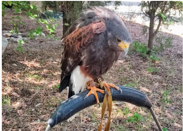
Slika 6. Harisov jastreb (lat. Parabuteo unicinctus ), vlastita fotografija snimljena u Sokolarskom centru Šibenik.