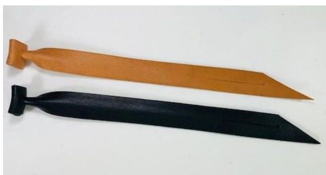
Slika 18. Kožna vezica koja se izvlači iz metalnoga kruga te ptica nesmetano leti i lovi.