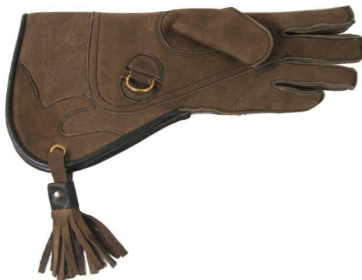
Slika 24. Sokolarska rukavica.

Rukavica za sokolarenje (Slika 24) je potrebna za držanje i nošenje ptice te mora biti sigurna i udobna za samog sokolara kao i za pticu koja stoji na njoj. Za osiguravanje ptice potrebno je zavezati sokolarski čvor kroz metalni obruč na rukavici.