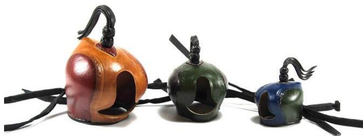
Slika 21. Kapice za sokolarenje.

Kapice služe za smirivanje ptice kod početnih treninga, prije početka lova ili tijekom lova dok druga ptica lovi, kao i za lakši transport (Slika 21).