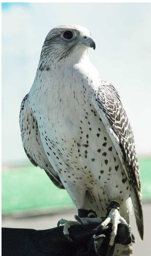
Slika 2. Sjeverni ili islandski sokol (lat. Falco rusticolus ) iz skupine dugokrilnih ptica koje odlikuju duga ušiljena krila i srednje dugačak rep.