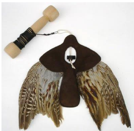
Slika 25. Vabilo od krila fazana.

Osim za uvođenje u lov, vabilo se koristi i za podizanje kondicije ptice. Naime, ptice mogu hvatati vabilo u onim danima kada nemaju priliku za pravi lov čime se povećava njihova izdržljivost i mišićna masa.