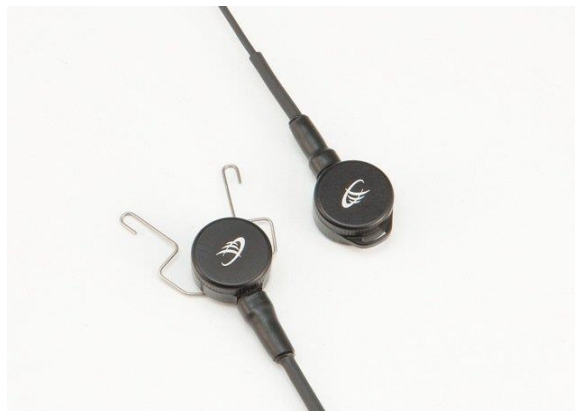
Slika 23. Odašiljač.