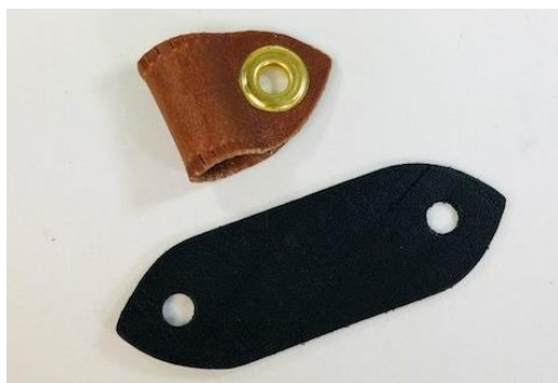
Slika 17. Prvi dio alymera ili lovnih vezica koji je trajno pričvršćen za nogu ptice.

Aylmeri su, za razliku od tradicionalnih vezica koje se sastoje iz jednog dijela, napravljeni iz dva kožna dijela. Jedan dio pričvrsti se ptici oko noge (Slika 17), a drugi se provuče kroz rupu prvog dijela (Slika 18). Napravljeni su tako da se prije leta ptice mogu izvući vezice koje bi inače lako zapele u granama, a dio oko noge ostaje na ptici i ne ometa ju u lovu i letu.