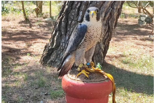
Slika 8. Sivi sokol (lat. Falco peregrinus ), vlastita fotografija snimljena u Sokolarskom centru Šibenik.