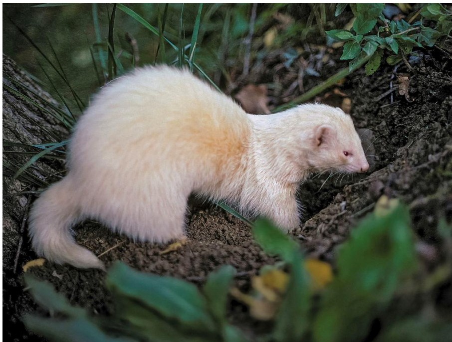
Slika 29. Pitoma vretica bijele boje lakše je uočljiva sokolaru i ptici.

Pomoću afričkog tvora love se kunići skriveni u rupama. Vretice ulaze u kuničje rupe, a sokolar sa pticom čeka da kunić istrči van. Vrlo je važno potpuno socijalizirati vreticu i pticu grabljivicu što se najbolje postiže ako vretica odrasta uz pticu. Idealna je bijela boja vretice (Slika 29) jer je lako uočljiva sokolaru i ptici. Također, bolje je loviti pomoću ženke afričkog tvora jer su mužjaci veći i sami su sposobni uloviti kunića kojeg se najedu i ostanu spavati u rupi. Ovaj način lova prakticira se sa jastrebovima, harisovim jastrebima i crvenorepim škanjcima (ŠEGRT, 2006.).