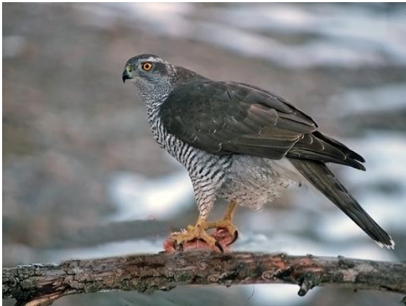
Slika 5. Jastreb (lat. Accipiter gentilis ).

Najčešće sokolarske ptice koje se mogu vidjeti i na sokolarskim susretima su redom: jastreb (lat. Accipiter gentilis , Slika 5), harisov jastreb (lat. Parabuteo unicinctus , Slika 6), suri orao (lat. Aquila chrysaetos , Slika 7) i sivi sokol (lat. Falco peregrinus , Slika 8).