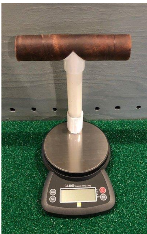
Slika 15. Digitalna vaga.

Vaga spada pod najvažniji dio sokolarske opreme. Vaganjem saznajemo nalazi li se ptica na letnoj težini, u kakvom je zdravstvenom stanju i je li spremna za lov. Digitalne vage su preciznije od analognih te su posebno dobre kod vaganja malih sokolarskih ptica poput kobca ptičara. Idealna vaga precizno mjeri u gramima te dolazi sa stalkom na kojem ptica stoji za vrijeme vaganja (Slika 15).