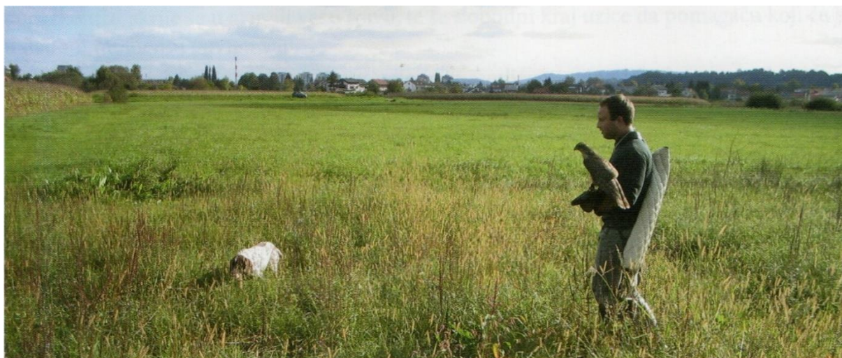
Slika 26. Lov s ruke sa jastrebom i psom ptičarom.

Osim ptičara, mogu se koristiti i psi šunjkavci koji neće markirati divljač, već će ju podizati u krugu od dvadesetak metara (ŠEGRT, 2006.).