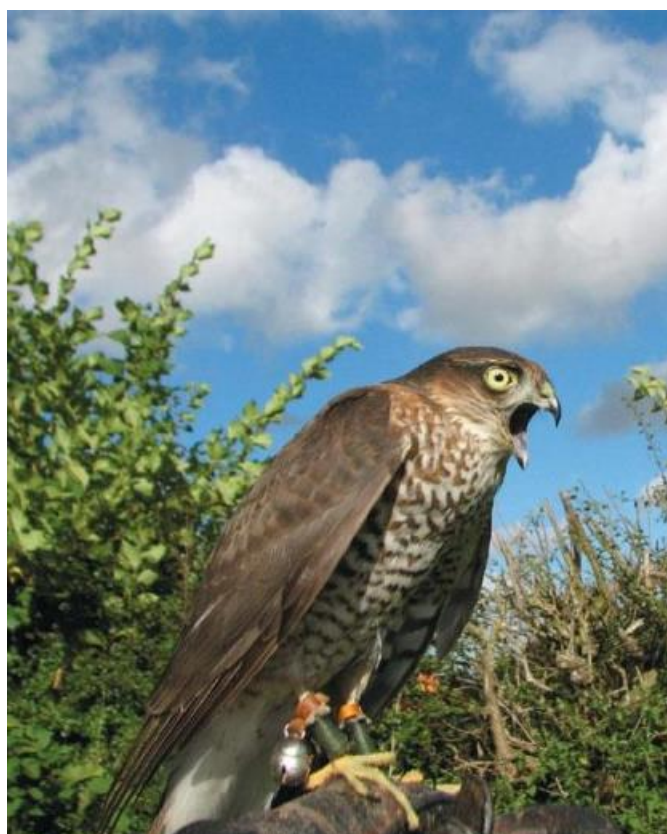
Slika 3. Kobac ptičar (lat. Accipiter nisus ) iz skupine kratkokrilnih ptica koje odlikuju kraća, zaobljena krila i dugačak rep. Izvor (CRANE, 2014.)

commons.wikimedia.org/wiki/File:Falco_rusticolus