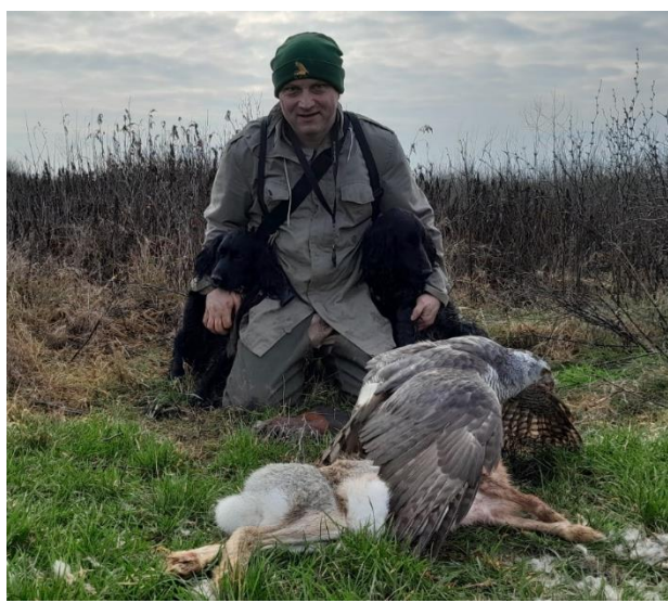
Slika 10. Sokolarenje na zeca sa ženkom jastreba uz pomoć špringer španijela i koker španijela.