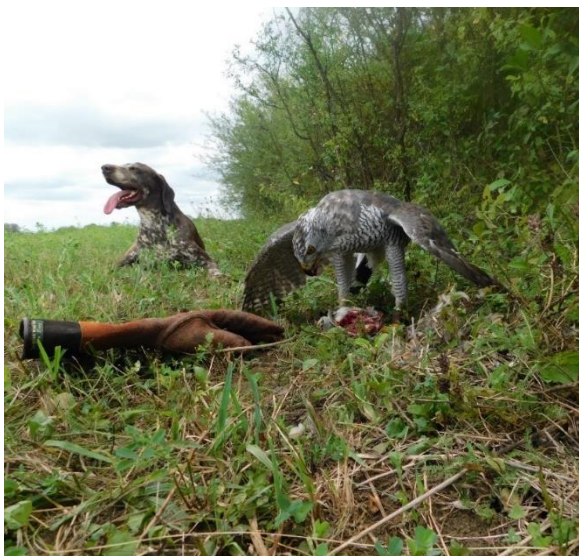
Slika 9. Sokolarenje na prepelice pućpure s mužjakom jastreba i njemačkom kratkodlakom ptičarkom.

Jastrebovi su izrazito lovne ptice koje napadaju i hvataju daleko veći plijen od svoje veličine. S obzirom na to da su vrlo agresivni, ne preporučuju se početnicima čije neiskustvo ponekad kažnjavaju napadom i obrušavanjem (ŠEGRT, 2006.).