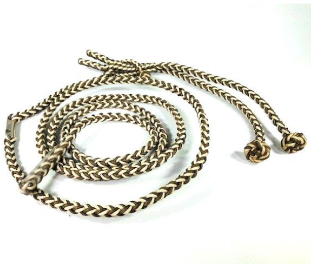
Slika 20. Uzice s čvorovima.

Uzica je najčešće komad užeta s čvorom na kraju (Slika 20), a služi za vezanje ptice koja je na rukavici ili stalku. Uzica ne smije biti preduga jer bi mogla uzrokovati ozbiljne ozljede ptice. Debljinu uzice potrebno je prilagoditi veličini i snazi ptice.