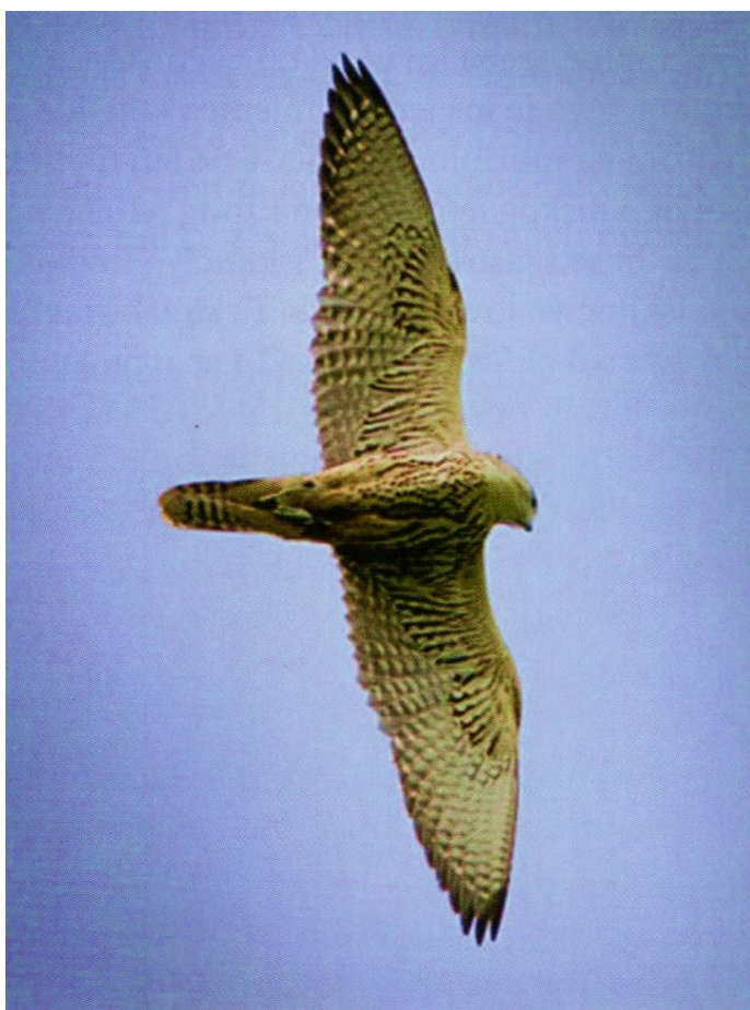
Slika 27. Ptica radi male koncentrične krugove iznad psa i sokolara dok čeka podizanje divljači.

Sokolar pomoću psa ptičara pretražuje teren dok se ptica nalazi na rukavici. U trenutku kada pas markira divljač, sokolar pušta pticu u zrak. Kada ptica postigne dobru visinu počinje raditi male koncentrične krugove iznad psa i sokolara i čeka na podizanje divljači. Na sokolarev znak, pas podigne divljač, a ptica se krene obrušavati na nju. U ovom načinu lova koriste se samo ptičari zbog svoje sposobnosti da označe i čekaju s podizanjem divljači dok se ptica ne postavi u dobru poziciju za obrušavanje, kako je prikazano na Slici 27 (ŠEGRT, 2006.).