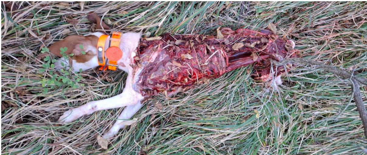
Slika 9: Lovački pas gonič usmrćen i djelom pojesten od vukova tijekom lova na planini Svilaji 10. 11. 2024.