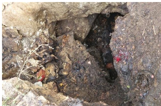
Slika 4: Prirodni ponor u lovištu XVII/2 – Borovača u koji je bacan klaonički otpad tijekom 2023. i 2024. godine (KUSAK i sur., 2025.).

Ovakve okolnosti mogle biti izvor navikavanja vukova na hranu iz ljudskih izvora, a time i nastanka smjelih vukova.