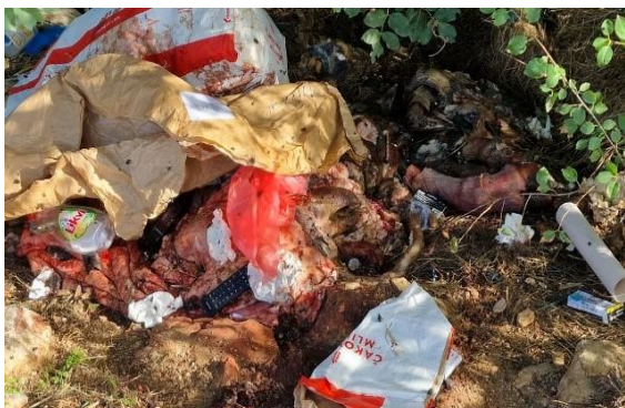
Slika 3: Mjesto uz cestu na granici lovišta XVII/113 – Ljubeč i XVII/112 – Biluš tipično je mjesto kod kakvih se može uz kruti kućanski (bijela tehnika) i građevinski otpad povremeno naći i klaonički otpad (KUSAK i sur., 2025.).