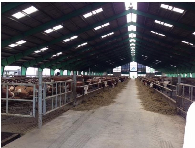
Slika 1. Farma mliječnih krava s vanjskom klimom Visoke Tatere – Slovačka