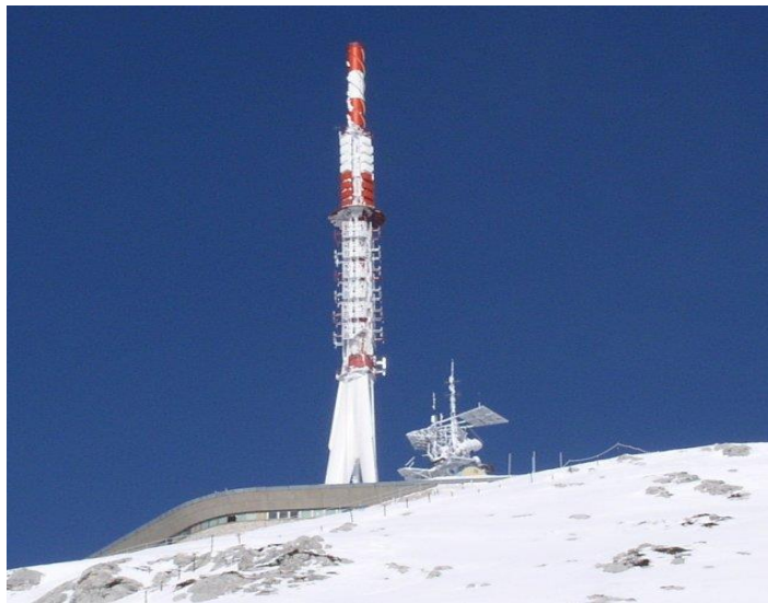
Slika 5. Odašiljač Sv. Jure na Biokovu

modulacijom (ultra kratki val) samo za uže mjesno područje, ali s mnogo boljom kvalitetom zvuka. Osim toga, antene frekventno moduliranih radio valova (FM) kao i televizijskih odašiljača te repetitora mnogo su manje nego antene AM valova i smještene su na stupove metalne konstrukcije, visoke nekoliko desetaka do stotinjak metara. Frekvencije radiovalova su u području od 1 MHz do 300 MHz, a za televiziju se koriste frekvencije i do 1 GHz. Za ta područja, kao mjera za jačinu izloženosti ne koristi se gustoća magnetskog toka, već je to gustoća toka snage elektromagnetskog vala, za koju se koristi jedinica W/m^2 . Prosječna gustoća toka snage, kojoj je izložena široka populacija u području od 10 do 400 MHz iznosi oko 0,1 W/m^2 , a dopuštena vrijednost za to područje iznosi 2 W/m^2 (Mileusin, 2006.). Uz gore sve navedeno poznato je da se radio i televizijski odašiljači postavljaju na vrhove planina ili na izdignuta područja van naseljenih mjesta da bi se zaštitilo pučanstvo primjerice odašiljač Sv. Jure – Biokovo ili toranj Sljeme – Medvednica. Osim gore opisanih odašiljača u pojedinim mjestima su postavljeni odašiljači unutar samog mjesta te su oni manje snage i uglavnom služe za emitiranje radio i televizijskog programa.