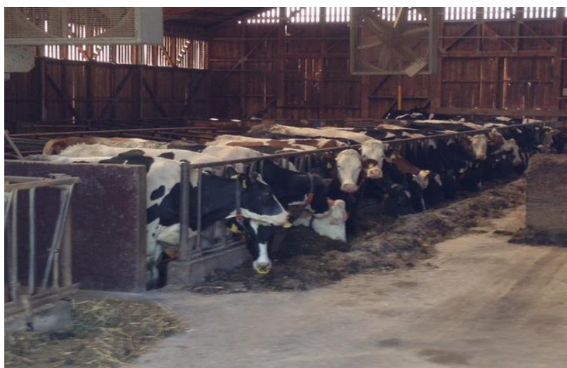
Slika 2. Farma mliječnih krava

Ukoliko prozračivanje nije odgovarajuće, u zatvorenim objektima mogu nastati loši mikroklimatski uvjeti, stvara se visoka vlažnost zraka, te uslijed nedostatne izmjene, njegova loša kvaliteta. Posljedično tome može se razviti veći broj patogenih mikroorganizama, doći do porasta koncentracije štetnih plinova koji u konačnici mogu negativno utjecati na zdravlje životinja. Uz sve navedeno, nedostatno prozračivanje utječe na slabljenje otpornosti organizma te se povećava sklonost nastanka mastitisa, respiratornih infekcija, a to sve u konačnici može rezultirati smanjenom proizvodnošću i plodnošću (Wathes, 1992.; FAWC, 2003.; Ostović i sur., 2008.).