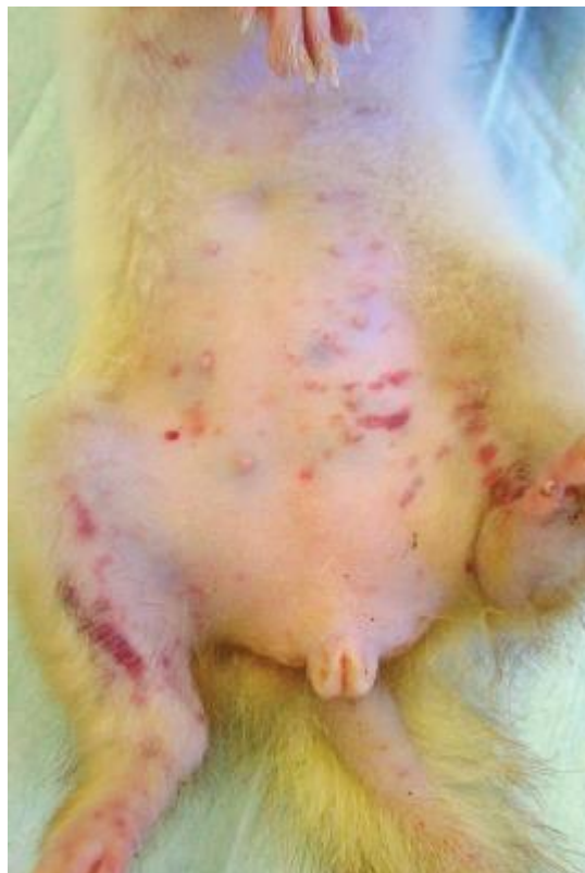
Slika 2. Petehijalna krvarenja nastala zbog trombocitopenije kao posljedica perzistentnog estrusa