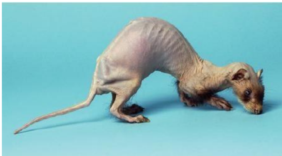
Slika 4. Alopecija u sedmogodišnje kastrirane ženke tvora s hiperadrenokorticismom

Povećane nadbubrežne žlijezde se u nekim slučajevima mogu i palpirati prilikom kliničkog pregleda kao i povećani mezenterični limfni čvorovi. Lijeva nadbubrežna žlijezda se lakše nalazi u odnosu na desnu. Obično je okružena većom količinom masnog tkiva kranijalno od lijevog bubrega i palpira se kao mala, tvrda okruglasta tvorba. Desnu nadbubrežnu žlijezdu je teže palpirati jer je smještena kranijalnije i nalazi se ispod režnja jetre (CARPENTER i QUESENBERRY, 2012.).