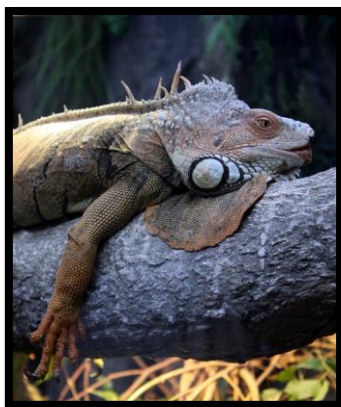
Slika 4. Iguana

Postoji oko 4500 vrsta guštera, (MALJKOVIĆ, 2014.) koje se razlikuju po veličini, anatomiji i fiziologiji.