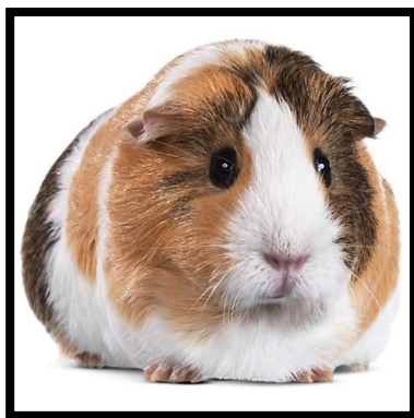
Slika 6. Zamorčić

Zamorčić je noćni glodavac, hrani se biljnom hranom, sličan je dikobraz, zdepast, mužjak je tjelesne mase između 900 i 1200 grama, a ženka između 700 i 900 grama (QUENSBERRY i CARPENTER, 2012.).