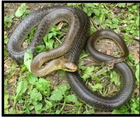
Slika 3. Zmija bjelica

Ključnu ulogu u parenju zmija imaju feromoni (MASON i sur., 1989.), međutim, oni nisu jedini čimbenici potrebni za početak tog procesa. Feromoni služe prepoznavanju i lociranju pripadnika iste vrste, a vizualna identifikacija jedinke je jako važna (KROHMER, 2004.). U zmija su otkriveni spolni steroid-koncentrirajući neuroni unutar neuroputa koji regulira udvaranje i parenje. Ovo nagoviješta da bi spolni hormoni mogli biti neizravno odgovorni za aktivaciju seksualnog ponašanja. Iako su androgeni hormoni povišeni na početku hibernacije, za inicijaciju udvaranja i parenja čini se da nije neophodna izravna kontrola androgenim hormonima (KROHMER, 2004.).