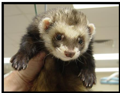
Slika 5. Afrički tvor

Afrički tvor obično postaje spolno zreo u dobi od 8 do 12 mjeseci. Zbog kastracije i izloženosti prekomjernom umjetnom osvjetljenju (do 15 sati) reproduktivno ponašanje mu je izmijenjeno ili potisnuto.