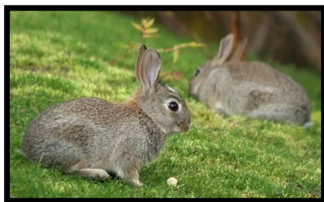
Slika 1. Kunić

Kunići su potomci europskog divljeg kunića, Oryctolagus cuniculus , koji potječe iz srednje Europe i sjeverozapadne Amerike, a kao kućni ljubimci se drže još od početka 16. stoljeća (BROOKS, 1986., CARPENTER, 2003.). Žive u velikim skupinama u jazbinama iskopanim u pjeskovitom, brdovitom terenu i rijetko izlaze danju. Primarno su nokturalne životinje. Imaju visoko razvijenu socijalnu hijerarhiju i budući da su životinje koje predstavljaju plijen predatorima, evoluirali su da radije bježe nego da se bore.