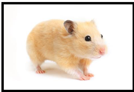
Slika 7. Sirijski hrčak

Hrčak je, kao i ostali glodavci, mala, noćna životinja koja neprestano nešto žvače i glođe zbog sjekutića koji im rastu cijeli život. (EVANS i MALTBY, 1989.; TULLY i MITCHELL, 2001.; BALLARD i CHEEK, 2003.; SIROIS, 2005.). To može biti problematično ako ih se drži kao kućne ljubimce, jer ako nemaju nešto prikladno za glodanje onda glođu sve što nađu. Također, ako se drže u spavaćoj sobi bukom ometaju san vlasnika jer su noćne životinje. Međutim, ako im vlasnici osiguraju prikladni smještaj, hrčci mogu biti odlični kućni ljubimci. Najpoznatiji, sirijski hrčak potječe iz jugoistočne Europe i sjeverozapadne Sirije. Pogodan je za korištenje kao pokusni model. Kineski hrčak je zasebna vrsta ( Cricetus griseus ) i potječe iz istočne Kine. Postoji još puno vrsta, međutim ove dvije su najrasprostranjenije kao kućni ljubimci i laboratorijske životinje (BRADLEY BAYS i sur., 2006.).