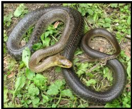
Slika 3. Zmija bjelica

Ključnu ulogu u parenju zmija imaju feromoni (MASON i sur., 1989.), međutim, oni nisu jedini čimbenici potrebni za početak tog procesa. Feromoni služe prepoznavanju i lociranju pripadnika iste vrste, a vizualna identifikacija jedinke je jako važna (KROHMER, 2004.). U zmija su otkriveni spolni steroid-koncentrirajući neuroni unutar neuroputa koji regulira udvaranje i parenje. Ovo nagoviješta da bi spolni hormoni mogli biti neizravno odgovorni za aktivaciju seksualnog ponašanja. Iako su androgeni hormoni povišeni na početku hibernacije, za inicijaciju udvaranja i parenja čini se da nije neophodna izravna kontrola androgenim hormonima (KROHMER, 2004.).