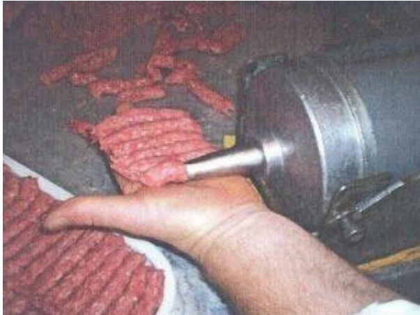
Slika 3. Istiskivanje ćevapčića (prof. dr Ahmed Smajić, 2014.)

U fazi zrenja mesa dolazi do promjena na bjelančevinama i mastima, pri čemu meso postaje mekše, aromatično i bolje zadržava vodu. Zrelo meso je pogodno za preradu. Meso se soli sa 0,2% kuhinjske soli i ostavi da stoji 48 sati. Poželjno je da meso ima oko 15-20% masnog tkiva. Nakon 48 sati zrenja, meso je spremno za mljevenje.