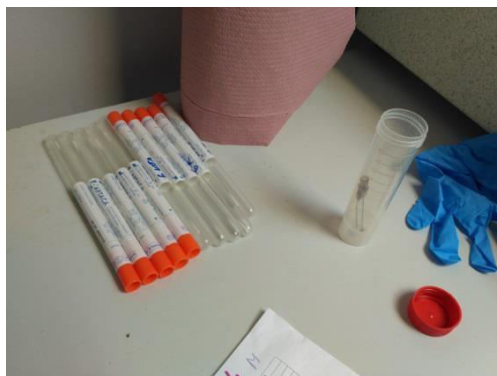
Slika 2. Materijal korišten pri uzorkovanju životinja

U svrhu istraživanja zdravstvenog stanja riječnih kornjača uzeti su obrisci usne šupljine i kloake od šest životinja smještenih u karantenskom prostoru Ustanove Zoološki vrt grada Zagreba nakon zapljene na granici. Kornjačama nije utvrđeno podrijetlo.