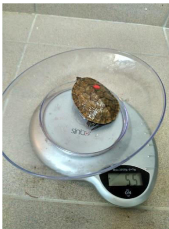
Slika 3. Vaganje kornjače

Nakon manuelnog sputavanja životinje su klinički pregledane inspekcijom i palpacijom vidljivih dijelova tijela na eventualne promjene i mehaničke ozlijede. Sve su životinje izvagane i izmjerene pomičnom mjerkom (Slika 3. i 4.), te je određen spol, ako je to bilo moguće.