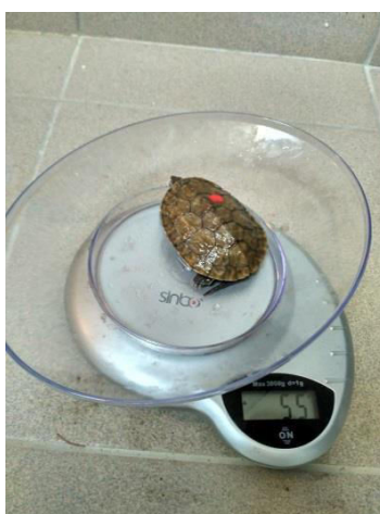
Slika 3. Vaganje kornjače

Nakon manuelnog sputavanja životinje su klinički pregledane inspekcijom i palpacijom vidljivih dijelova tijela na eventualne promjene i mehaničke ozlijede. Sve su životinje izvagane i izmjerene pomičnom mjerkom (Slika 3. i 4.), te je određen spol, ako je to bilo moguće.