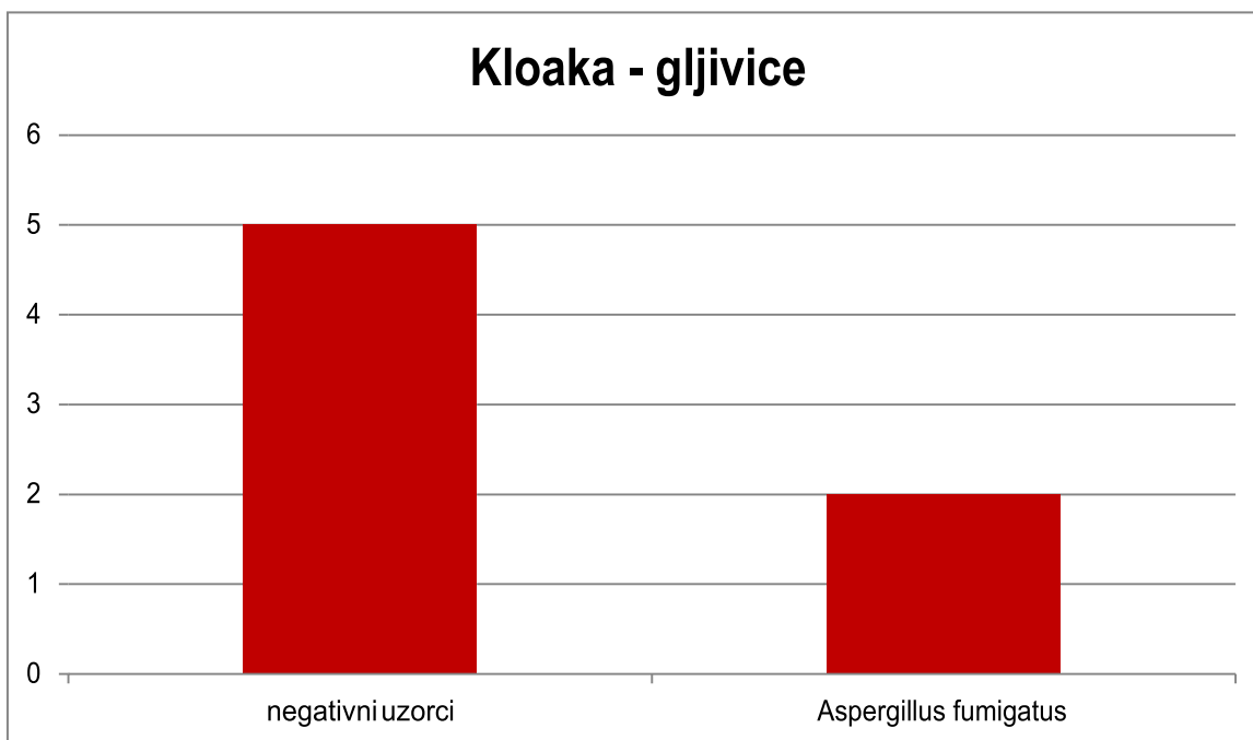
Tablica 3. Zastupljenost gljivica izdvojenih iz kloake riječnih kornjača

Iz usne šupljine riječnih kornjača nije izdvojena niti jedna gljivica. Iz kloake kornjača izdvojena je samo jedna gljivica i to Aspergillus fumigatus u dvije kornjače (Tablica 3.).