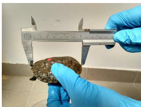
Slika 4. Mjerenje kornjače