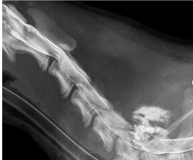
Slika 1. Mijelogramski prikazan segment vratne kralježnice psa (C1 do T1).