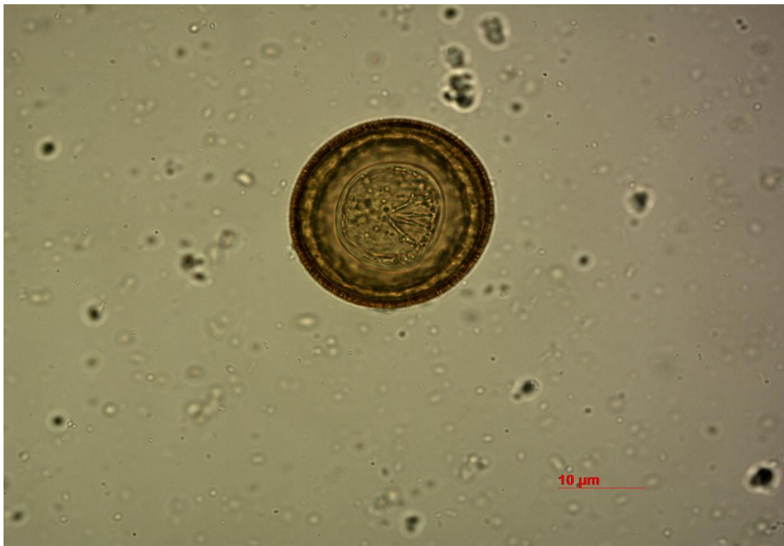
Slika 2. Jajašce trakavica porodice Taenidae („tenidni tip“), povećanje 400x