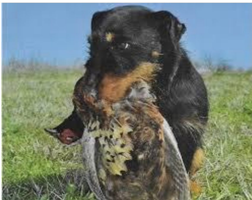
Slika 20. Njemački lovni terijer sa pernatim plijenom

divljač odmah se isključuju iz uzgoja i daljnjeg natjecanja. Primopredaja divljači mora se odvijati tako da pas u sjedećem položaju, isključivo na zapovijed vodiča, ispušta divljač. Za vrijeme ispitivanja ove discipline potrebno je obratiti pozornost na nekoliko stvari, a to su kako pas prihvaća trag, način izrade zavoja, preuzimanje divljači s tla, prisilno donošenje, položaj kod primopredaje divljači te način ispuštanja divljači ( u ruku vodiča ili na tlo).