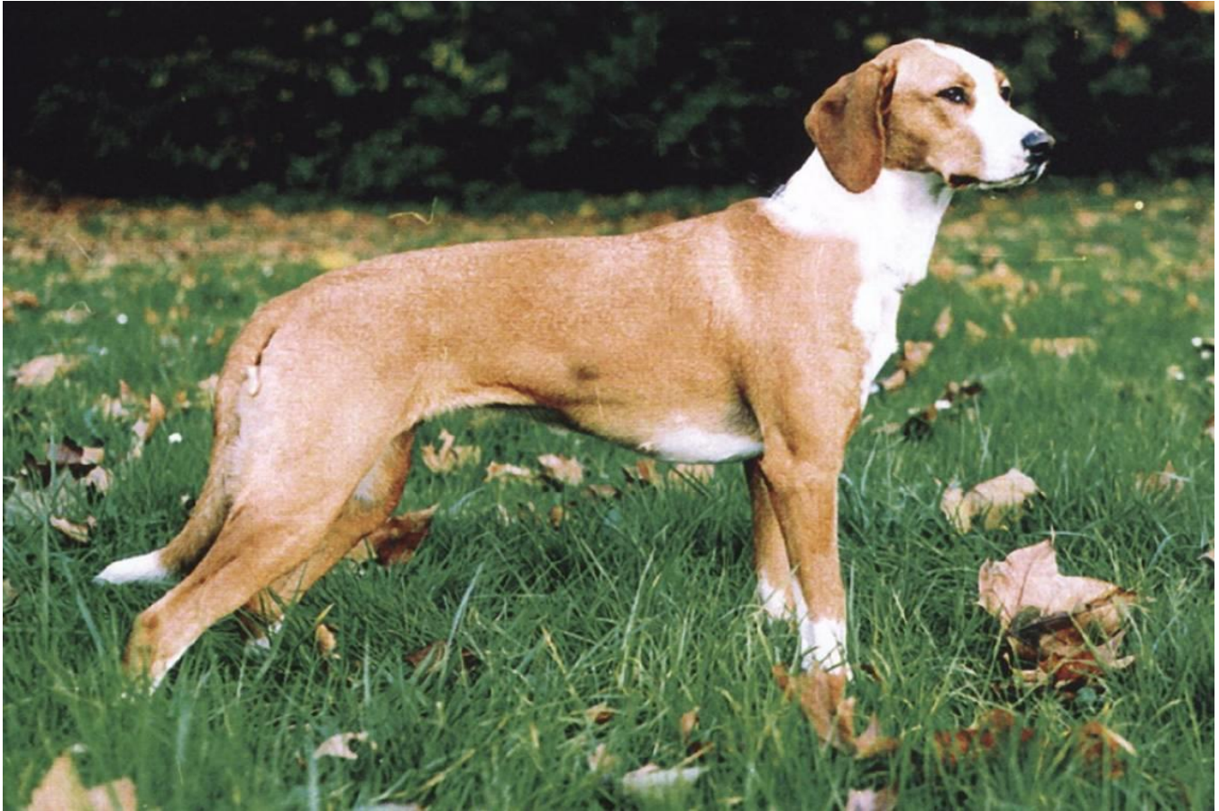
Slika 7. Posavski gonič

Krvosljednici su psi koji svojim njuhom, mirnim temperamentom te izrazitom ustrajnošću pronalaze "odbjeglu" ranjenu divljač a po pronalasku istu hrabro čuvaju do dolaska svog vlasnika.