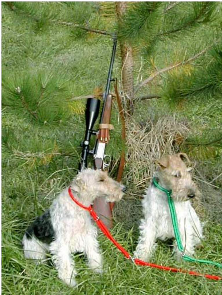
Slika 5. Oštrodlaki foksterijeri nekada su se koristili kao isključivo lovački psi

U tu skupinu spada njemački lovni terijer kao jedan od najsvestranijih lovačkih pasa koji se koristi u radu nad i pod zemljom kao i radu na vodi, te kratkodlaki i oštrodlaki foksterijer koji su ipak mnogo manje zastupljeni kao lovački psi.