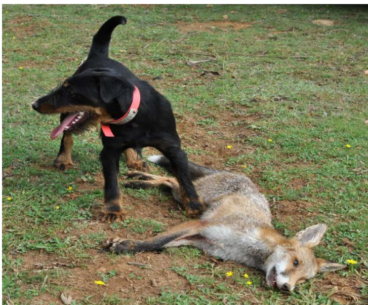
Slika 22. Njemački lovni terijer sa lisicom

Osnovni cilj u stvaranju pasmine pasa jamara je lov na dlakave grabežljivce pod zemljom, a lovni terijeri su svojom građom tijela i visinom prilagođeni upravo tome. Glavna odlika pasa jamara je njihova oštrina na dlakave grabežljivce. S obzirom na zakon o dobrobiti životinja i zabranu direktnog kontakta između psa i lovine, oštrina ovih lovnih terijera se pomalo gubi. Upravo iz tog razloga kinološka organizacija uvela je ispitivanje oštrine u prirodnom lovu jamarenjem. Ispit rada u prirodnom lovu provodi se za vrijeme lovne sezone na sitnu dlakavu divljač. Da bi ispit bio valjan i priznat potrebno je prisustvo najmanje jednog lovno- kinološkog suca. Prilikom pronalaska prirodne jame u kojoj se nalazi odrasla, zdrava lisic pušta se pas te se ocjenjuje njegov rad. Pri tom radu moraju biti nazočni lovno-kinološki sudac, vlasnik psa te još jedan lovac nekog lovnog društva. Sudac mora opisati sastaviti zapisnik u kojem opisuje kompletan rad po ispitnim disciplinama. Opisuje pretraživanje rova, ustrajnost u rovu, glas u rovu i oštrinu. Sve discipline se ocjenjuju ocjenama od 1 do 4 dok se disciplina oštrine ocjenjuje ocjenom oblaživač, držač, istjerivač ili davatelj. Bitno je zabilježiti koliko se dugo pas zadržao u jami. Zapisnik se piše u dva primjerka (zapisnik je u pismenom obliku) te se jedan primjerak dostavlja u HLS a drugi se daje vlasniku psa. U radnu knjižicu se upisuje da je pas položio rad u prirodnom rovu te se mora upisati i ocjena iz ispita oštrine.