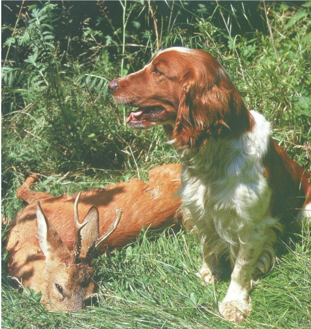
Slika 10. Velški špringer španijel uz srneću divljač

U ovu skupinu pasa spadaju pasmine raznih španijela pa je ponekad i čitava skupina nazivana skupinom španijela. Njihova primarna funkcija je brzopletim pretraživanjem gustiša i močvarnih terena, šunjkanjem, pronaći i podignuti divljač. Ovi psi danas zbog svoje atraktivnosti ali i uvijek vesele i razigrane naravi sve više postaju isključivo kućni ljubimci. S obzirom na reljef te strukturu lovišta ali i način lova u kontinentalnoj Europi nisu toliko popularni kao na tlu Vel. Britanije gdje su i uzgojeni. Zbog svoje pokretljivosti i temperamenta popularni su kod tzv. "vikend" lovaca diljem Europe. To su lovci kojima je pas primarno kućni ljubimac no povremeno vikendom rekreativno, slobodno vrijeme provode u lovištu.