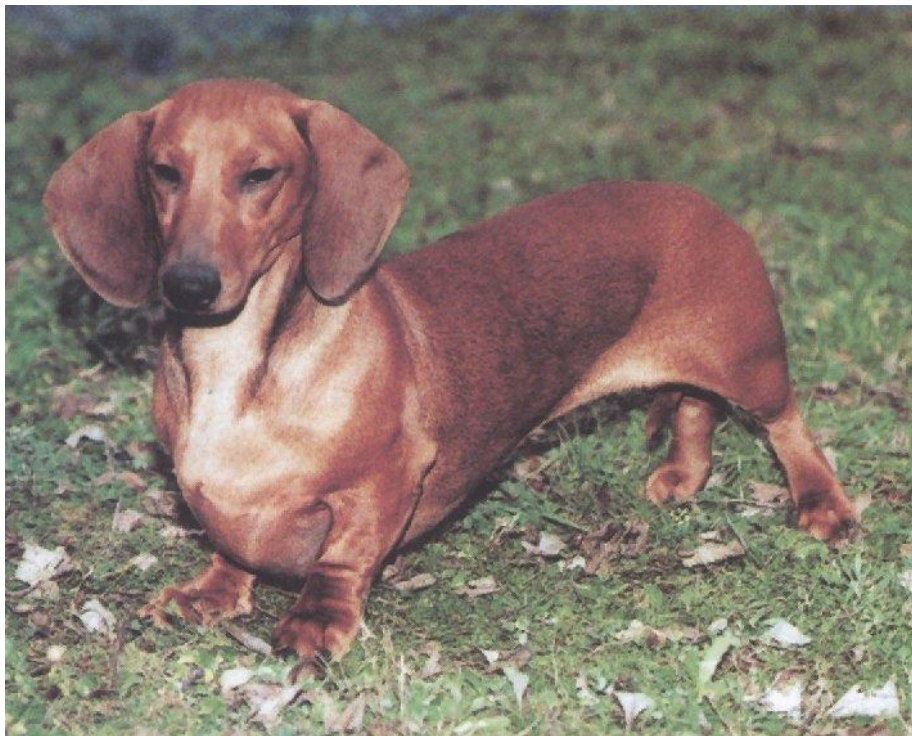
Slika 6. Kratkodlaki jazavčar

Jazavčari su najčešće korišteni u radu pod zemljom ili kao goniči u lovu na divlje svinje a za tu funkciju se posebno ističe oštrodlaki standard jazavčar. Patuljasti jazavčari i kuničari se koriste najviše za lov kunića iako su danas to većinom samo kućni ljubimci.