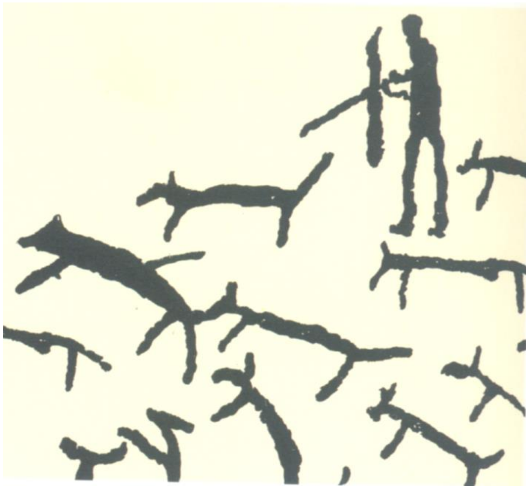
Slika 1. Prikaz lova s psima pronađen u pećinama Andaluzije

Ljudi su kroz povijest razvili mnogo različitih lovačkih strategija, ali jedna je stara koliko i samo čovječanstvo, a to je imati psa kao partnera za lov. Smatra se da su upravo psi bili prve životinje koje su ljudi domestikirali još u vrijeme kad su bili lovci sakupljači, a različite vrste vukova, kojota i šakala su se okupljale oko njihovih logora. Čovjek i pas evoluirali su u tandemu čemu svjedoče brojni crteži na zidovima drevnih špilja.