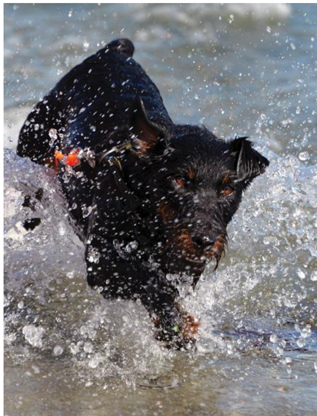
Slika 21. Njemački lovni terijer u vodi

Koeficijent kojim se množe ocjene ove discipline je 3.