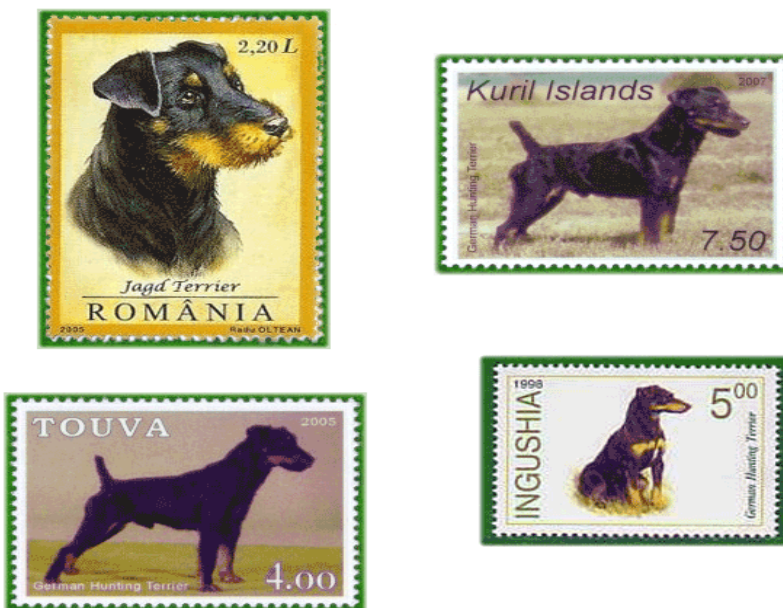
Slika 23. Poštanske marke različitih zemalja sa motivom njemačkog lovnog terijera

Neraskidiva veza između čovjeka i psa traje već tisućama godina i seže od samih početaka njihovog suživota i domestikacije. Pas je svojom inteligencijom, privrženosti i prilagodbom na čovjeka evoluirao od zaštitnika od surove prirode i higijeničara nastambe do pomoćnika u raznovrsnim aktivnostima i emocionalne podrške u obliku kućnog ljubimca. Tijekom duge povijesti suživota čovjeka i psa razvio se i odnos partnera u lovu, nešto bez čega bi današnji način lova bio gotovo nezamisliv. Danas postoje stotine različitih pasmina koje su oblikovali upravo ljudi selektivnim uzgojem koji ima za cilj očuvanje poželjnih karakteristika i osobina za ispunjenje određenu uloge i svrhe. Postoje i brojne pasmine lovačkih pasa koje su se razvile ovisno o vrsti plijena i terena na kojem se odvija lov. Čovjek je oduvijek imao potrebu za napretkom i usavršavanjem pa je tako do danas razvio cijeli sustav metoda ispitivanja i ocjenjivanja lovnih karakteristika pasa koje imaju za cilj otkrivanje najboljih predstavnika pasmine i osiguravanje njihovog potomstva. Njemački lovni terijer upravo je primjer jedne takve pasmine koja je nastala entuzijazmom nekolicine strastvenih lovaca i kinologa. Oni su željeli ispoljiti najbolje lovačke osobine u jednoj pasmini i dobiti svestranog psa sa staloženim, čvrstim karakterom, upornošću i izraženim nagonom. To im je naposljetku i uspjelo pa je tako danas njemački lovni terijer jedna od popularnijih lovačkih pasmina na svijetu.