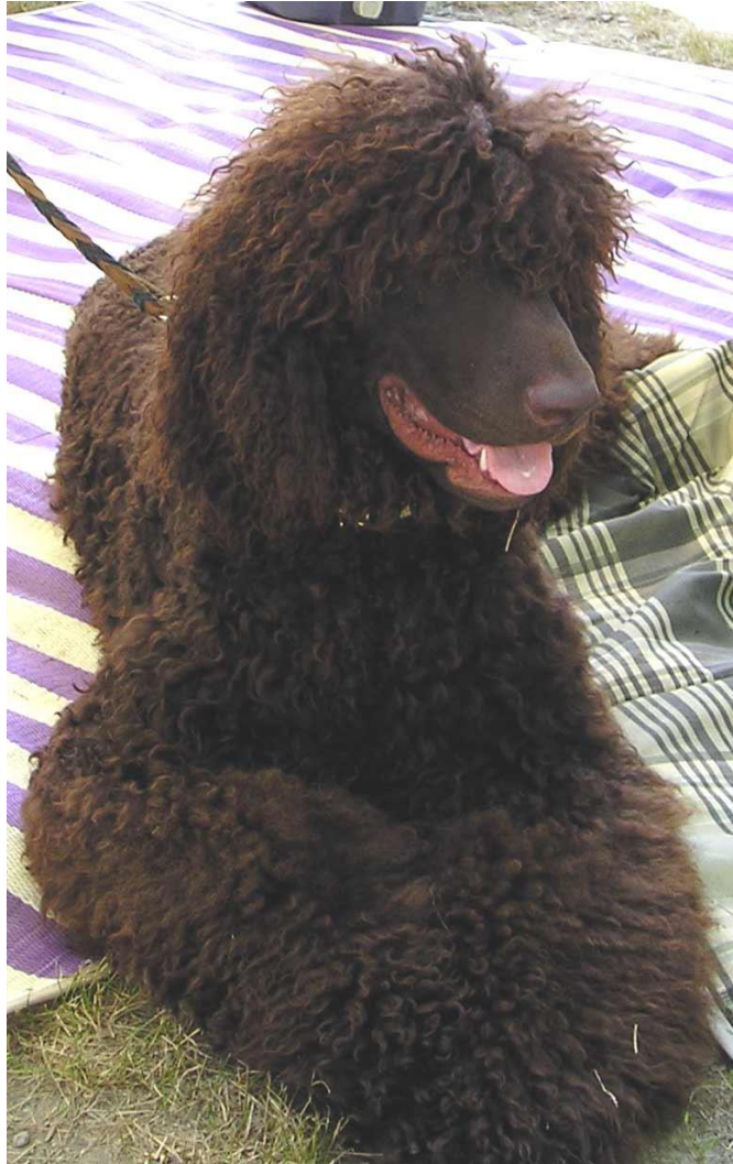
Slika 11. Irski španijel za vodu

Ova pasmina nastala je u 19. stoljeću križanjem pudla i irskog setera. Jedna je od najstarijih pasmina španijela, a slike pasa koji im nalikuju mogu se pronaći u spisima starijim od tisuću godina. Neka istraživanja tvrde da je on predak svih španijela. Vrlo su poslušni i inteligentni, izvrsni vodeni psi, posebno prikladni za lov pataka po močvarama i jezerima. Nekada su bili treći na listi najpopularnijih sportskih pasa, ali danas su nažalost izgubili na popularnosti. Unatoč tome, ovo su izvrsni kućni ljubimci, dobri su s djecom, bistri, razigrani i privrženi sa izraženom željom za ugađanjem čovjeku.