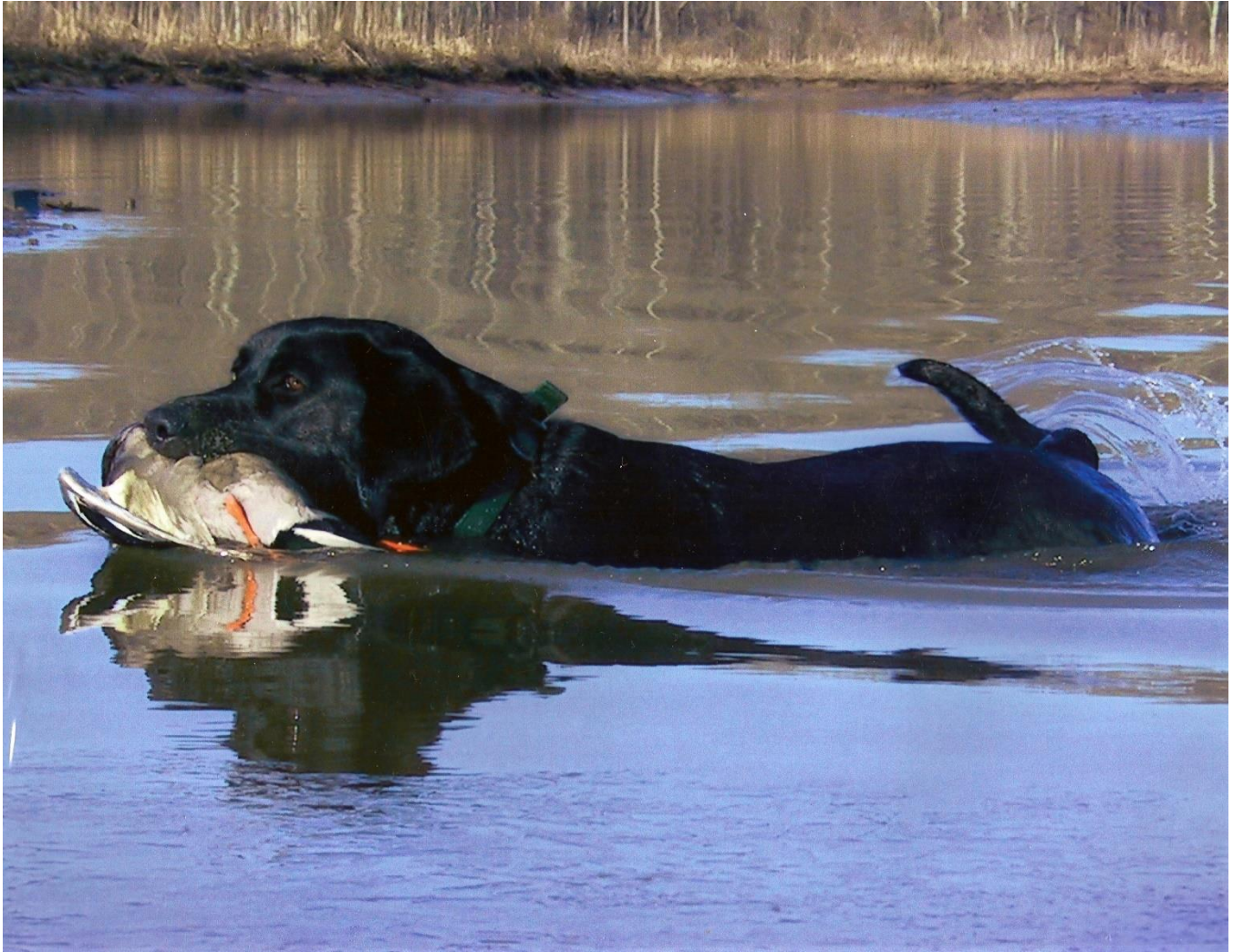
Slika 9. Crni labrador ravne dlake donosi divljač iz vode (Izvor: Arhiva Zavoda)

Zbog svoje izrazito blage naravi ovi psi su poznati u Europi kao kućni ljubimci, psi za pratnju ili pak službeni psi. U lovištima kontinentalne Europe funkciju donosača još uvijek primarno u najvećem broju obavljaju ptičari dok se labradori kao lovački psi ne koriste toliko iako podliježu lovačkim ispitima te kao takvi mogu sudjelovati u lov.