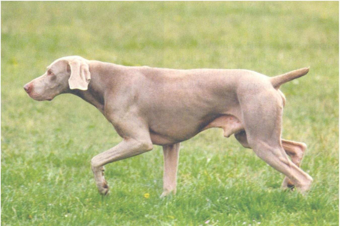
Slika 8. Vajmarski ptičar

Zadaća ptičara je izrazito razvijenim osjetom njuha pronaći pernatu divljač skrivenu u raslinju te stajanjem pokazivati (markirati) gdje se ista nalazi dok se lovac ne pripremi na pucanj. Nakon odstrela većina ptičara izvršava i donošenje lovine odnosno aport.