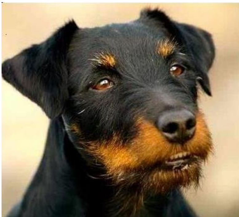
Slika 12. Pravilan izgled glave njemačkog lovačkog terijera

usnoj šupljini se nalaze veliki zubi, vilice su veoma snažne s izrazito pravilnim i potpuno škarastim zubalom gdje gornji sjekutići preklapaju donje. u vilici zubi stoje okomito te ih 42. Oči su tamno smeđe ( bademaste), male, ovalne, dobro i duboko usađene. Uši kod Njemačkih lovnih terijera su lagano prilegnute, preklopljene, visoko nasađene u obliku slova V. Vrat je veoma snažan, ne predug s naglašenim prijelazom u plećke.