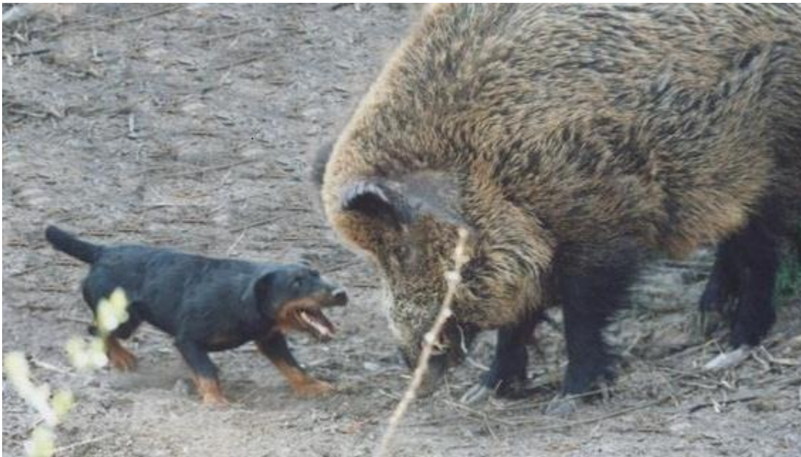
Slika 13. Njemački lovni terijeru napadu na divlju svinju

Svrha ispita njemačkih lovnih terijera je prije svega utvrđivanje lovačkih prirodnih osobina pasa jamara i dokazivanje njegove upotrebljivosti u lovu. Potrebna je naznaka o utvrđenim prirodnim osobinama. Psi jamari su uzgojeni za lov, a lovac od njih očekuje čvrst karakter i ustrajnost pri lovu. Očekuje osjetljivost njuha i sigurnost na tragu ranjene divljači te glasan lov na svježem tragu. Pri svim tim karakteristikama potrebno je da bude poslušan pratilac u lovu.