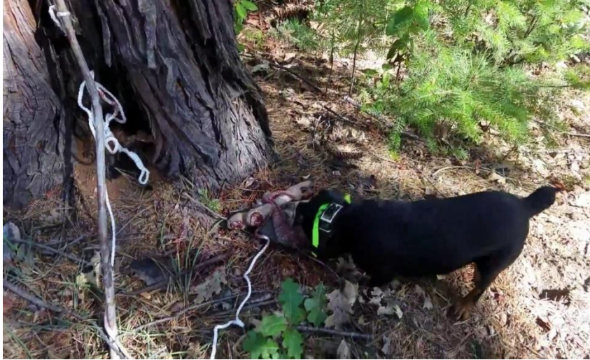
Slika 19. Njemački lovni terijer na tragu jelana

Provođenje ovog ispita radi se tako da se trag postavlja u visokoj šumi u kojoj treba i smije biti toliko podrasta da omogući kretanje lovcu i pomoćniku. Mjesto nastrela smije biti 100 metara izvan šume, a umjetni krvni trag treba biti dug oko 600 metara s krvi divljači i položenom divljači na kraju traga. Divljač koja se koristi mora biti netom odstrijeljena ili dan ranije, ali se tada treba izvaditi utroba i sašiti mjesto otvaranja. Za ovaj spit nije dozvoljeno korištenje smrznute divljači. Krvni trag se na teren postavlja dan ranije, ako je moguće 24 sata no 18 se tolerira. Tri decilitra krvi, koja mora biti od one divljači koja se nalazi na kraju traga, suci postavljaju na teren na jedan od tri načina. Prskanjem iz boce, sa spužvicom na dugom štapu, sa specijalnim cipelama na kojima se postavljani distalni završetci nogu papkaste divljači i specijalnom štrcaljkom koja kod svakog koraka ostavlja određenu količinu krvi. Trag se uglavnom postavlja u dvije okuke pod tupim kutem, ako je to nemoguće mogu se postaviti i u obliku obrnutog slova "U". Udaljenost između dva traga mora biti minimalni 150 metara. Krvni trag postavlja isključivo sudac ili suci koji će suditi na ovom ispitu, razmišljajući o dominantnim vjetrovima. Rad na krvnom tragu se može ispitivati s odvezanim ili vezanim psom.