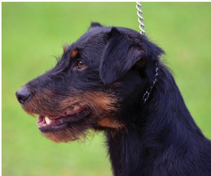
Slika 18. Njemački lovni terijer na povodniku