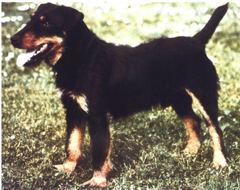
Slika 4. Njemački lovni terijer u svojoj karakterističnoj pozi

Beskompromisno isključivanje pasa koji nisu ispunili željene kriterije nastavljeno se i u sljedećim godinama. U uzgajivačkoj knjizi iz 1941. godine registrirano je preko 3 000 pasa. U razdoblju nakon Drugog svjetskog rata došlo je do stagnacije, ali se nastavilo s radom. Klub je službeno ponovno počeo s radom 1947. godine, a širenjem pasmine njemačkog lovnog terijera diljem svijeta, počeli su se osnivati matični klubovi u drugim zemljama.