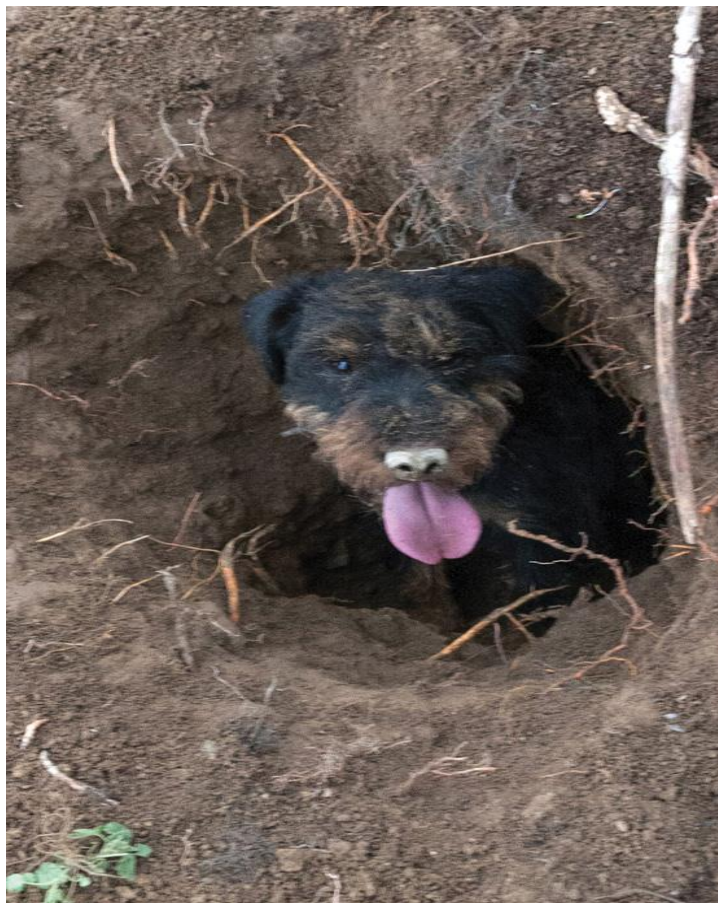
Slika 15. Njemački lovni terijer u rovu