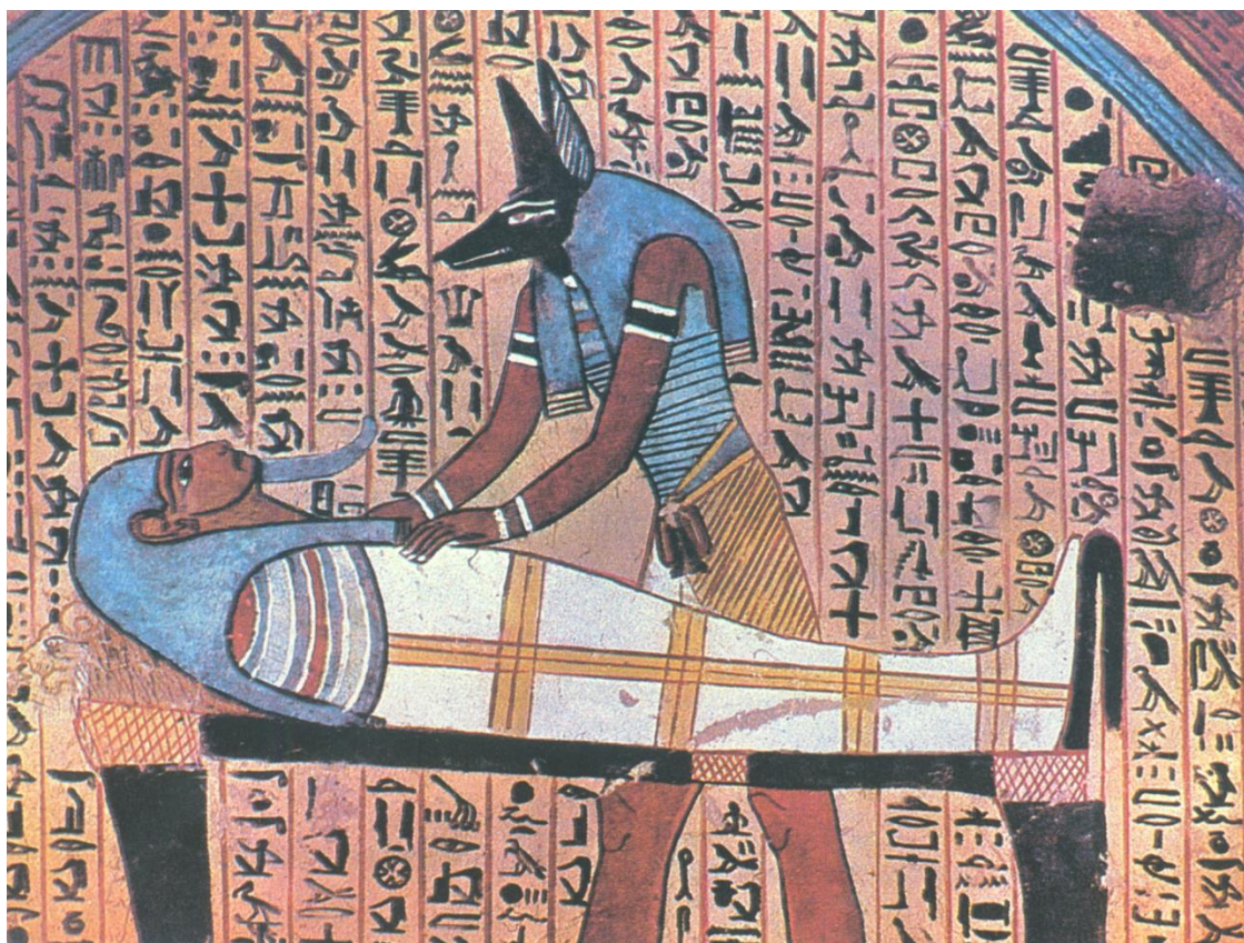
Slika 2. U drevnom Egiptu psi su prikazivani kao čuvari podzemnog svijeta

Dokazi pronađeni u iskopinama diljem svijeta upućuju na to da su ljudi već tada instinktivno koristili pse za različite uloge, kao čuvare, partnere u lovu, za izvlačenje predmeta ili plijena, ovisno o osobinama i predispozicijama svake pojedine životinje. Selektivan, ciljani uzgoj pasa, prema arheološkim istraživanjima, najvjerojatnije se pojavio prije devet tisuća godina kada su se počeli javljati i prvi pastiri. Tada su ljudi počeli svjesno intervenirati u pseću populaciju te za daljnji uzgoj birati jedinke s karakteristikama koje su željeli imati i u slijedećoj generaciji. Upravo takvim načinom evolucije psi su danas jedna od najraznovrsnijih vrsta na svijetu sa službenom listom registriranih i velikim brojem divljih i izoliranih pasmina.