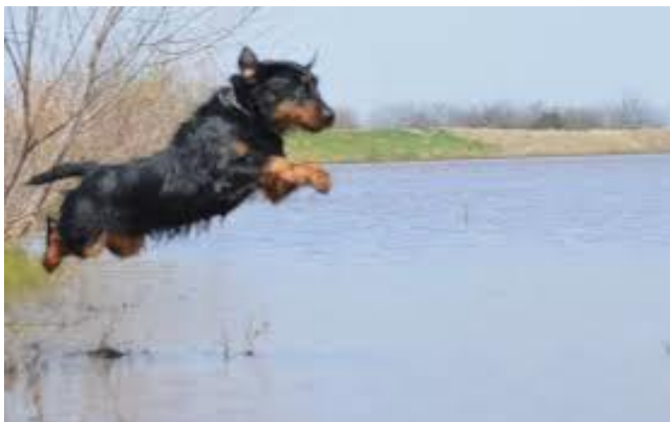
Slika 17. Njemački lovni terijer u akciji na vodi