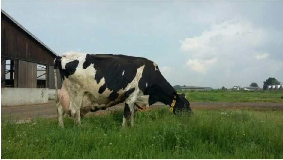
Slika 2. Holštajnsko-frizijsko govedo