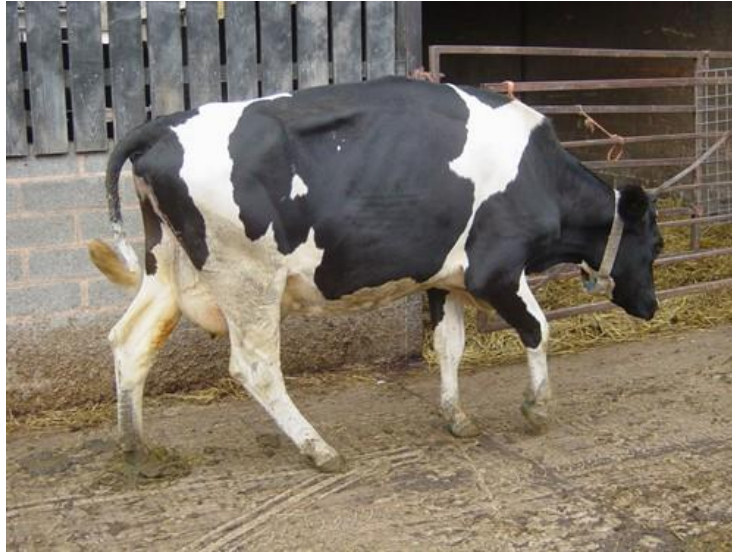
Slika 9. Hromost.

Površine staza nasteljene organskim materijalom, poput borovih strugotina ili slame, moraju se dosteljavati najmanje dva puta godišnje, kamene staze u područjima s velikom količinom padalina obnavljati svake dvije do četiri godine, dok tvrdi kamen stabiliziran cementom traje i dulje. Betonske staze često traju dugi niz godina (Green, 2012.).