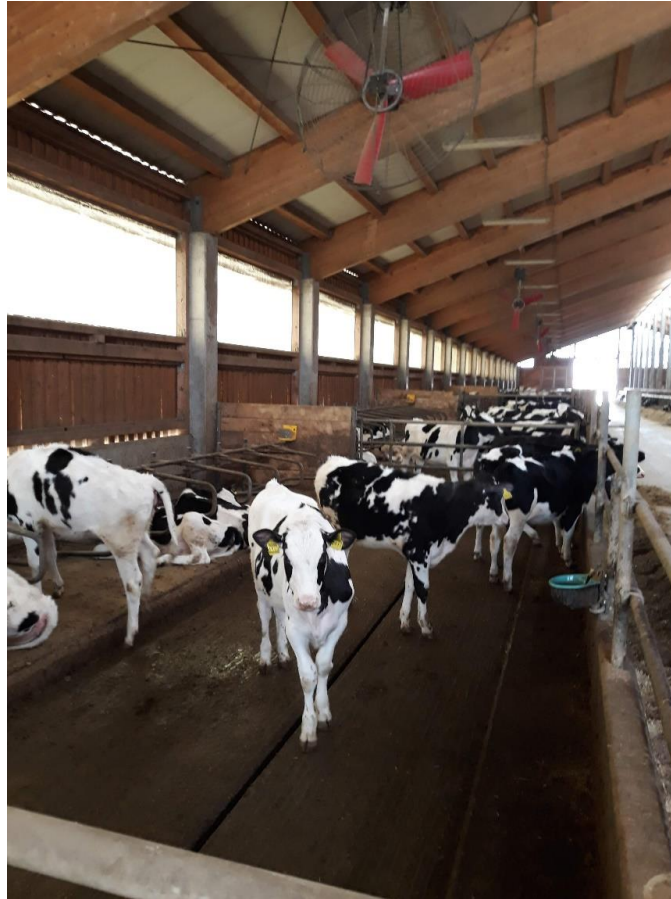
Slika 2. Slobodni način držanja krava.

Nedostaci ovog načina držanja proizlaze iz otežane kontrole krava, potrebe za uspostavljanjem hijerarhijskog poretka i agresije među kravama (Obradović i sur., 2006.), a uglavnom nije ni primjenjiv u stadima s manje od deset krava.