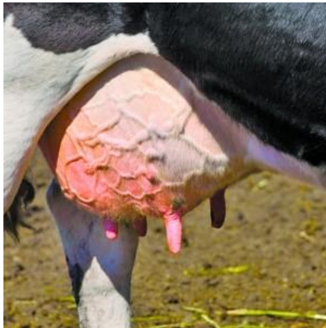
Slika 8. Mastitis.

Program praćenja mastitisa te korišteni indeksi olakšavaju praćenje i mjerenje ishoda bolesti. Od ključne je važnosti da metode za praćenje omoguće stočaru ili doktoru veterinarske medicine – savjetniku za zdravlje stada, bolje razumijevanje pojave mastitisa. Također je nužno definirati točku (razinu alarma) na kojoj je potrebna intervencija. Za suzbijanje mastitisa potrebno je poduzeti mjere za smanjivanje infekcije i povećati otpornost krava (dobar smještaj, hranidba, higijena).