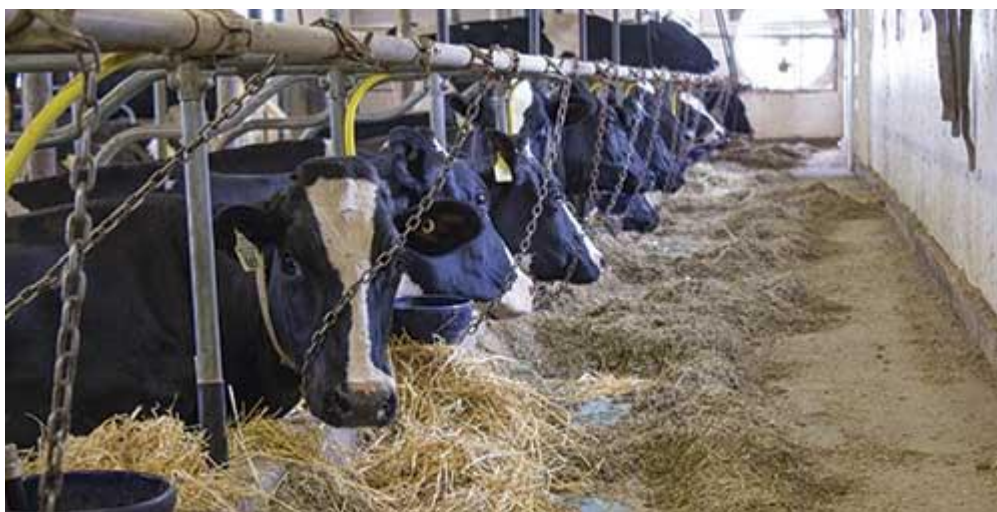
Slika 1. Držanje krava na vezu.

Nedostaci ovog načina držanja su: otežano prozračivanje i slabija osvjetljenost, što može izazvati poremećaje u reprodukciji, zatim učestalije ozljede i upale vimena, bolesti ekstremiteta, izvale rodnice i maternice, teška teljenja, smanjenje opće otpornosti i podložnost sekundarnim infekcijama te slabije društvene interakcije među kravama. Mužnja je na ležištu sporija, higijenska kvaliteta mlijeka je lošija, a utrošak rada znatno veći. Krave slabije jedu, a proizvodni vijek im je kraći u usporedbi sa slobodnim načinom držanja (Matković, 2008.; Ostović i sur., 2008.).