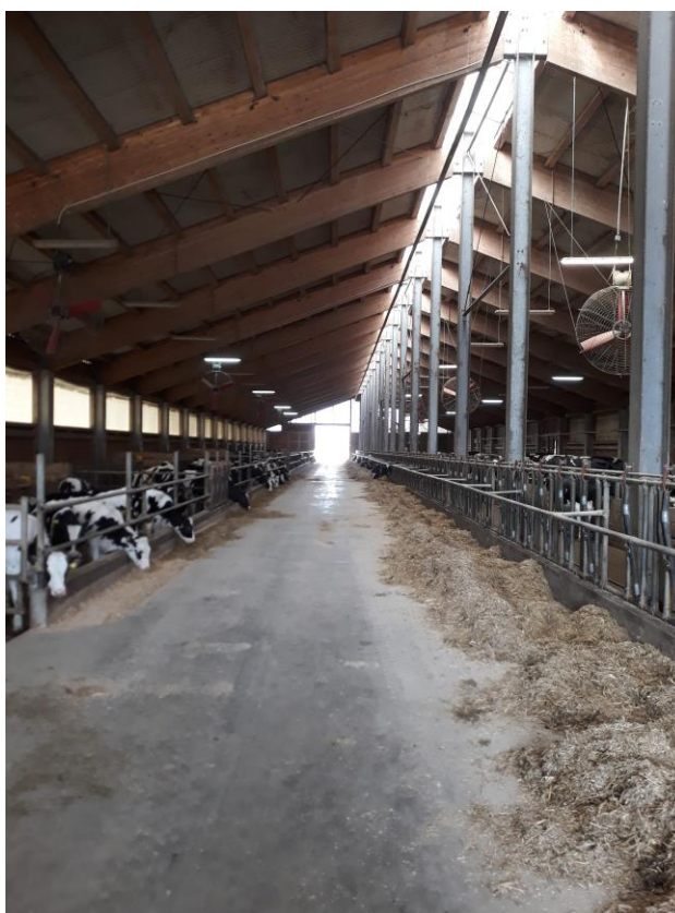
Slika 3. Staja s vanjskom klimom.

U podnebljima s dugim zimama krave provode znatan dio godine u stajama i one moraju pružiti životinjama zaštitu od hladnih uvjeta, dok se pašnjaci ili drugi vanjski prostori koriste tijekom blažeg dijela godine. U toplijim područjima gdje temperature smrzavanja i snijeg nisu problem, krave je moguće čak tijekom cijele godine držati na otvorenom. Broj krava na farmi također može utjecati na vrstu nastambe u kojoj se drže, osobito u hladnijim podnebljima (Radostits, 2001.).