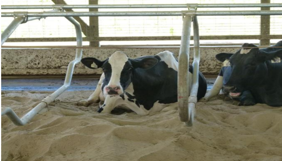
Slika 7. Čisto, suho i udobno ležište, s pijeskom kao steljom.