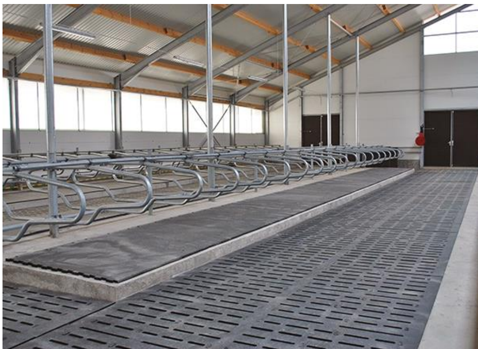
Slika 4. Ležišta za krave obložena gumenim oblogama.