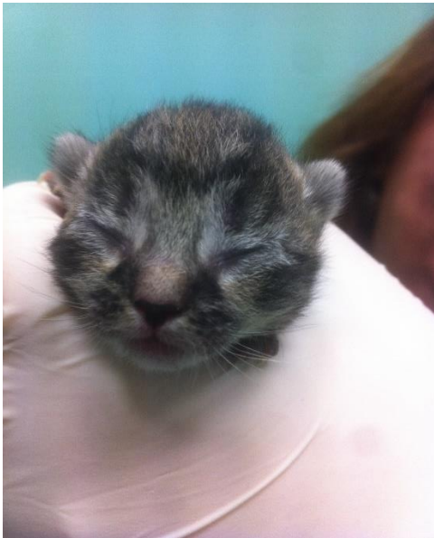
Slika 1. Mačić sa zatvorenim očima po rođenju, izvor: izv. prof. dr. sc. Mirna Brkljačić, Klinika za unutarnje bolesti.

Štenci i mačići ne mogu stajati pri rođenju, ali svakako bi trebali imati mogućnost korištenja ekstremiteta za puzanje. Nakon desetak dana trebali bi početi lagano stajati, a većina ih prohoda nakon 3 tjedna. Nadalje, rađaju sa zatvorenim očima (slika 1.). Odvajanje gornjih od donjih kapaka te otvaranje očiju javlja se za 10-14 dana. U tom stadiju rožnica može biti blago zamućena, a zamućenje nestaje za otprilike 4 tjedna. Prvih nekoliko tjedana majka će se pobrinuti za svoje potomstvo na način da im osigura čistu i suhu okolinu. Uobičajeno je da ona liže perinealnu regiju svakog novorođenčeta prva 2-3 tjedna kako bi potaknula uriniranje i defekaciju (KING i BOAG, 2018.).