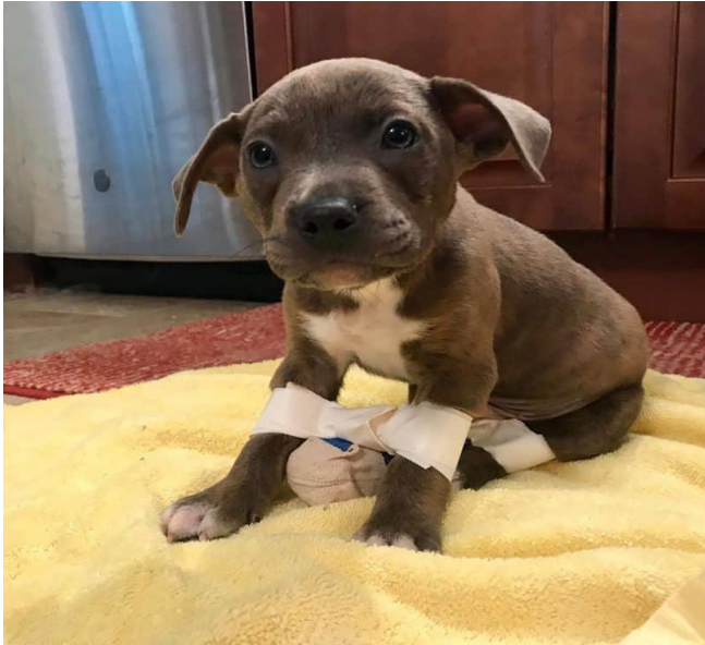
Slika 4. Povijanje plivajućeg štenca, izvor:

https://animalso.com/wp-content/uploads/2019/08/Swimmer-Puppy-Syndrome-2-809x809.jpg , Posjećeno: 25.10.2020.