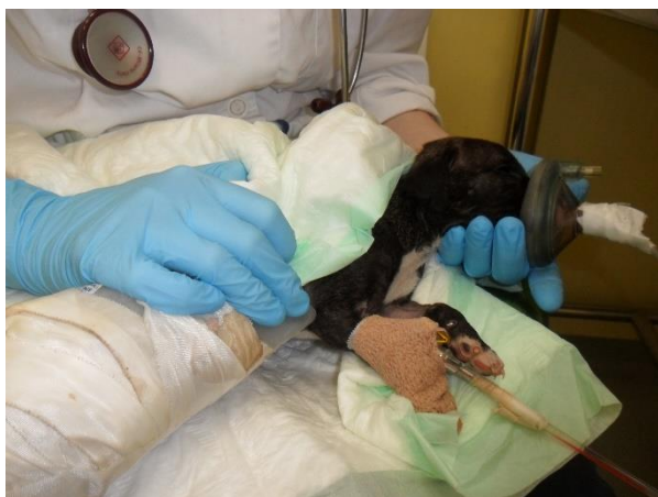
Slika 2. Maska s kisikom, izvor: izv. prof. dr. sc. Mirna Brkljačić, Klinika za unutarnje bolesti.

pokretljivosti crijeva, što pak rezultira kolapsom cirkulacije i uginućem. Smanjen puls i pad krvnog tlaka čest su nalaz kod hipoksične novorođenčadi te im je potrebna neposredna skrb (ENGLAND i VON HEIMENDAHL, 2010.). Terapija uključuje nadoknadu kisika putem kaveza sa kisikom, maske (Slika 2.), endotrahealnog tubusa ili inkubatora, nježno trljanje novorođenčeta (također može pomoći u poticanju disanja) dok su trešnja ili udaranje kontraindicirani (MCMICHAEL, 2014.).