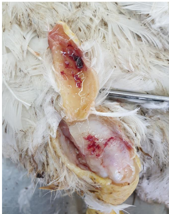
Slika 1. Patomorfološke promjene s karakteristikama virusnog artritisa-tenosinovitisa na području tarzo-metatarzalnog zgloba

Tijekom prijema i uzgoja pilića roditeljskog jata praćeno je zdravstveno stanje. Nije zamijećeno prisustvo kržljivosti niti raslojavanja jata, osim uobičajenih sporadičnih gubitaka uslijed retencije žutanjčane vrećice i sl. U 14. tjednu kod prethodnog kao i ovog jata javljaju se znakovi šepavosti te su uginuća poslana na razudbu. Na razudbi su utvrđene opsežne promjene u vidu otečenja tetivnih ovojnica i zglobnih membrana, pojačane prokrvljenosti te obilja žučkaste tekućine do gnojnog sadržaja između tetiva i mišića (Slika 1).