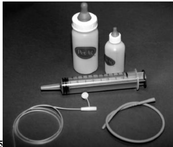
Slika 2. Razne bočice i sonde za hranjenje mogu se koristiti prilikom ručnog hranjenja štenadi.

Štenad koja je slaba ili nije u stanju sisati, bi trebala biti hranjena putem sonde (DEBRAEKELEER i sur., 2010a.). Za hranjenje putem sonde mogu se koristiti sonde za hranjenje dojenčadi, mekani uretralni ili intravenski kateteri (Slika 2.) (DEBRAEKELEER i sur., 2010a.).