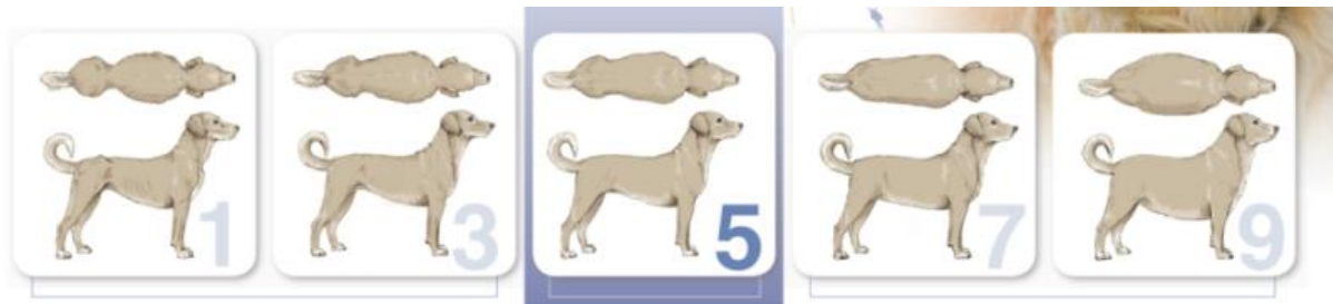
Slika 3. BCS; Prikaz ocjene tjelesne kondicije pasa primjenjujući bodovnu skalu od 1 do 9 (WSAVA, 2013).

Kondiciju je potrebno procjenjivati svaka dva tjedna. Važno je napomenuti da ju je potrebno pratiti, ali s oprezom, jer je skala za procjenu kondicije validirana za životinje u odrasloj dobi, a ne za štenad. Navedeno je od izuzetne važnosti poglavito u eksponencijalnoj (brzoj) fazi rasta kada je vrlo lako podcijeniti ocjenu kondicije, poglavito kod gigantskih pasmina pasa kod kojih je ta faza izraženija. Cilj je postići umjereni intenzitet rasta, a ne maksimalni kako bi se izbjegle nepoželjne posljedice poput patologija koštanog sustava i prekomjerne tjelesne težine. Ciljna masa u odrasloj dobi neće ovisiti o intenzitetu rasta.