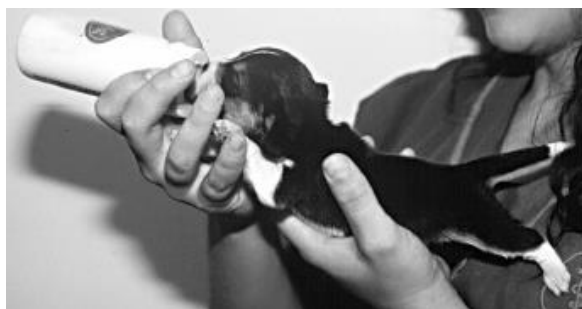
Slika 1. Optimalan položaj šteneta tijekom hranjenja.