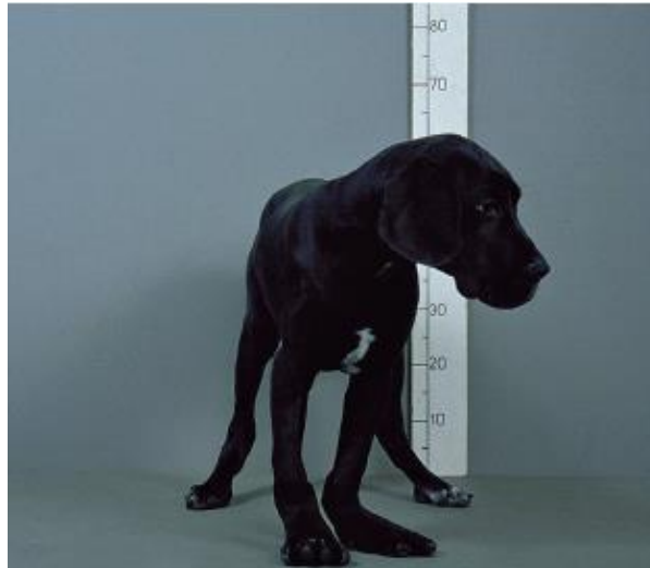
Slika 6. Njemačka doga stara 4 mj, sa sindromom zakrivljenog radijusa, hranjena hranom sa viškom kalcija.

Kronična intoksikacija vitaminom D zbog ingestije otrova za štakore ili zbog prekomjernih doza vitamina D ili njegovih metabolita, rezultira hiperkalcemijom i kalcifikacijom mekih tkiva, hiperfosfatemijom, mišićnom slabošću, mučninom, otkazivanjem bubrega, i smrtnim ishodom (HAZEWINKEL, 2012.).