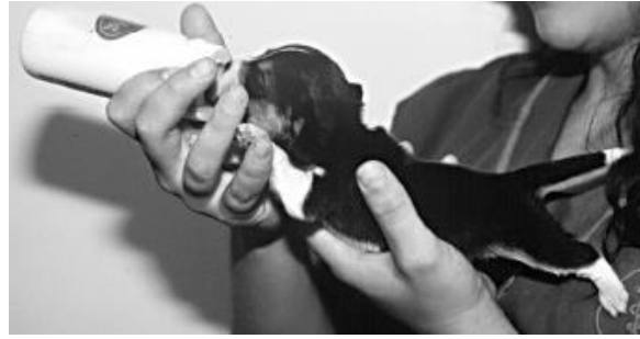
Slika 1. Optimalan položaj šteneta tijekom hranjenja.