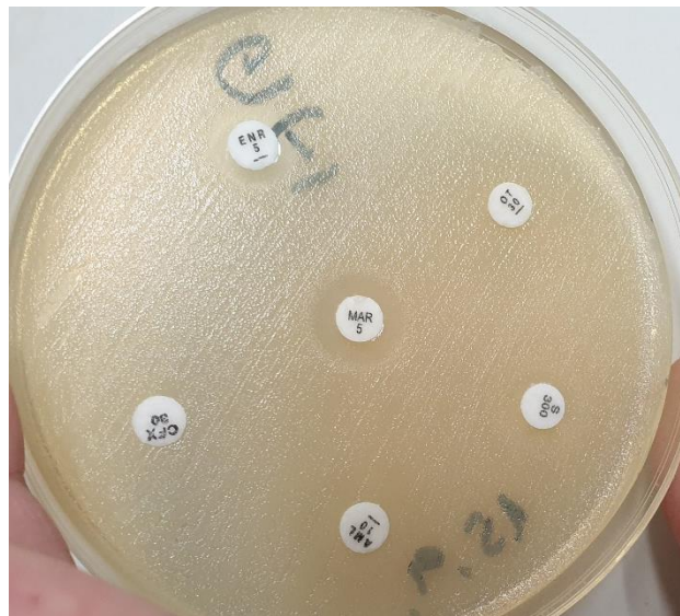
Slika 4. Disk difuzijski postupak, E. faecalis (izolat br. 2.)