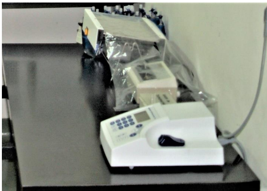
Slika 2. Spektrofotometar (Zavod za anatomiju, histologiju i embriologiju Veterinarskog fakulteta Sveučilišta u Zagrebu).