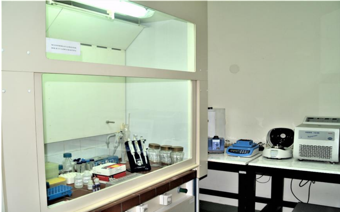
Slika 1. Laboratorij za izdvajanje DNK i RNK (Zavod za anatomiju, histologiju i embriologiju Veterinarskog fakulteta Sveučilišta u Zagrebu).

tvrdim staničnim membranama i više fibrinoznog tkiva. Ovaj protokol je, prema autorima, brz, jednostavan i jeftin u smislu reagensa, te mu je glavna prednost što ne koristi fenol (BIASE i sur., 2002.).