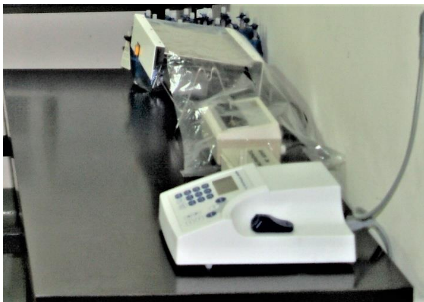
Slika 2. Spektrofotometar (Zavod za anatomiju, histologiju i embriologiju Veterinarskog fakulteta Sveučilišta u Zagrebu).