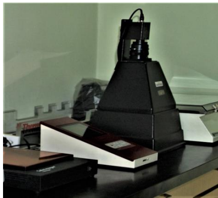
Slika 4. Trasiluminator za vizualizaciju i slikanje produkata DNK elektroforeze u gelu (Zavod za anatomiju, histologiju i embriologiju Veterinarskog fakulteta Sveučilišta u Zagrebu).