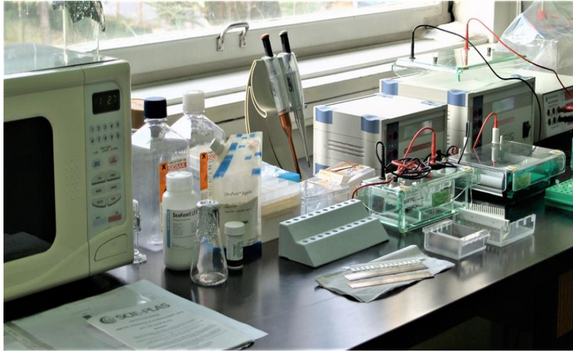
Slika 3. Laboratorijska oprema za DNK elektroforezu (Zavod za anatomiju, histologiju i embriologiju Veterinarskog fakulteta Sveučilišta u Zagrebu).