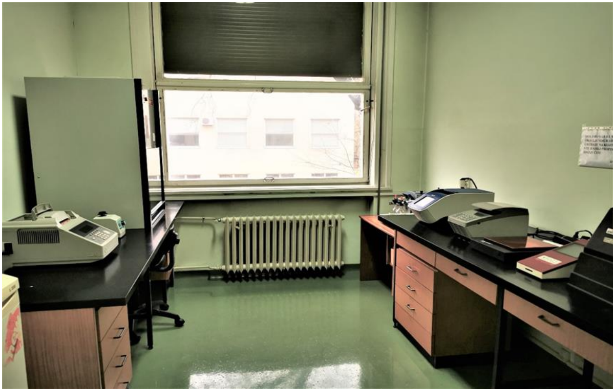
Slika 5. Laboratorij za pripremu PCR reakcije, pohranu kemikalija i PCR produkata te pohranjivanje i dokumentiranje gelova (Zavod za anatomiju, histologiju i embriologiju Veterinarskog fakulteta Sveučilišta u Zagrebu).

qPCR ima veliku vrijednost u mjerenju genske ekspresije pojedinih tkiva u raznim razvojnim fazama. Genska ekspresija nekog gena je mjerljiva brojem mRNK koje nastanu transkripcijom. Te mRNK se reverznom transkriptazom prevedu u komplementarne DNK čija se amplifikacija onda može izmjeriti. Povećanje ekspresije gena koji se proučava se uspoređi sa ekspresijom nekog gena koja je uvijek ista ( house-keeping genes ). Pri uporabi komercijalnih kompleta za identifikaciju jedinke/vrste preporučljivo je napraviti kvantitativnu analizu izolata DNK. Ispad alela i nejednakost alela uočeni su kada je početna količina DNK bila manja od 50 pg, no i prevelika količina DNK može stvarati probleme pri analizi. Najčešće se upotrebljava TaqMan® proba za MC1R gen ( Melanocortin-1 Receptor, kodiran jezgrinim genomom), a druga za regiju SINE ( short interspersed element , dio mtDNK) uz SYBR® Green 1 boju. Kvantifikacija je potrebna radi optimizacije uvjeta lančane reakcije polimerazom, multiplex PCR-a i stoga što komercijalni kompleti najbolje funkcioniraju u uskom rasponu koncentracije DNK (Slika 5.).