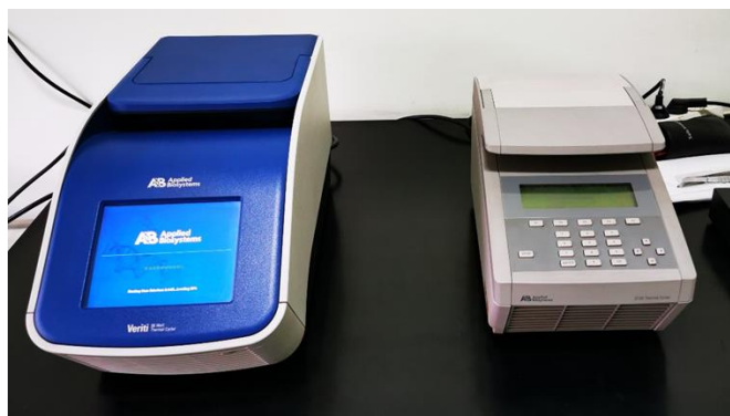
Slika 6. PCR uređaj u Laboratoriju za molekularnu dijagnostiku (Zavod za anatomiju, histologiju i embriologiju Veterinarskog fakulteta Sveučilišta u Zagrebu).