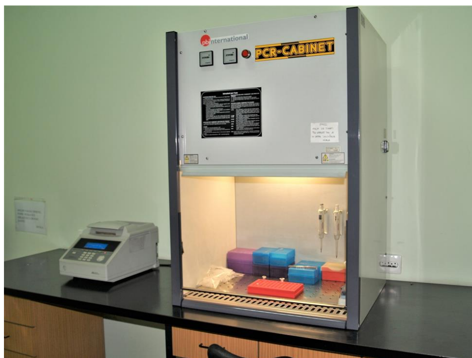
Slika 7. PCR kabinet i PCR uređaj (Zavod za anatomiju, histologiju i embriologiju Veterinarskog fakulteta Sveučilišta u Zagrebu).

PCR omogućuje umnažanje ciljanog fragmenta DNK iz genomske DNK koji će se dalje koristiti kao hibridizacijske sonde u northern i southern blottingu i DNK kloniranju. Primjenjuje se u dijagnozi genetskih bolesti, tipiziranju tkiva pri transplataciji, ranoj dijagnostici malignih bolesti, brzom i specifičnoj dijagnostici zaraznih bolesti, naročito onima uzrokovanim spororastućim uzročnicima. U forenzici, omogućuje točno povezivanje osumnjičenika s mjestom zločina, oslobađanje krivo optuženih iz ranijih slučajeva i brzu eliminaciju puno potencijalnih osumnjičenika. Životinjska DNK služi kao dokaz kada je životinja svjedok (povezivanje osumnjičenog i žrtve ili osumnjičenog i mjesta zločina), žrtva ili počinitelj (napad na čovjeka) (PRIMORAC i sur., 2008.). Filogenetska istraživanja potpomognuta PCR-om uključuju analizu neandertalske DNK iz pronađenih kostiju, DNK iz tkiva mamuta i mozga mumija. Još jedna uobičajena primjena PCR-a omogućuje procjenu genske ekspresije pojedinih tkiva. Moguće je također ciljano kreirati mutacije gena kako bi se proučavala funkcija proteina.