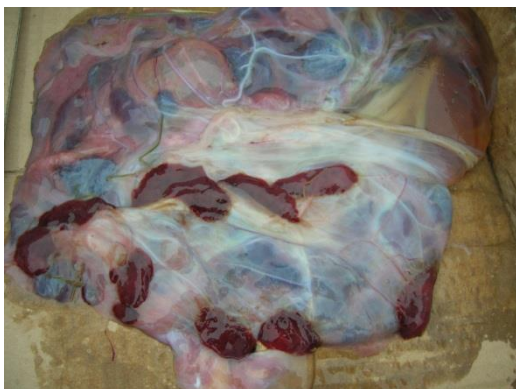
Slika 2. Posteljica koze

Puerperij je razdoblje od završetka porođaja (istiskivanja plodnih mjehura, ploda i posteljice) do kraja involucije maternice i uspostave ciklične aktivnosti jajnika. Promjene na spolnim organima za vrijeme puerperija sastoje se od involucije maternice i povratka cikličke aktivnosti jajnika (SAMARDŽIJA i sur., 2010.). Pod kontrolom hormona odvija se priprema za porođaj spolnih organa (prokvašenje, otvaranje i proširenje porođajnog kanala, početak kontrakcija miometrija), ali i priprema za sintezu i ekskreciju mlijeka, odnosno početak laktacije (SAMARDŽIJA i sur., 2010.). Porođaj je fiziološki završetak gravidnosti kada razvijeni, zreli plod kroz porođajni kanal napušta organizam majke kako bi u vanjskom svijetu nastavio ekstrauterini razvoj. Da bi se organizam majke pripremio za porođaj odigrava se cijeli niz promjena odnosa razina hormona. Nakon završetka drugog stadija i istiskivanja plod(ov)a, kontrakcije abdomena prestaju ili su vrlo slabe, a smanjuje se pravilnost i učestalost kontrakcija miometrija. Rodilje i dalje tiskaju samo ukoliko u porođajnom kanalu ima patoloških promjena (ozljede, upale, izvala maternice i dr.). Kontrakcije miometrija poslije samog porođaja ( dolores post partum ) su vrlo značajne za odvajanje posteljice (Slika 2.) i njezino istiskivanje.