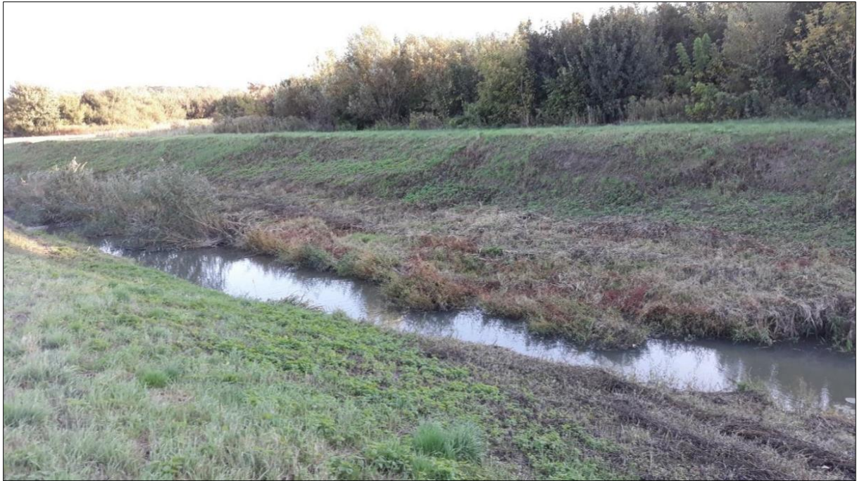
Slika 3. Rijeka Vučica; (K. Matanović).

Kliničkim pregledom invadiranih primjeraka uočena su uzdignuća kože smještena obostrano u području leđa, između glave i leđne peraje. Kod jednog je primjerka na uzdignuću kože nastao čir iz kojeg izlazi bjelkasti sadržaj (slika 4.). Kod invadiranih primjeraka nisu uočene promjene u ponašanju.