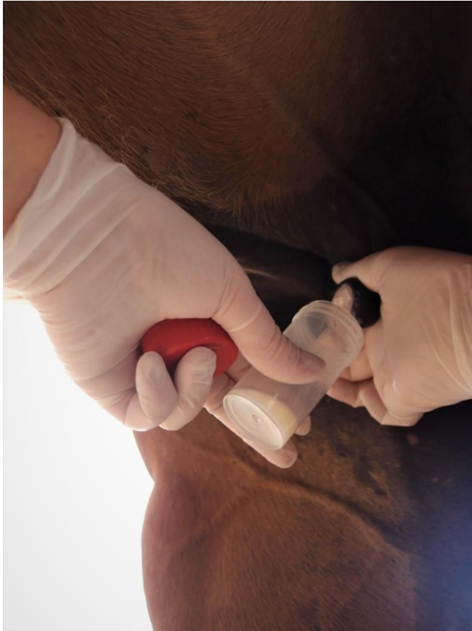
Slika 6: Izgled dobivenog sekreta vimena