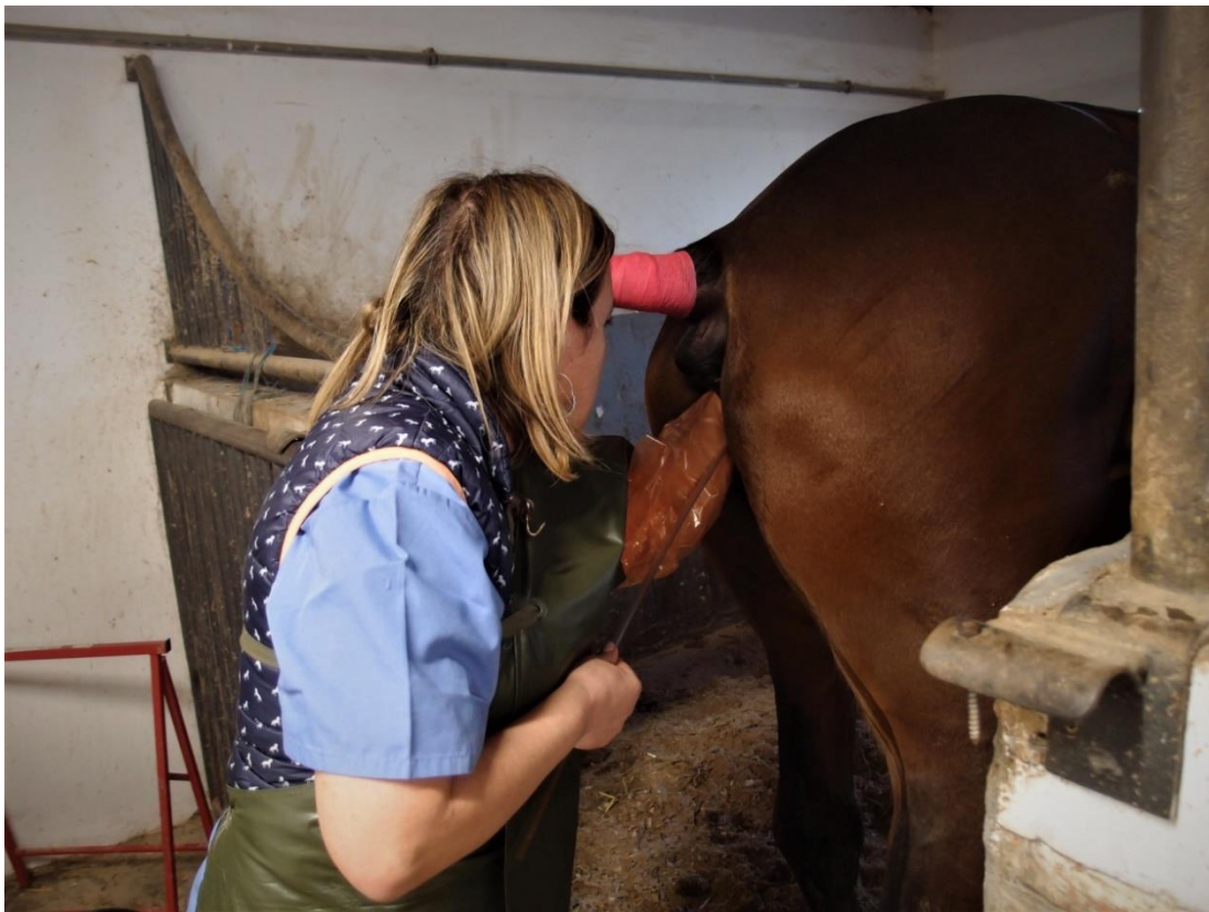
Slika 1: Uzimanje brisa endometrija

liječenje upalnih stanja. Kobili su osim endometrijskog brisa, nakon temeljitog pranja i dezinfekcije vimena pjenušavim plivaseptom, sterilno uzeti i uzroci sekreta vimena za citološku, bakteriološku i biokemijsku analizu. Uzeti su uzorci krvi za hemalotošku i biokemijsku pretragu te određivanje koncentracije adrenokortikotropnog hormona (ACTH) u plazmi.