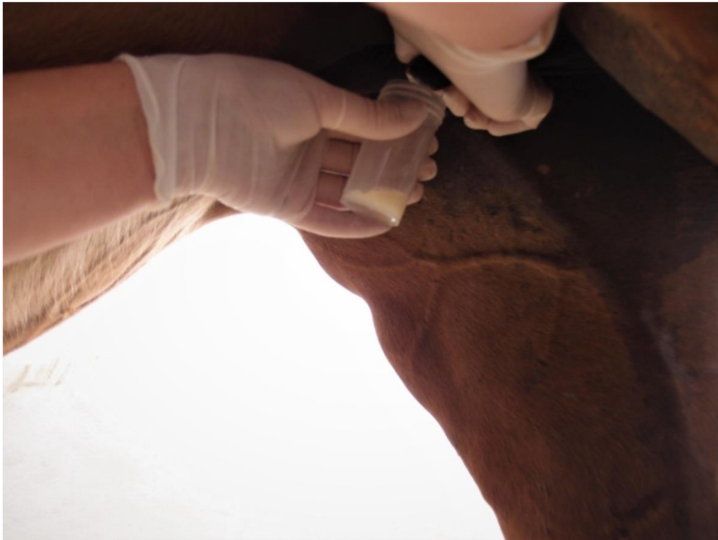
Slika 2: Uzimanje sekreta vimena za bakteriološku pretragu