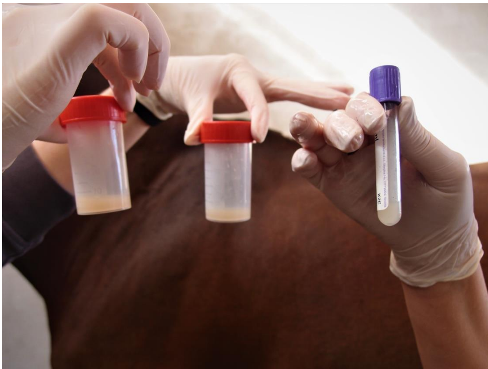
Slika 3: Prikupljeni uzroci sekreta vimena za citološku, bakteriološku i biokemijsku analizu