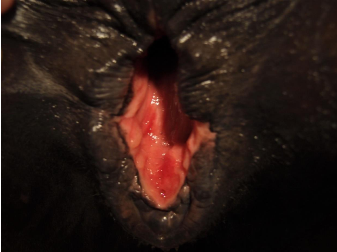
Slika 4: Inspekcija rodnice